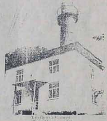
Yeşilyuva Camii (Eski Minare 1981)