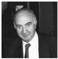
ΓΡΑΦΕΙ: Ο φιλόλογος Παναγιώτης Αντ. Παπαδέλος

Στο πρώτο φύλλο της ΒΥΤΙΝΑΣ του 2021 είχαμε γράψει ότι Στιμώντας τα 200 χρόνια από την έναρξη της επανάστασης του 1821 θα παρουσιάσουμε σε όλα τα φύλλα της εφημερίδας του 2021 γεγονότα οποιασδήποτε μορφής που σχετίζονται με την Βυτίνα.