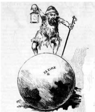
Γεωιογραφία του Ποταγού από τον «Ασμοδαίο»

Από τη στήλη «Διαβολοσκοπήματα» (τ.241-15/09/1883) ξεκινά η επίθεση: «Εξεδόθησαν τέλος οι «Περιηγήσεις» του κ. Π. Ποταγού, του εκ Γορτυνίας Σεβάχ Θαλασσινού, όστις προχώρησε μέχρι των ενδοτέρων της Ασίας. Η πτωχή εις τον κλάδον αυτόν φιλολογία μας έχει επί τέλους εν βιβλίον, δυνάμενον μάλιστα να διαγωνισθή ιδίως κατά την μυθιστορικήν πλοκήν, προς τον «Περίπλου των γής» του Αρα-