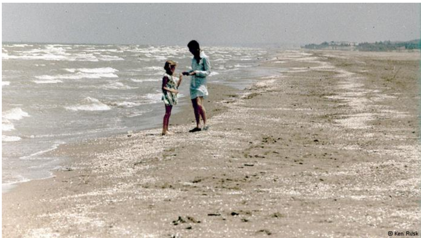
کن راسک هم‌اکنون بیش از ۸۰ سال سن دارد و در تورنتو زندگی می‌کند