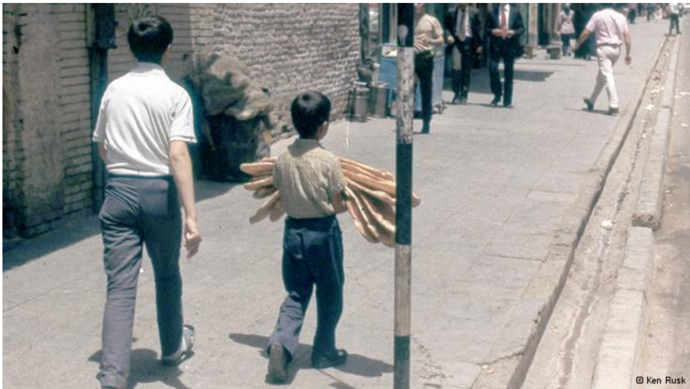
تهران حوالی سال ۱۳۵۰