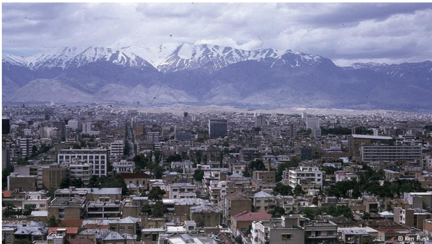
تهران حوالی سال ۱۳۵۰ خورشیدی با نمایی از البرز