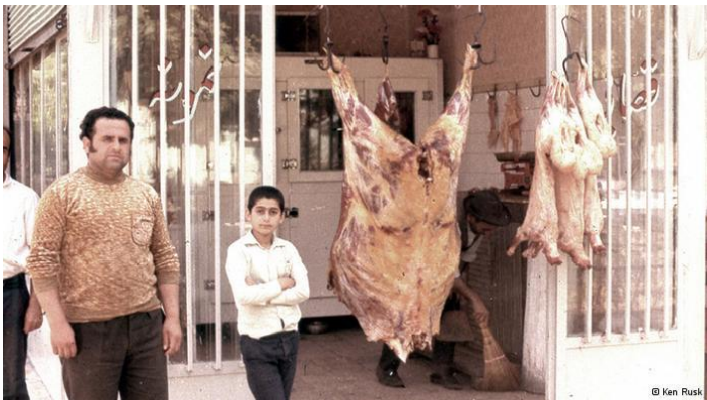
کن راسک در مدت حضور در ایران به اکثر شهرهای ایران همچون، شیراز، کرمان، شمال و... سفر کرده است.