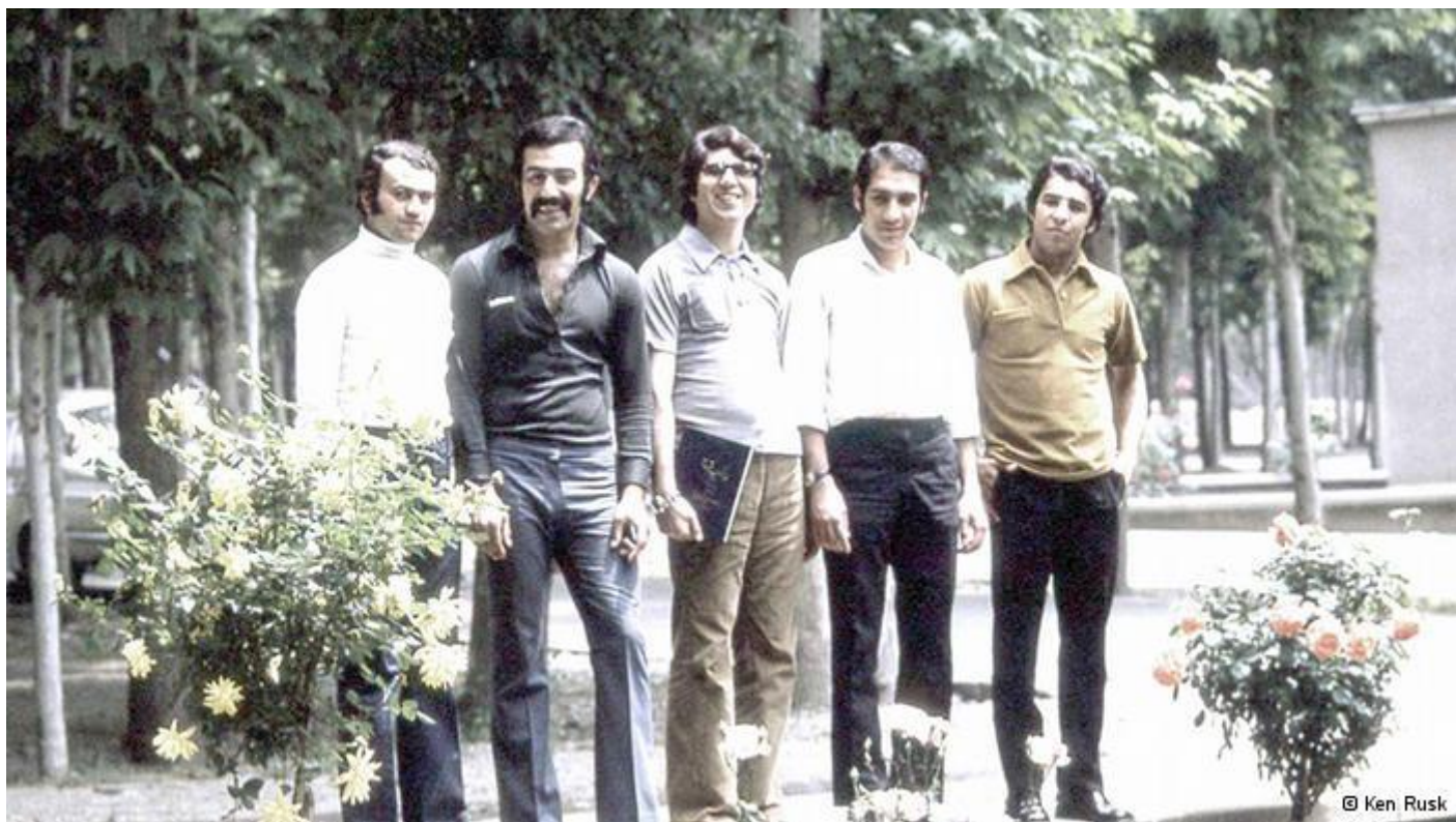
تهران حوالی سال ۱۳۵۰