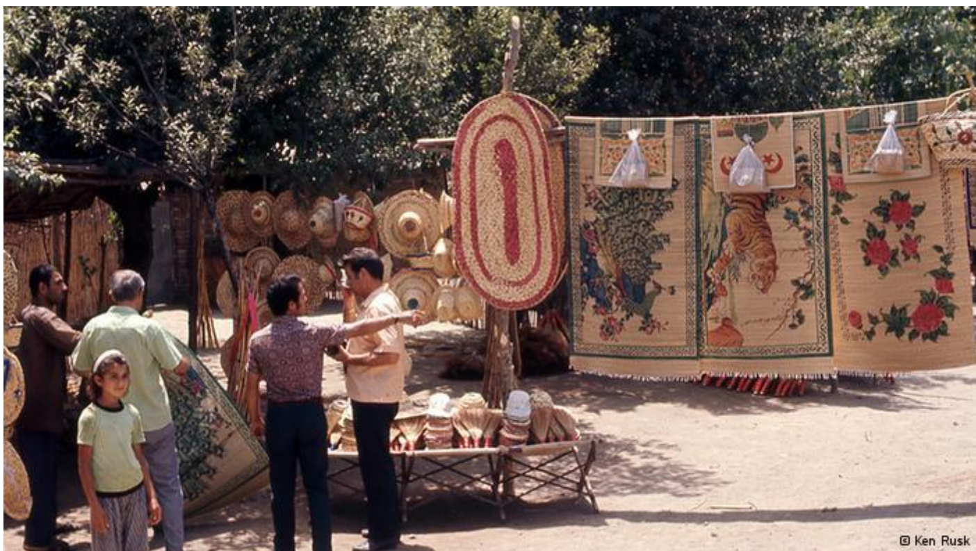
محل برگزاری جشن‌های ۲۵۰۰ ساله در کنار کاخ تخت جمشید حوالی سال ۱۳۵۰ خورشیدی