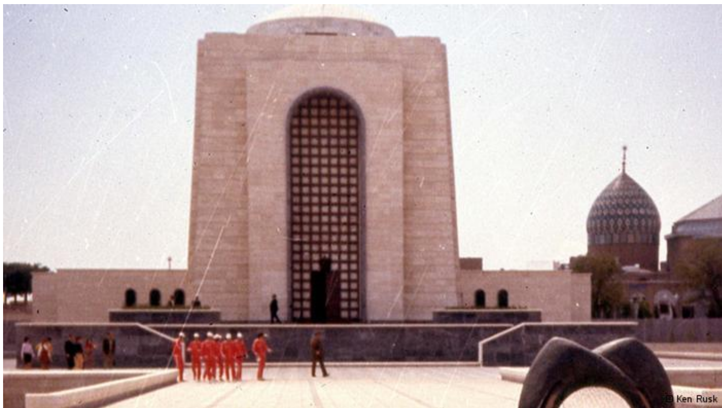
آرامگاه رضاشاه حوالی سال ۱۳۵۰