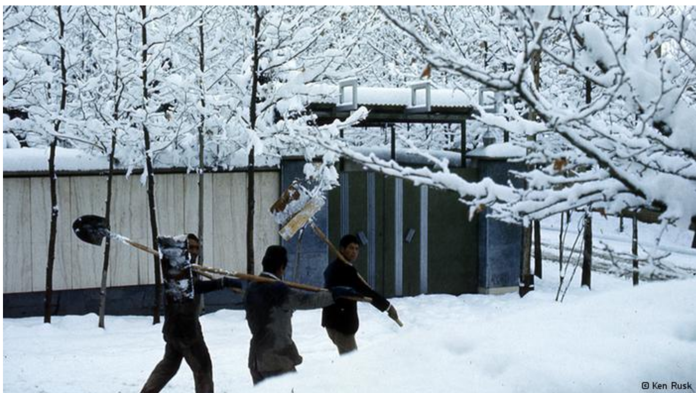
تهران حوالی سال ۱۳۵۰