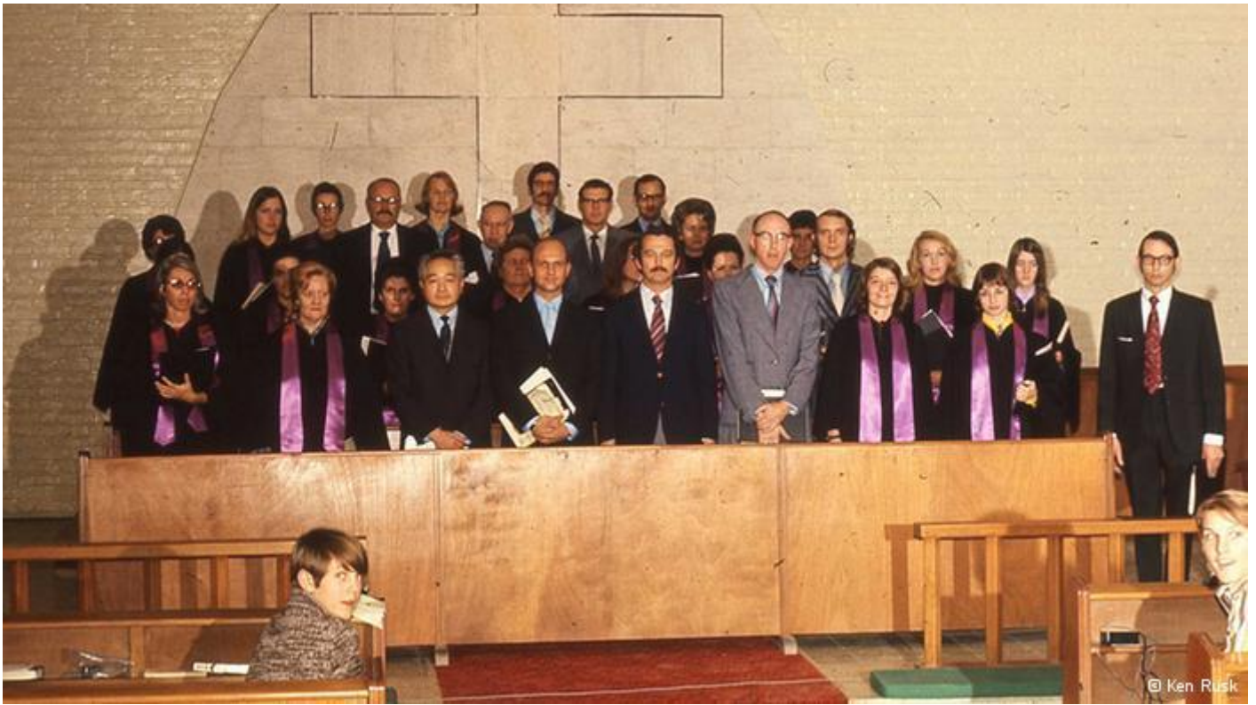
کلیسای تهران که حاضران در آن ترکیبی از ارمنه و خارجی‌های مقیم ایران بودند