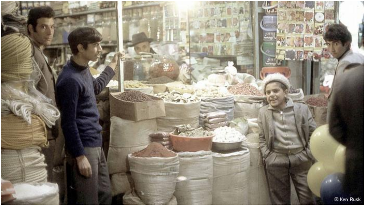
بازار تهران حوالی سال ۱۳۵۰