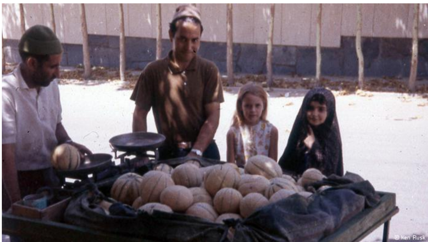
کن راسک می‌گوید در زمان حضور در ایران فرزنداناش آرام آرام زبان فارسی را فرا گرفتند و مردم کوچه و خیابان از حرف زدن با لهجه‌ی آنها لذت می‌بردند.