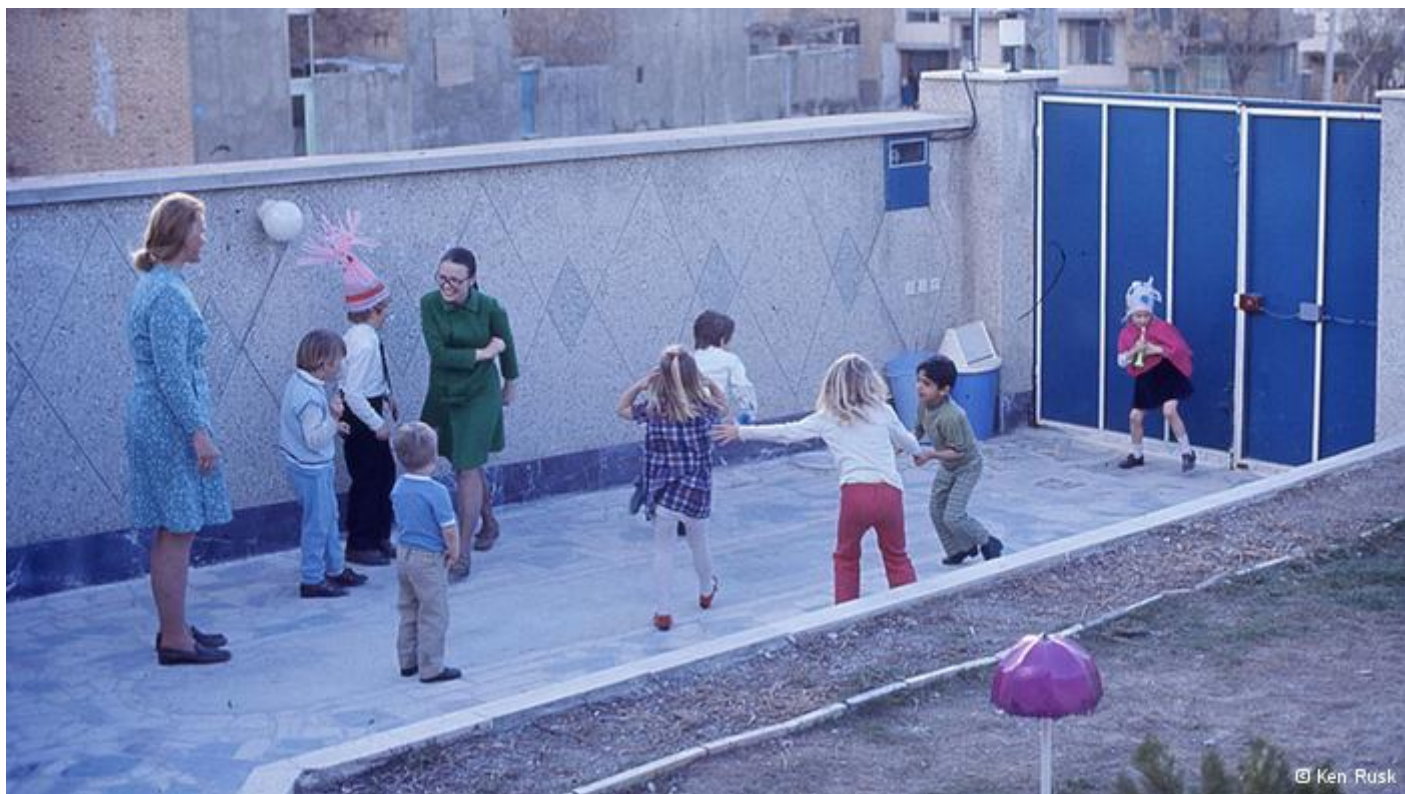
رزندان کن که در عکس‌ها کودک هستند الان بین ۵۰ تا ۶۰ سال سن دارند.