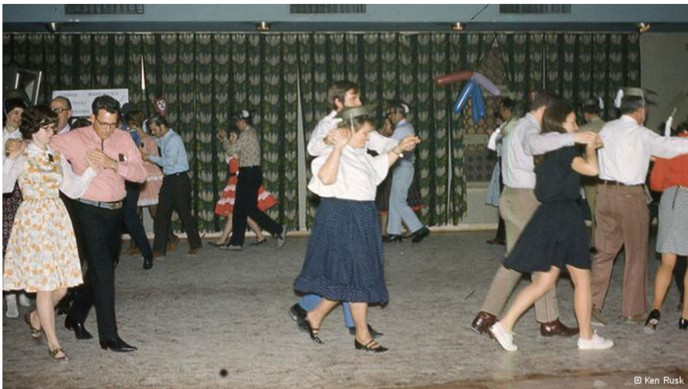
عکس‌های این مجموعه حدود چهل سال روی فیلم اسلاید در انباری کن راسک در تورنتو نگه داشته شده بودند.