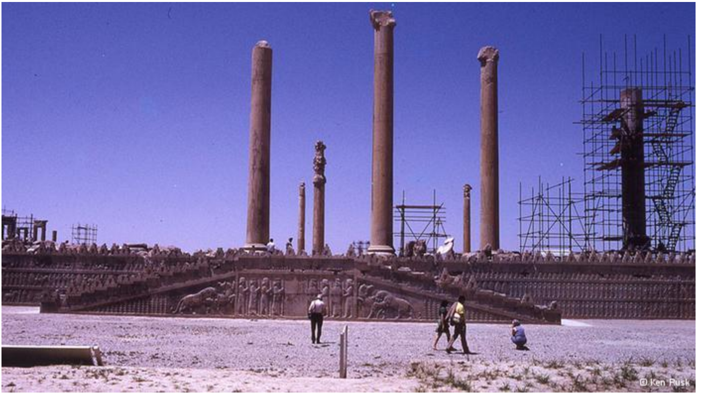
تخت جمشید و آمادگی برای شروع جشن‌های دو هزار و پانصد ساله