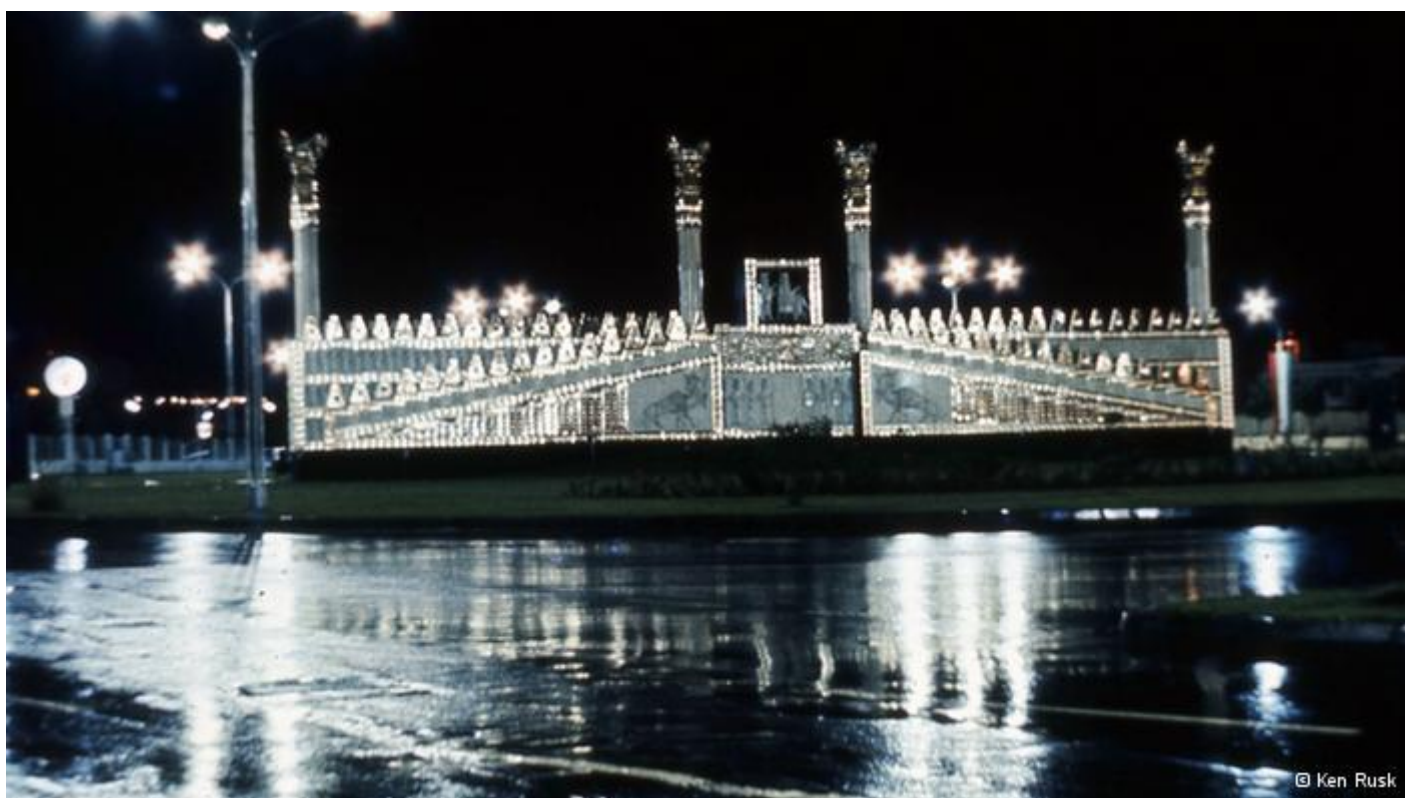
نمایی از میدان ونک در سال‌های ۱۳۵۰ تا ۱۳۵۱ خورشیدی به مناسبت جشن‌های ۲۵۰۰ ساله