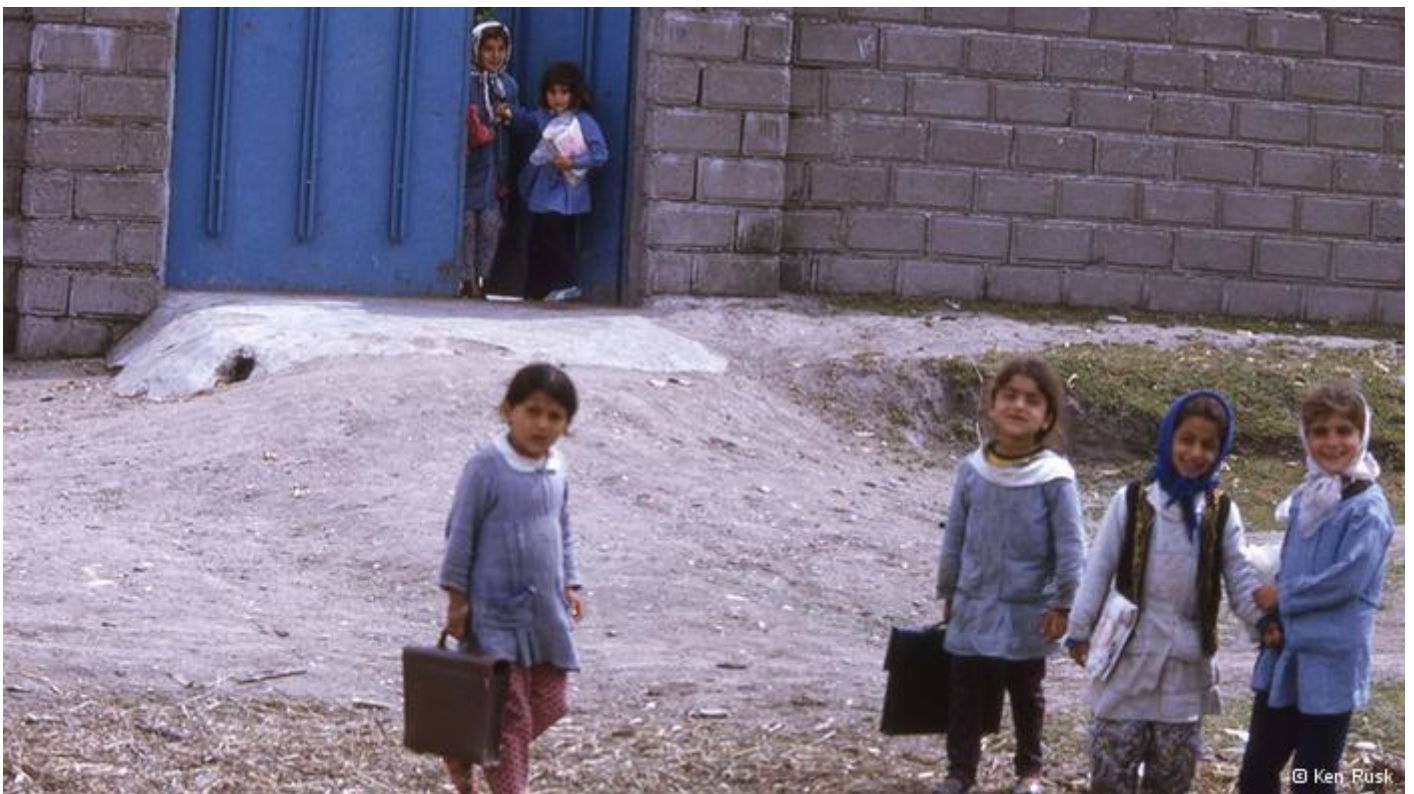
علی پس از ظهور این عکس‌ها کلیپی هم از آن‌ها تهیه کرده و به همراه توضیحاتی از کن راسک در سایت یوتوب قرار داده است www.youtube.com/watch?v=cbUmlw1c8n4