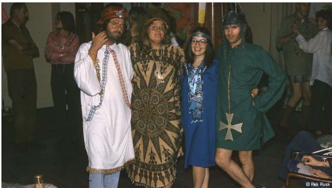
علی می‌گوید اجتماع خارجی‌های مقیم ایران در آن‌زمان که یکدیگر را در کلیسا یا مراسم‌های سفارت پیدا می‌کردند جالب بوده است.