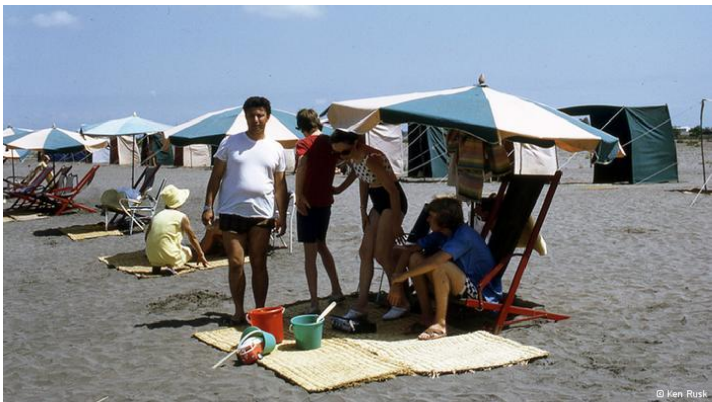
سواحل دریای خزر در سال ۱۳۵۰