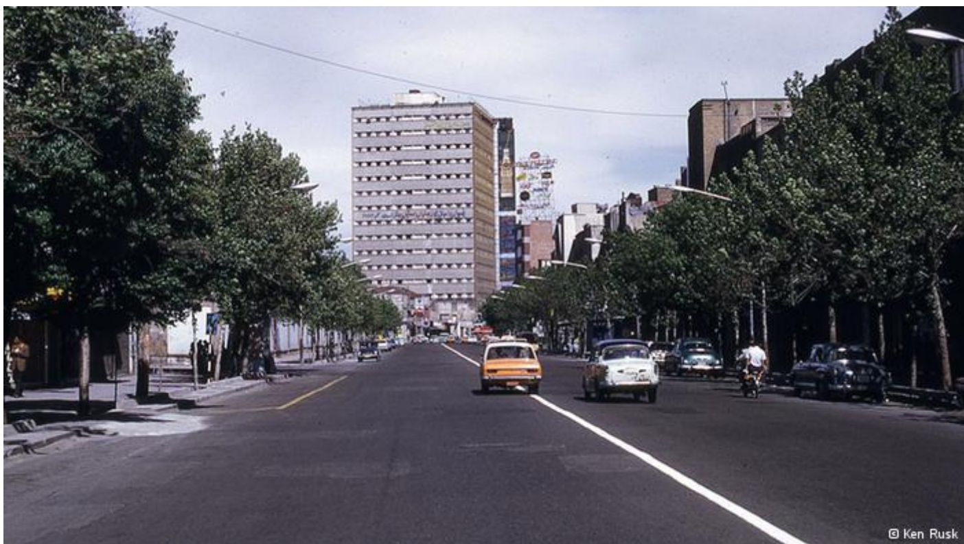
عکسی از اصفهان حوالی سال ۱۳۵۰