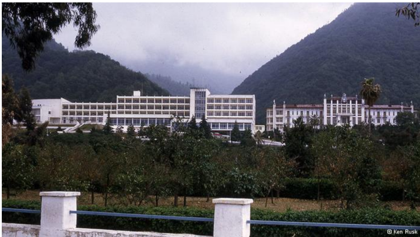
نمایی از هتل رامسر در سال ۱۳۵۱ که بسیاری از توریست‌های اروپایی و آمریکایی به آنجا می‌آمدند و شهرت جهانی داشت.