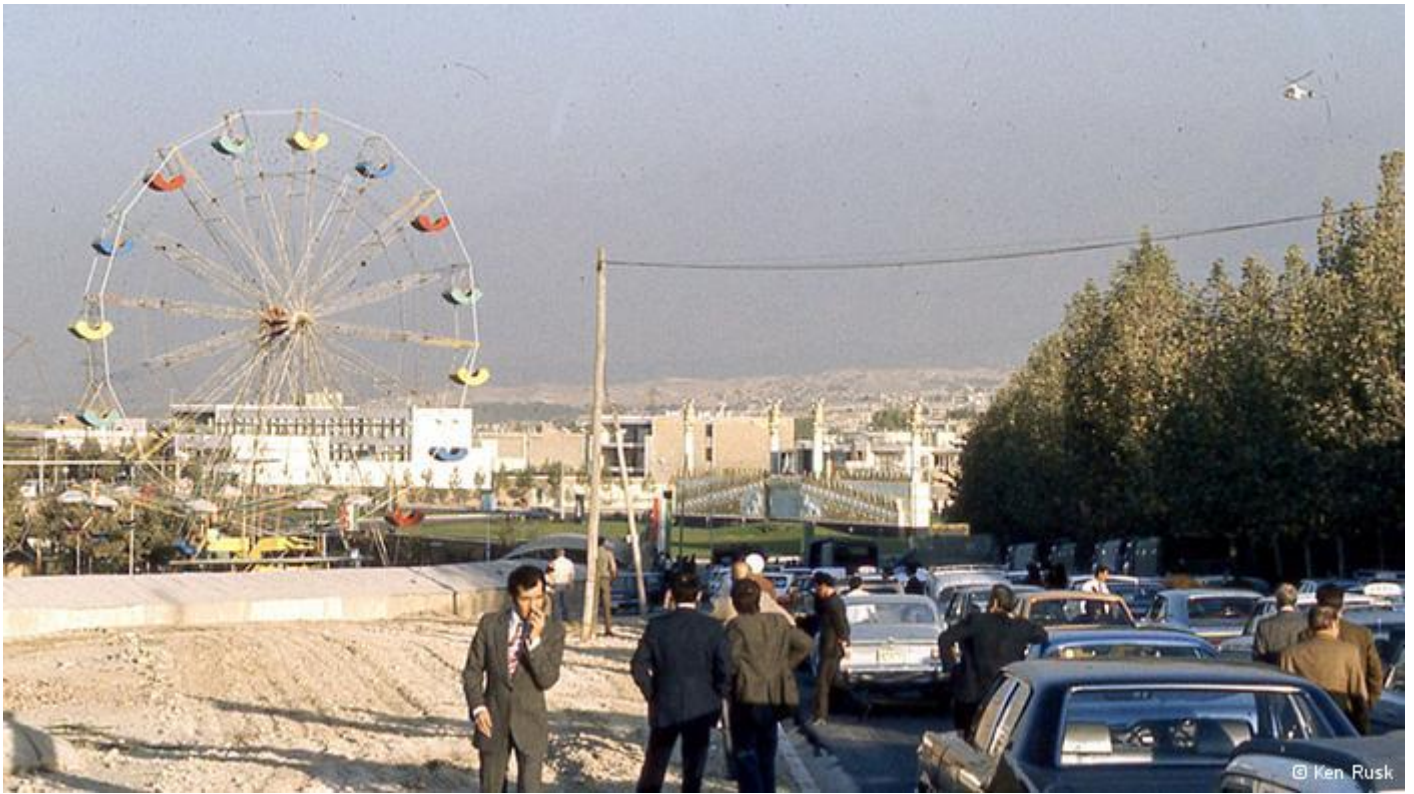
میدان ونک تهران حوالی سال ۱۳۵۰