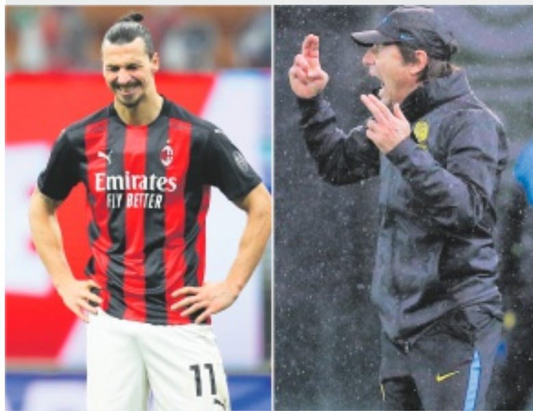
DELUSI Zlatan Ibrahimovic e Antonio Conte (che recupera un punto)