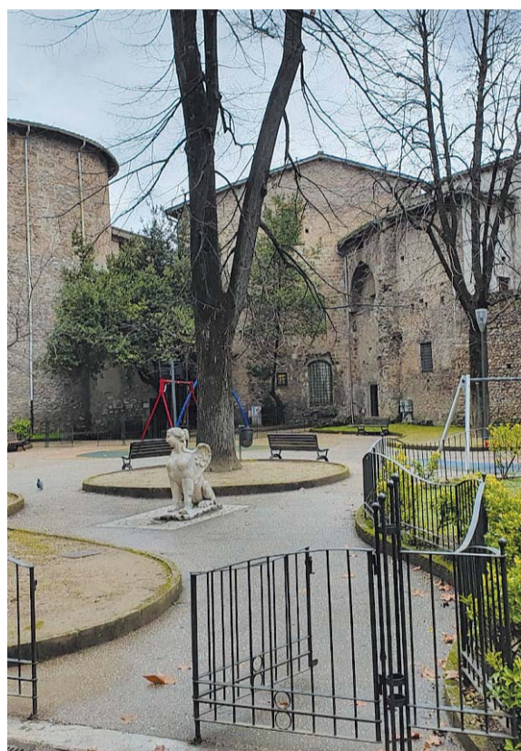
Il parco dei ternani Il Comune lo acquistò 175 anni fa. Al suo interno ci sono l'anfiteatro romano e l'ex chiesa del Carmine dichiarata inagibile dopo il terremoto a causa dei danni riportati dal tetto