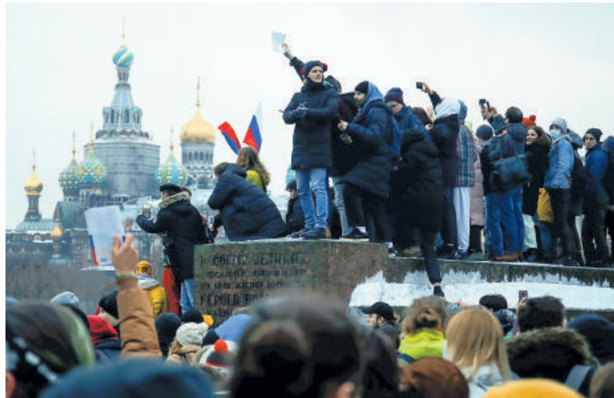
Manifestanti in piazza contro l'arresto del dissidente russo Alexej Navalny

LAPRESSE AGLIASTRO, IACOBONI - PP. 14-15