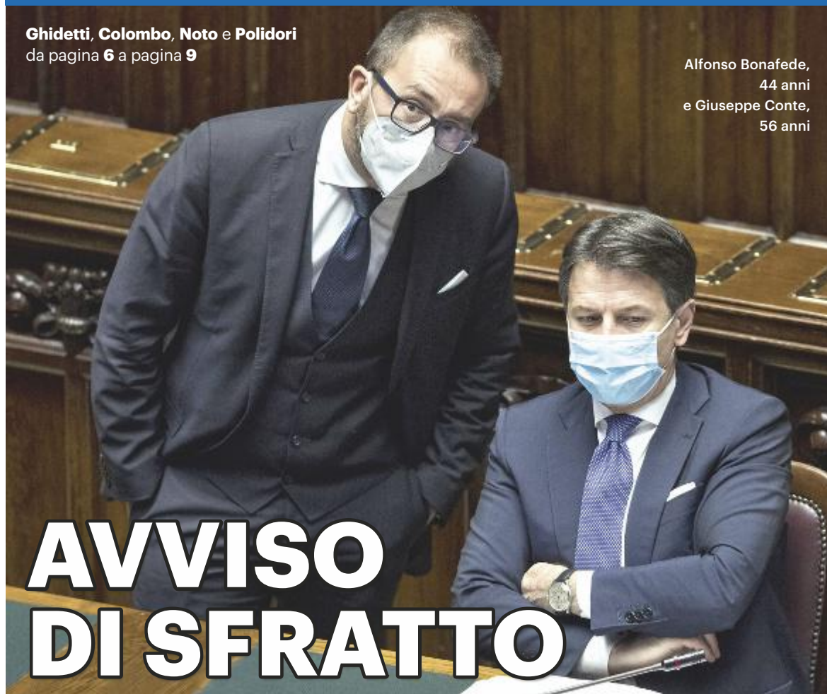
Alfonso Bonafede, 44 anni e Giuseppe Conte, 56 anni