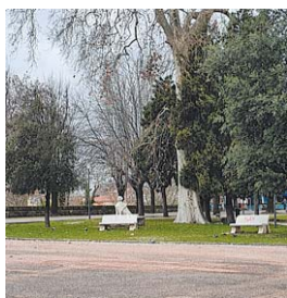
Cambia il volto della città