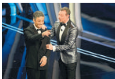
Fiorello e Amadeus lo scorso anno

Esplode la polemica, nella tradizione che non c'è Sanremo senza patemi d'animo e problemi. Sanremo sì, Sanremo no, Sanremo forse. Il Festival compie 70 anni il 29 gennaio e, per festeggiarlo, il mondo crudele gli ha apparecchiato questa bella grana della pandemia, un capolavoro. La Rai vuole andare in onda a tutti i co-