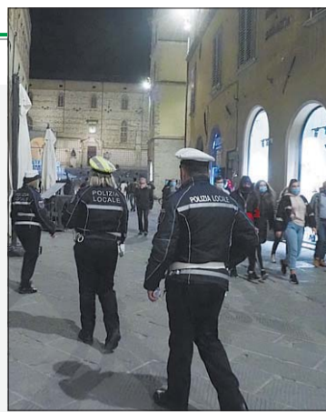
In servizio Agenti della polizia locale

senza mascherina e assembrati tra loro. Anche la scorsa settimana le forze dell'ordine erano state costrette a disperderli urlandogli contro con l'altoparlante. Ieri il copione è stato più o meno lo stesso. Nella giornata di venerdì invece, secondo quanto rende noto