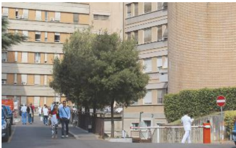
L'ospedale 'Santa Maria', frontiera dell'emergenza e al centro delle polemiche