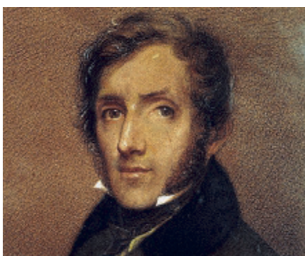
CAPOSALDO Alessandro Manzoni, 1785-1873

Abbiamo rimosso Manzoni, papà della nazione tradito dalla sinistra