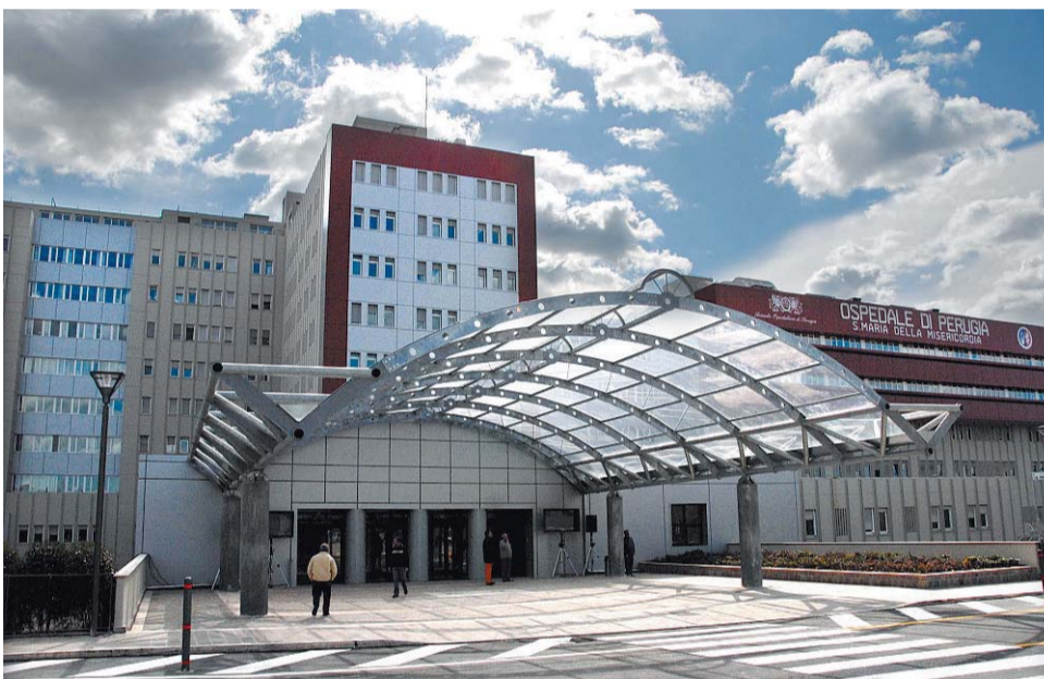
Il tentativo I medici del Santa Maria della Misericordia hanno cercato di salvare la donna, arrivata già in gravi condizioni

mentre l'operazione era in corso. Di lì la corsa