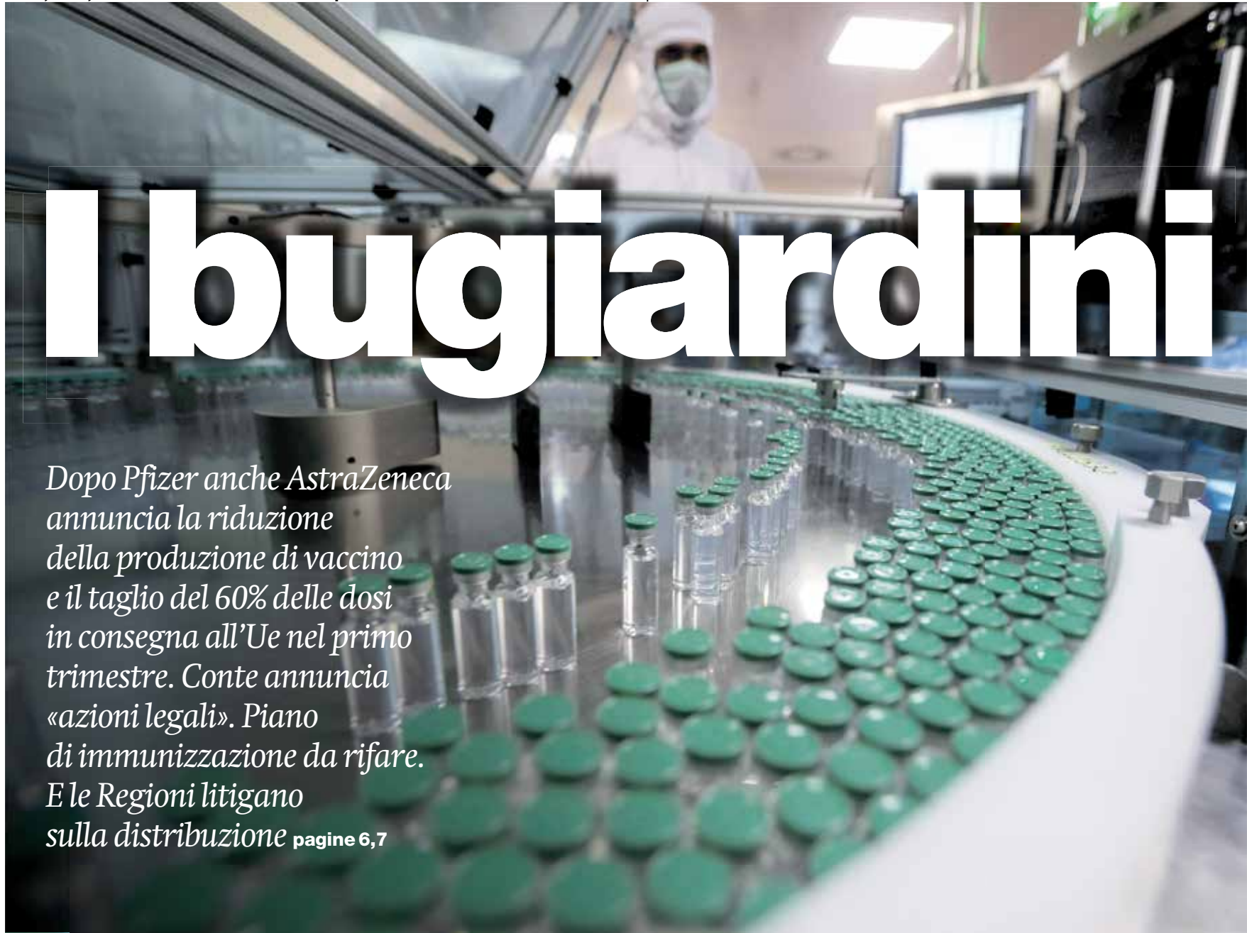
Pune, India, il vaccino AstraZeneca/Oxford in produzione al Serum Institute of India