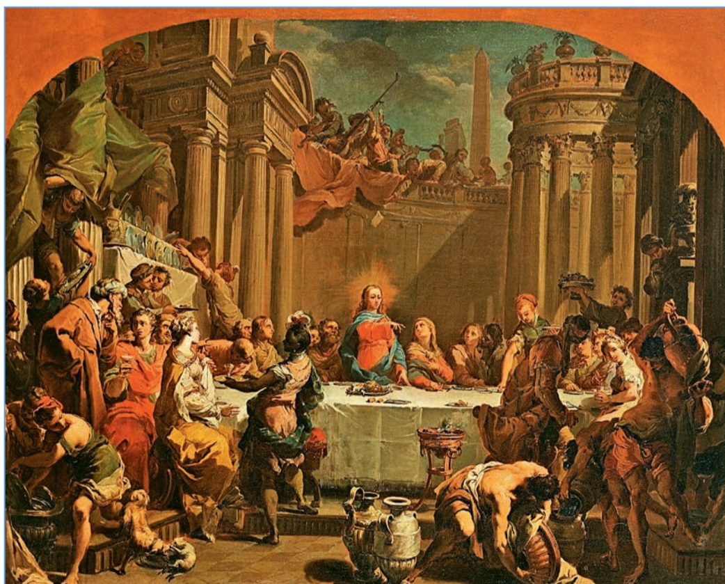
Гаєтано Гандольфі (1734–1802), «Весілля в Кані Галілейській», 1766 р.

Все таки Ісус не абсолютизує родину і не говорить, що вона є найбільшою цінністю на землі. Вищою від неї є воля Божа: «Хто виконує волю Богу, той Мені брат, сестра і мати» (Мк 3, 31–35). Таким чином