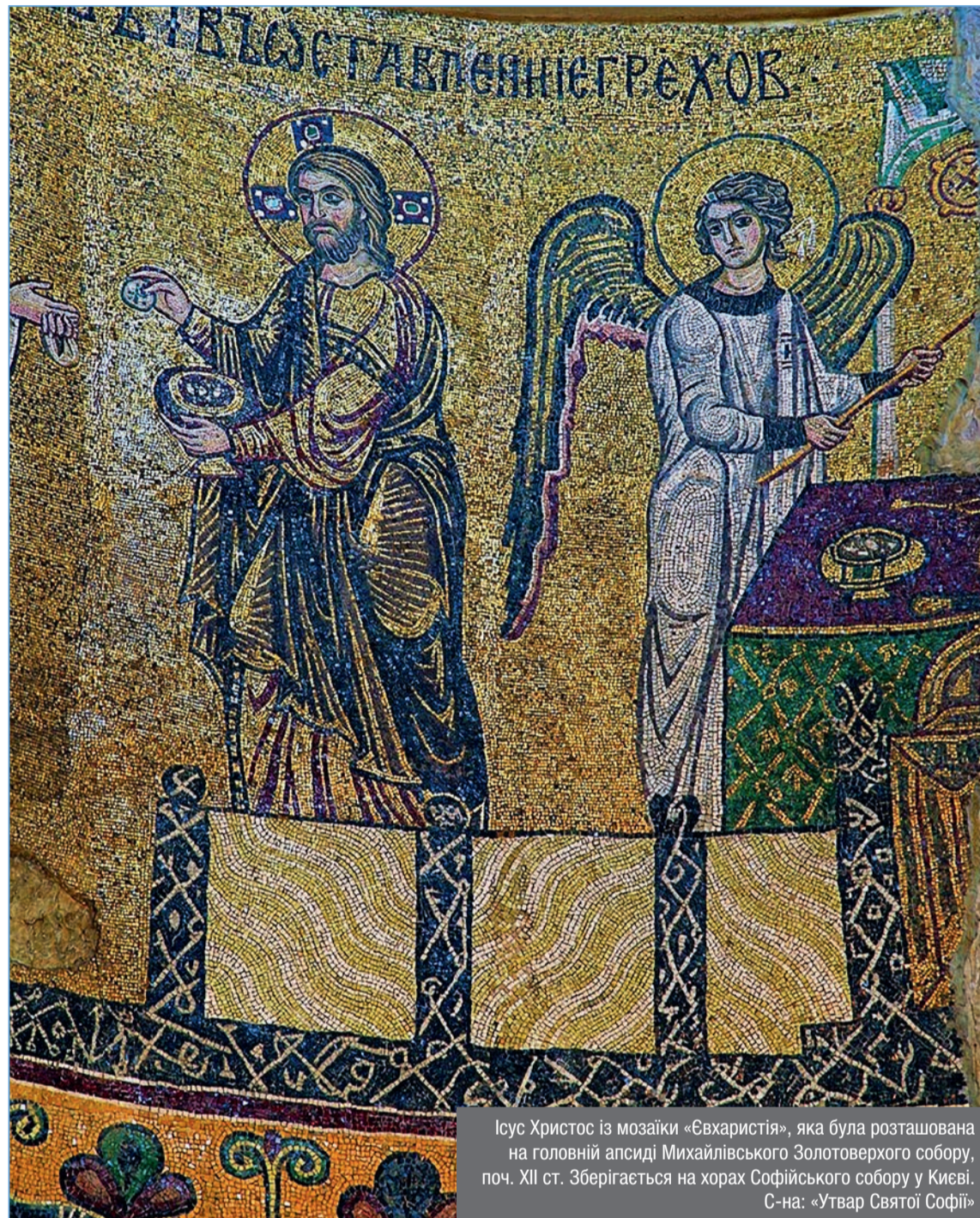
Ісус Христос із мозаїки «Євхаристія», яка була розташована на головній апсиді Михайлівського Золотоверхого собору, поч. XII ст. Зберігається на хорах Софійського собору у Києві.

Тоді як у Літургії св. Івана Золотоустого в скороченні подане діло відкуплення, то св. Василій Великий докладно подає як Бог Отець усіма способами старався піднести й спасти упалий рід людський: найперше через пророків,