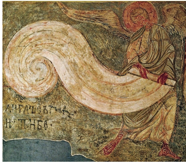
Кирилівська церква, фреска XII ст. На композиційному полі представлена фреска, вона відома як «Янгол, який згортає небо», – янгол стоїть посеред буревію, ледве втримуючи рівновагу, й виконує Божий наказ... «А як люди дізнаються, що час збиратись на Страшний суд? Всевишній покличе одного з янголів – і той буде згортати небо у сувій.» С-на та текст: Музей «Кирилівська церква»; Ірина Марголіна для RISU

У численних документах Церкви говориться, що часи антихриста вже настали. Його наступ перемаже не людина, а Бог. У книзі Одкровення мовиться, що триумф добра у подоланні зла набере форм Страшного суду (пор. Од 20, 12). Незважаючи на те, що Отець не прослав Сина у світ судити, а світ спасти, все таки Отець Синови дав суд увесь (пор. Ів 5, 22). Отож, у цьому житті той, хто вірує в Нього, не буде засуджений, а хто не хоче вірувати в Нього, той уже засуджений (пор. Ів 3, 18).