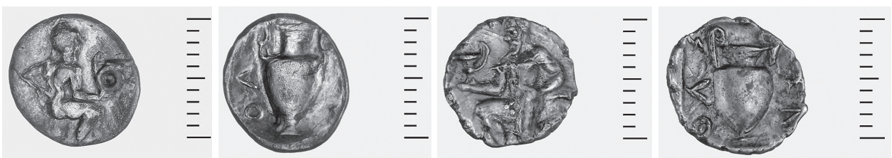
Εικ. 6. Ασημένια νομίσματα Θάσου.