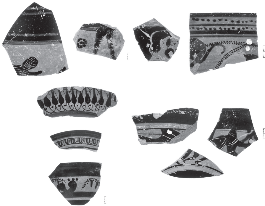
Εικ. 4. Θραύσματα ερυθρόμορφων και μελανόμορφων αγγείων.