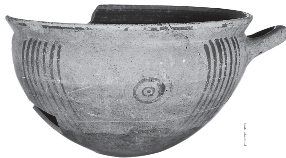
Εικ. 8. Αγγείο κεραμικού εργαστηρίου «Φαρί» Θάσου.