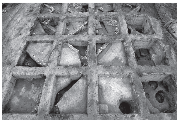
Εικ. 2. Κάτοψη ανασκαφής, από νότια.