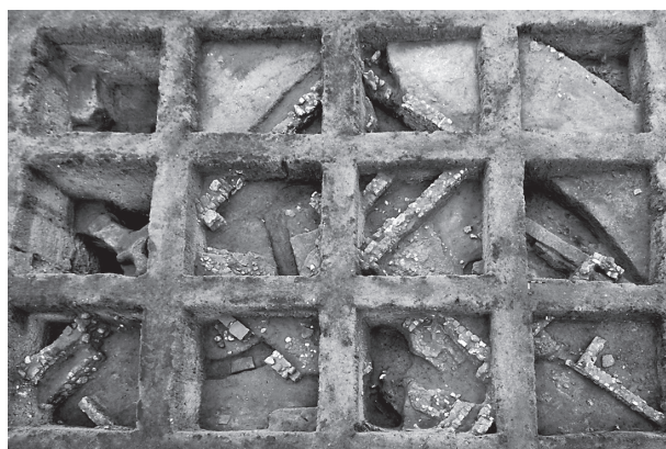
Εικ. 1. Κάτοψη ανασκαφής, από βόρεια.