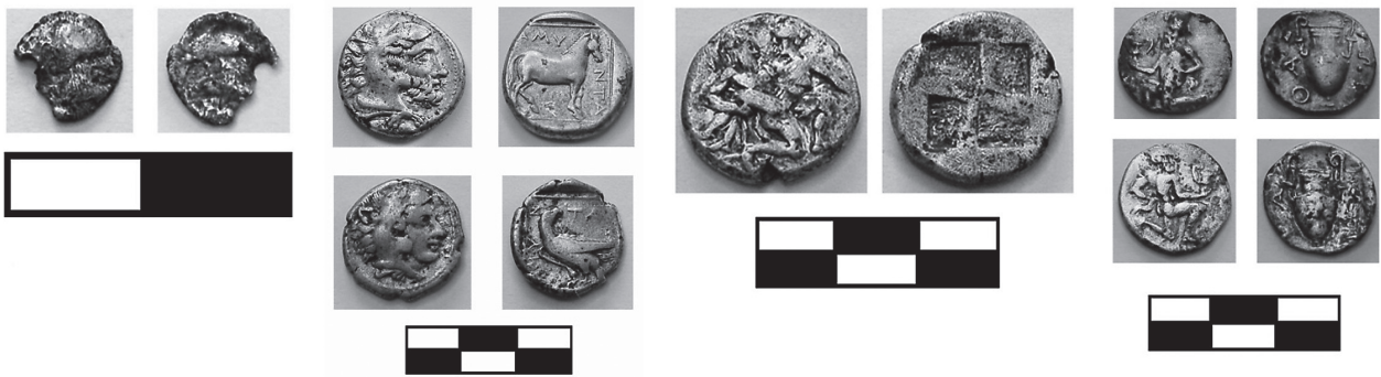
Εικ. 5. Θησαυρός 80 ασημένιων νομισμάτων.