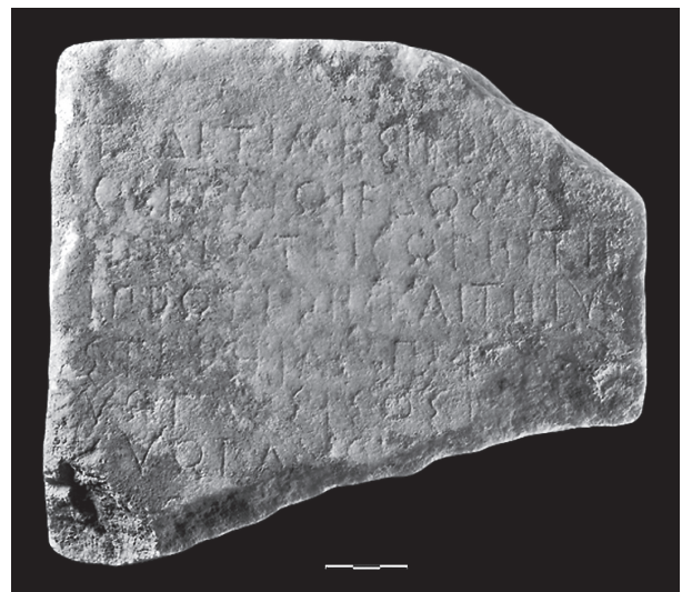
Εικ. 10. Επιγραφή σε παριανό αλφάβητο.