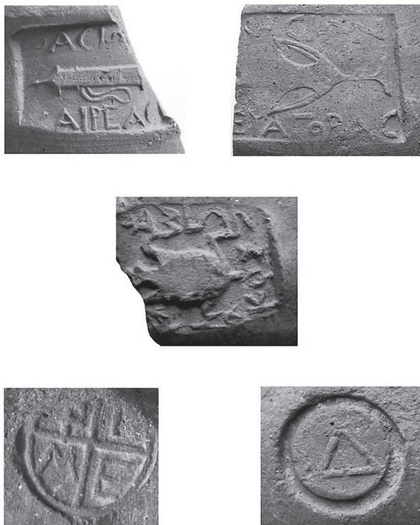
Εικ. 9. Ενσφράγιστες λαβές θασιακών και άλλων αμφορέων.