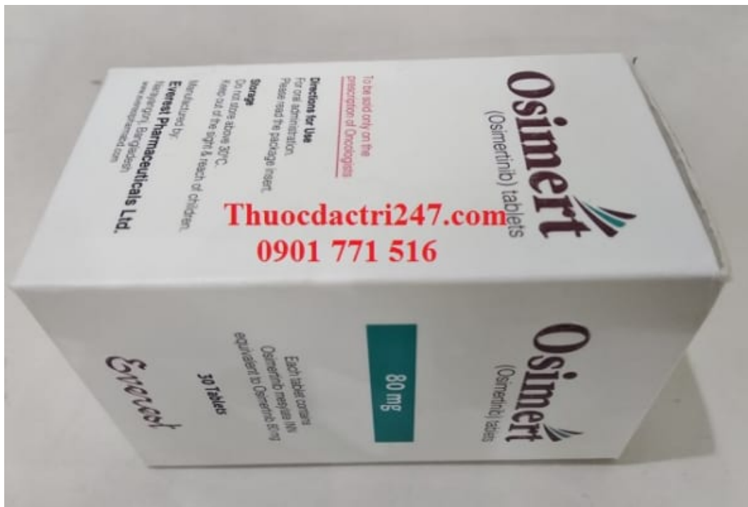
Thuốc osimert 80mg osimertinib điều trị ung thư phổi – Thuốc đặc trị 247 (1)