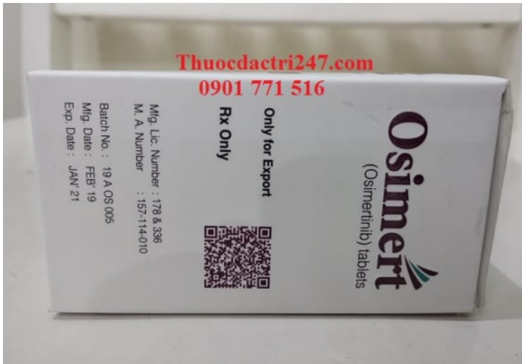
Thuốc osimert 80mg osimertinib điều trị ung thư phổi – Thuốc đặc trị 247 (2)