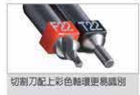
切割刀配上彩色輪環更易識別