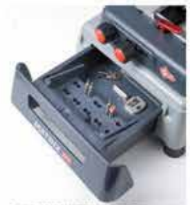
鎖匙切割機附有抽屜