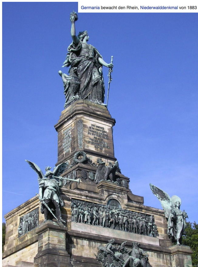
Germania bewacht den Rhein, Niederwalddenkmal von 1883

...Αυτό ήταν το "κόλπο". Όποιοι κατάφερναν και περνούσαν τον Ρήνο, δεν ενδιέφεραν κανέναν ..."Χάνονταν" στη Ρωμαϊκή Αυτοκρατορία και οι επόμενοι, οι οποίοι θα "κολλούσαν" σ' αυτόν θα "ξαναγίνονταν" Γερμανοί