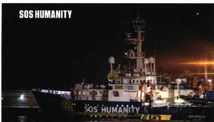
A sinistra e sopra, le varie navi per il soccorso dei migranti. La Geo Barents, per esempio, sembra agire come un centro di coordinamento degli interventi in mare. Molte delle Ong a cui fanno capo sono finanziate dalle chiese locali.

dalla Libia. «Le richieste di luogo sicuro di sbarco vengono avanzate quando si trovano ancora in acque di ricerca e soccorso libiche e maltesi senza coinvolgere gli Stati di bandiera della nave» si legge nella scheda sul modus operandi. «Ultimamente sembra che Geo Barents agisca come una sorta di OSC ( Coordinatore in mare degli interventi , ndr)». Oltre alla navi, la flotta delle Ong ha a disposizione tre aerei privati, Moonbird, Seabird e Colibrì, che decollano anche da Lampedusa e pattugliano il mare alla ricerca dei migranti. L'aspetto più incredibile è il «coordinamento» garantito da Alarm phone, il centralino dei barconi, che opera come un vero RCC (centro di soccorso) ricevendo chiamate dai migranti e inoltrando le informazioni rilevanti ad assetti Ong in mare».