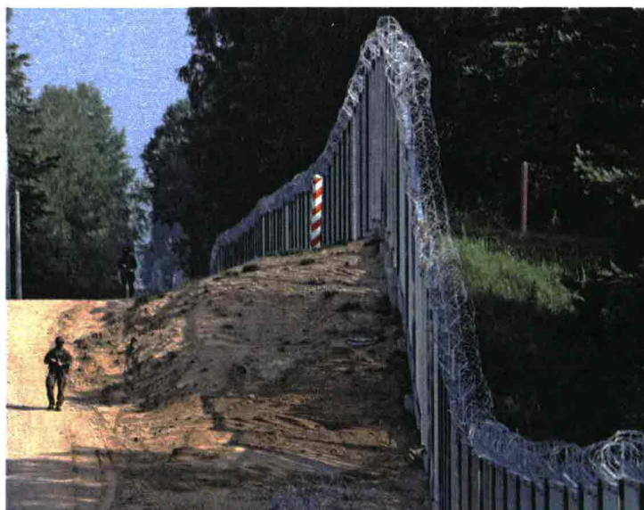
Sopra, soldati lungo il muro anti-migranti eretto dalla Polonia. A sinistra, migranti in fila davanti alla Questura di Trieste. Sotto, la premier della Danimarca Mette Frederiksen.

Il caso più clamoroso è quello danese , dove il blocco dei «rossi», come viene chiamata l'alleanza dei cinque partiti di sinistra, ha adottato la linea «zero immigrati» vincendo le elezioni. La premier socialdemocratica, Mette Frederiksen, ha scelto una terapia d'urto: i richiedenti asilo verranno trasferiti in Ruanda, come