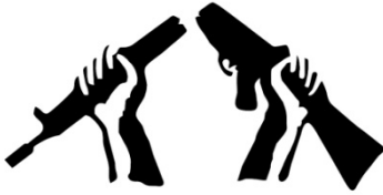
Şekil Şekil 17