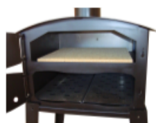
Tôle de 2 mm

Les flammes passent à l'arrière de la pierre pour venir cuire le dessus de la tarte flambée