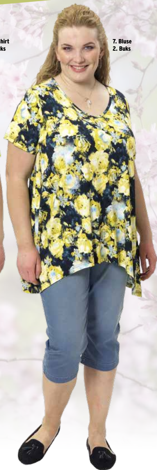
7. Bluse 2. Buks