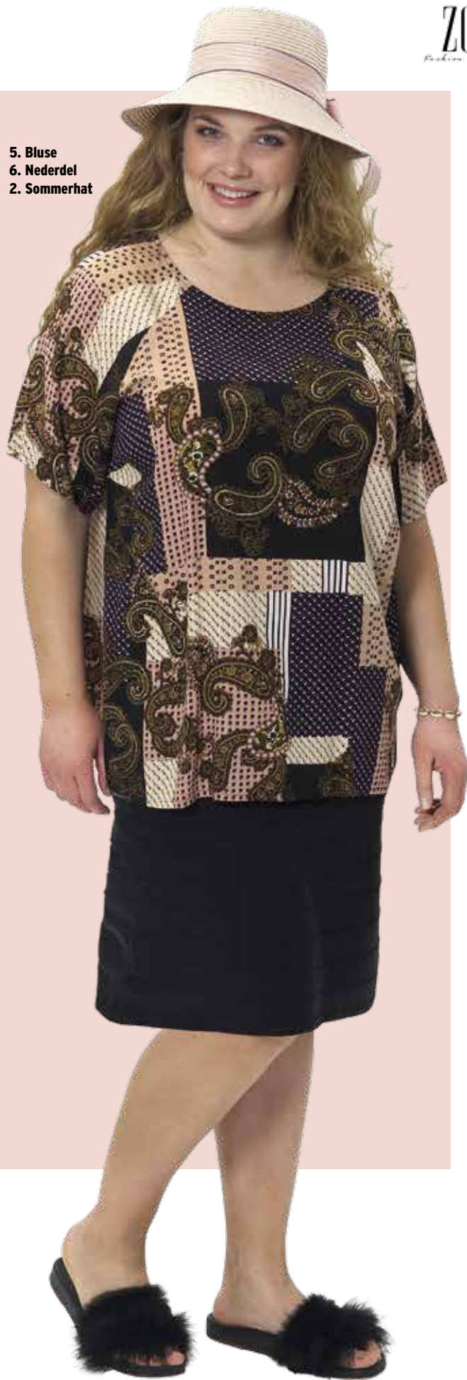
5. Bluse 6. Nederdel 2. Sommerhat