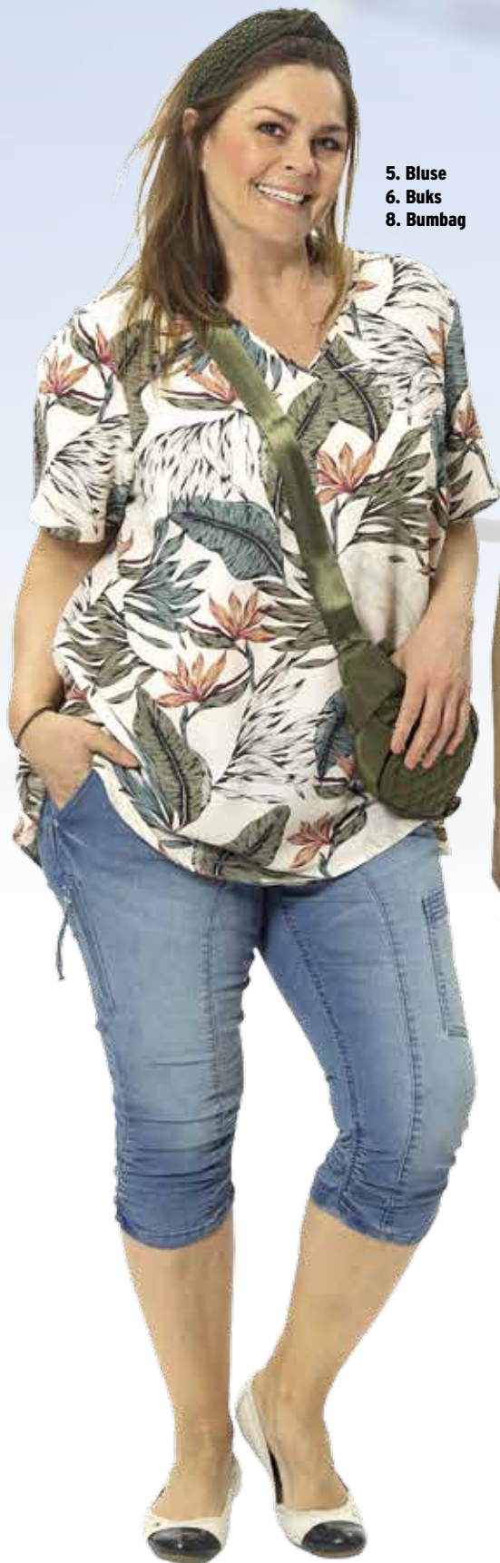
5. Bluse 6. Buks 8. Bumbag