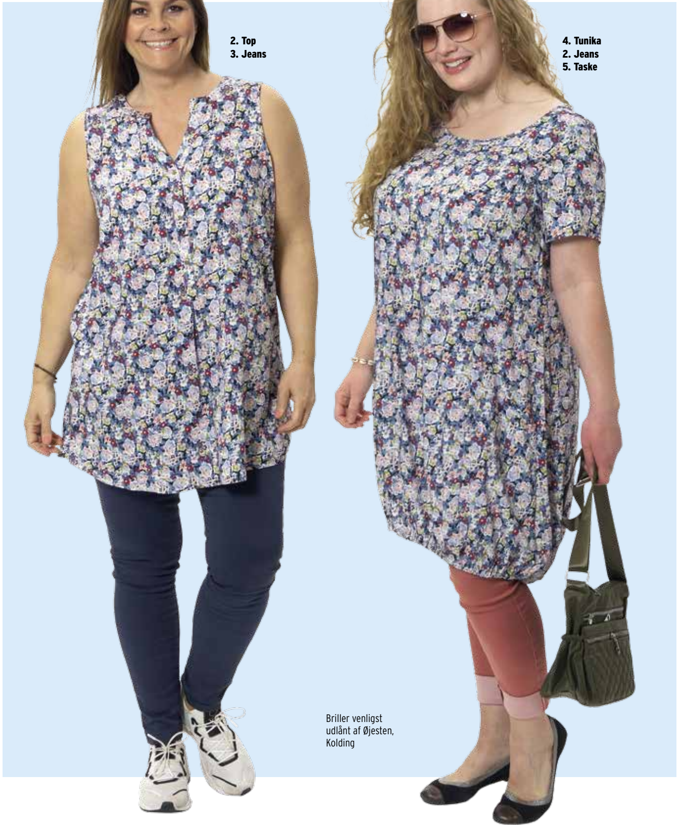
2. Top 3. Jeans