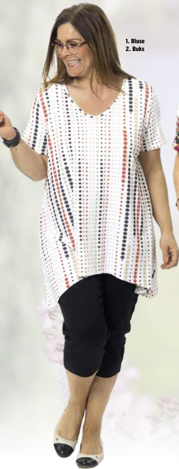
1. Bluse 2. Buks