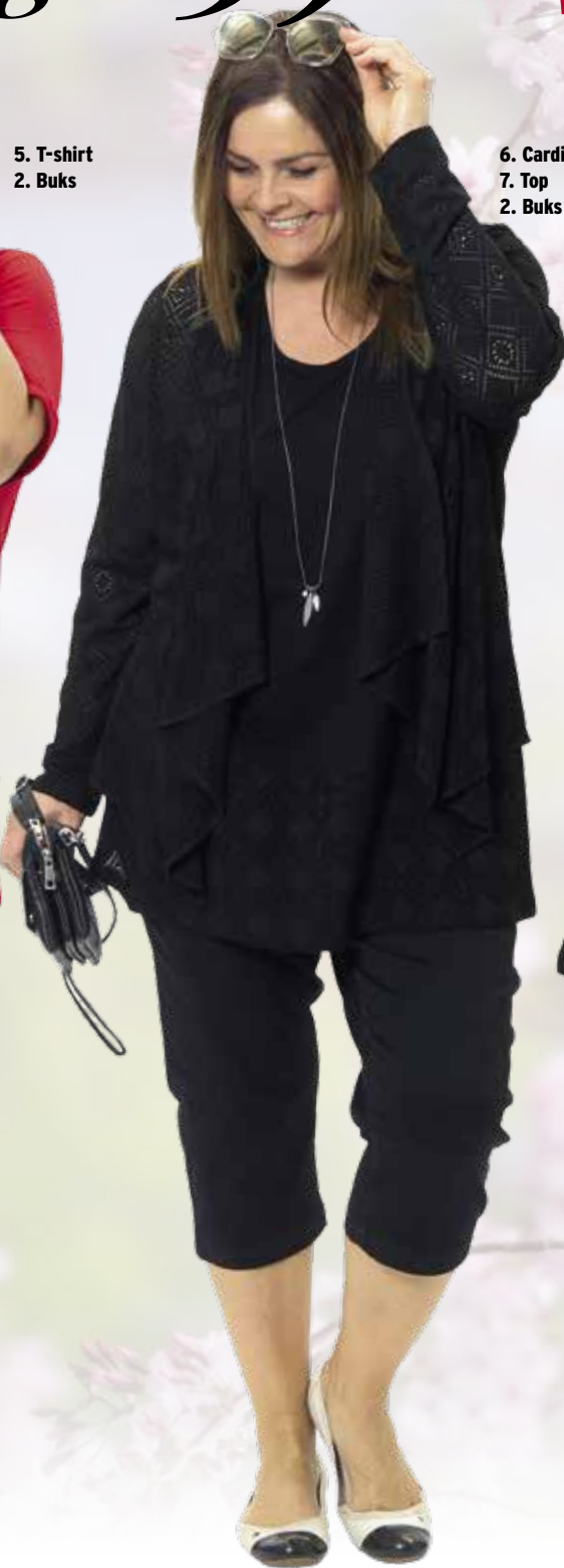
6. Cardigan 7. Top 2. Buks