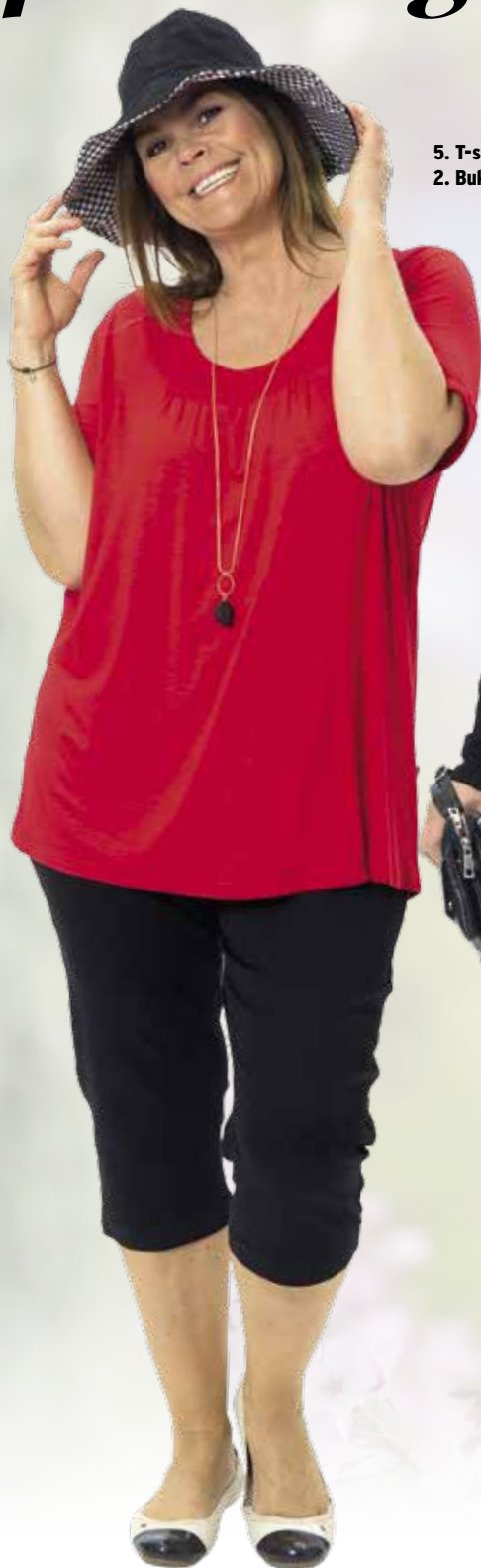
5. T-shirt 2. Buks