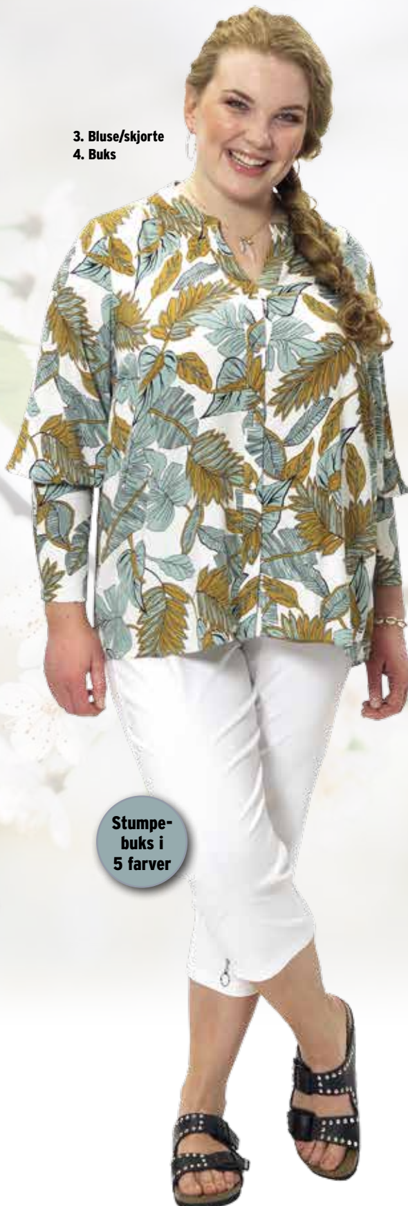
3. Bluse/skjorte 4. Buks

1. Kjole kr. 699 95 Smuk kjole fra Zoey i skøn let vaflet bomulds kvalitet. Kjolen har lynlås foran, korte ærmer og i let A-facon. Kjolen er ligeledes let foret. Fv. mint. Str. S-M-L-XL (42-56). Lgd. 108 cm. Kval. 100% bomuld. Vask 30°. Vare nr. 23118 -12