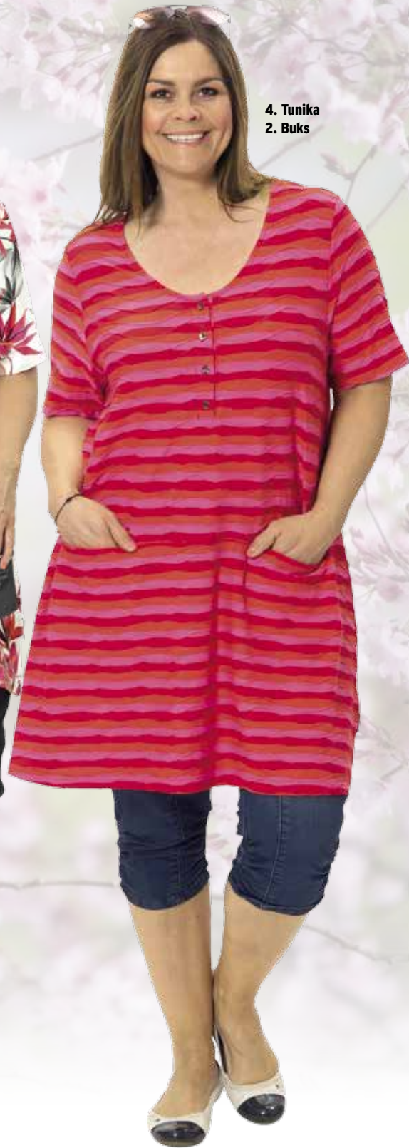
4. Tunika 2. Buks