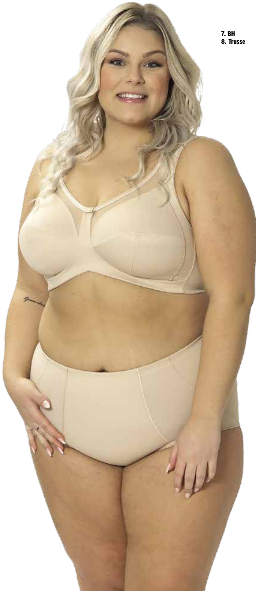
7. BH 8. Trusse