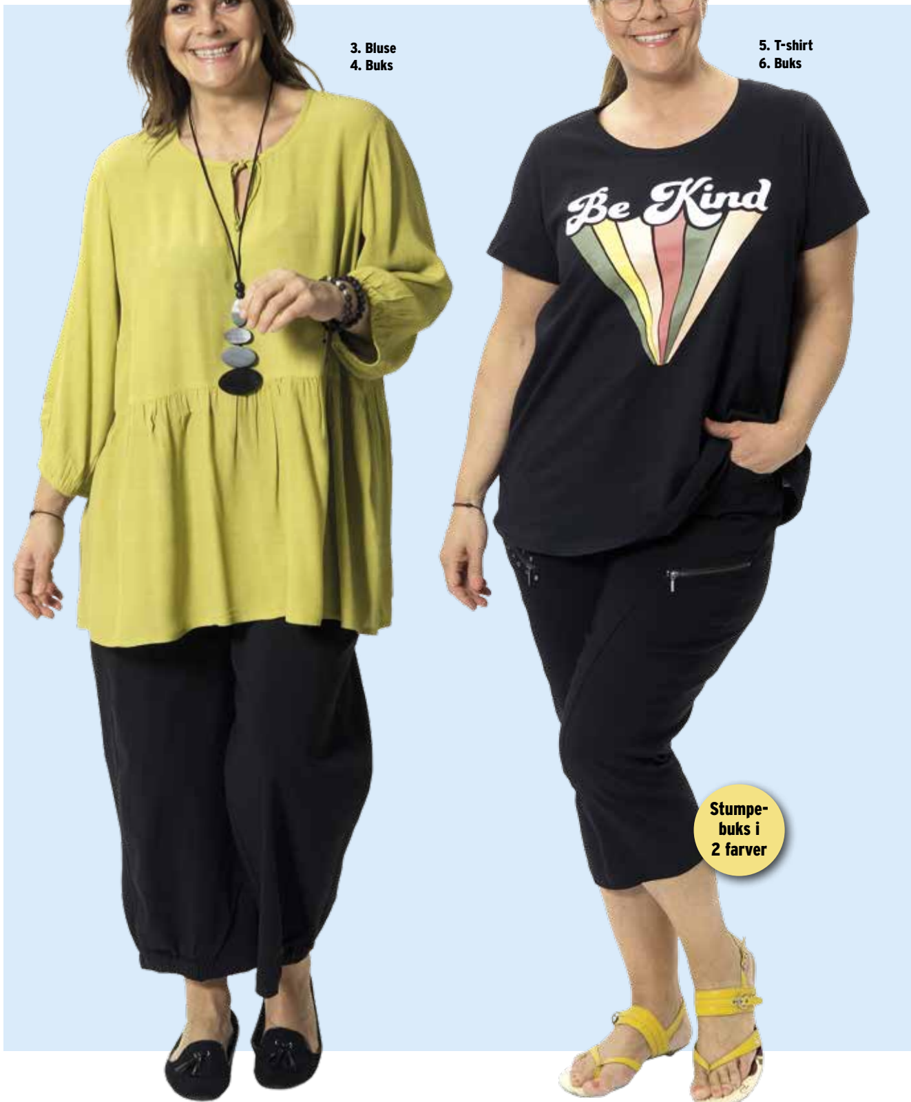
3. Bluse 4. Buks