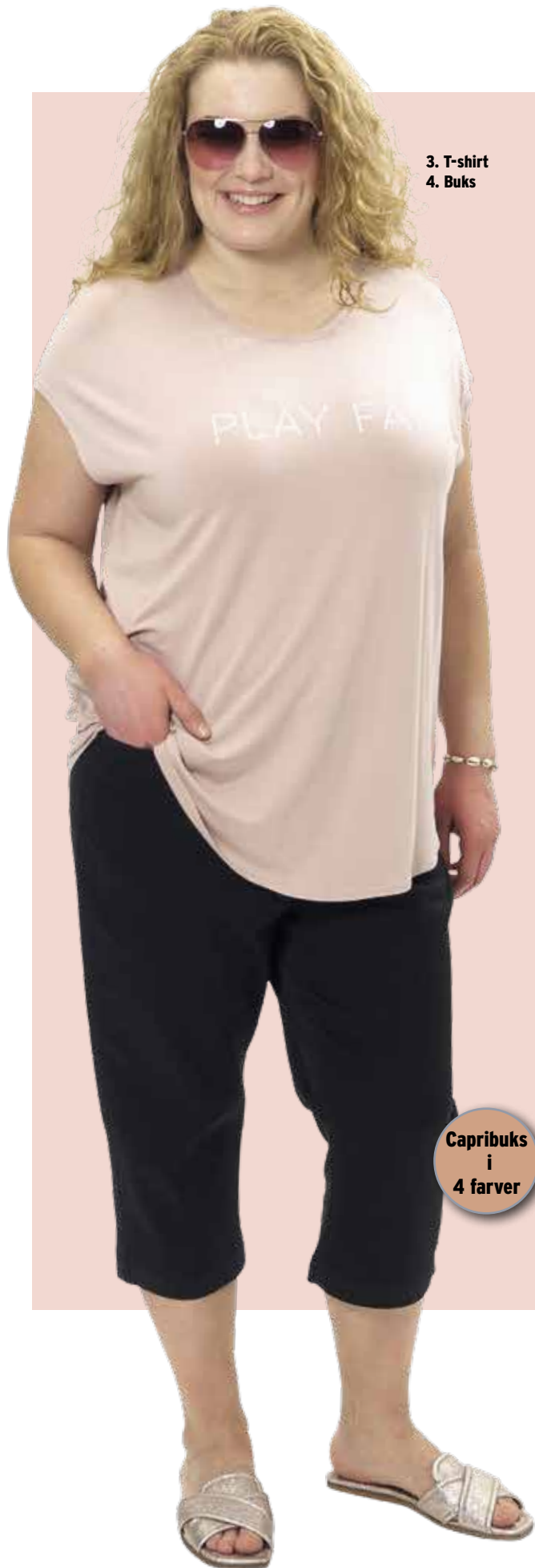
3. T-shirt 4. Buks