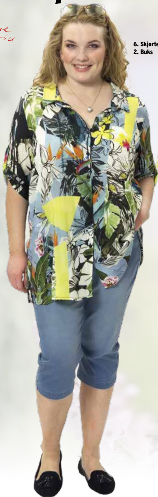
6. Skjorte 2. Buks