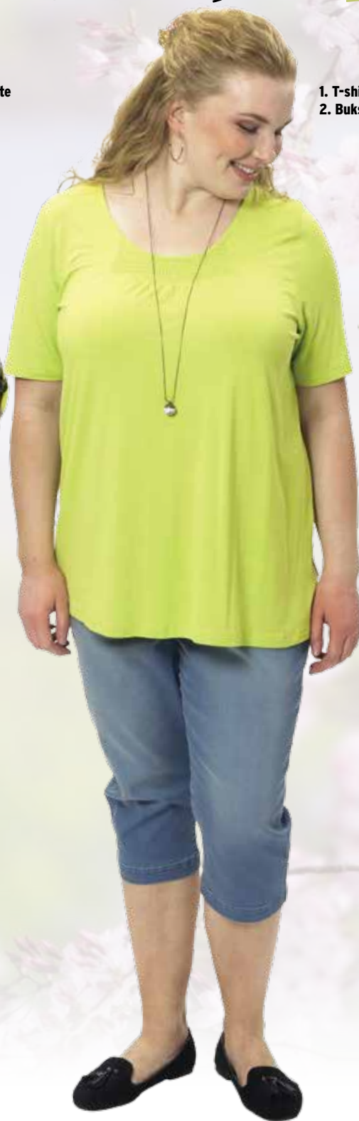
1. T-shirt 2. Buks