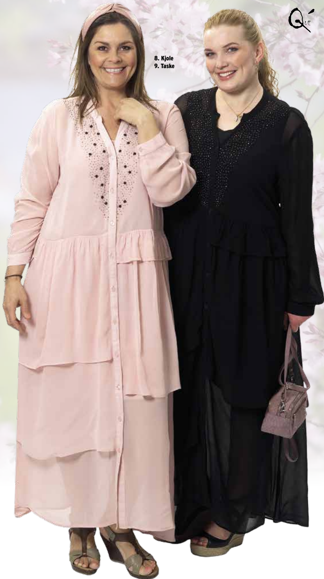
8. Kjole 9. Taske