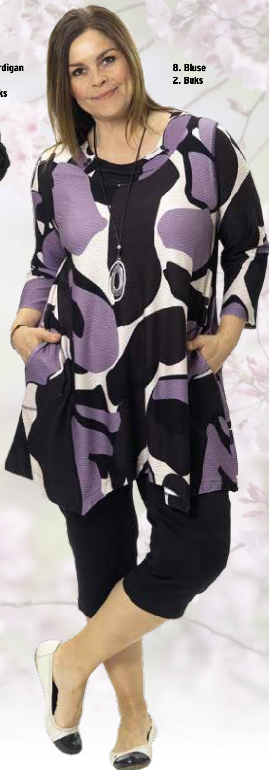
8. Bluse 2. Buks