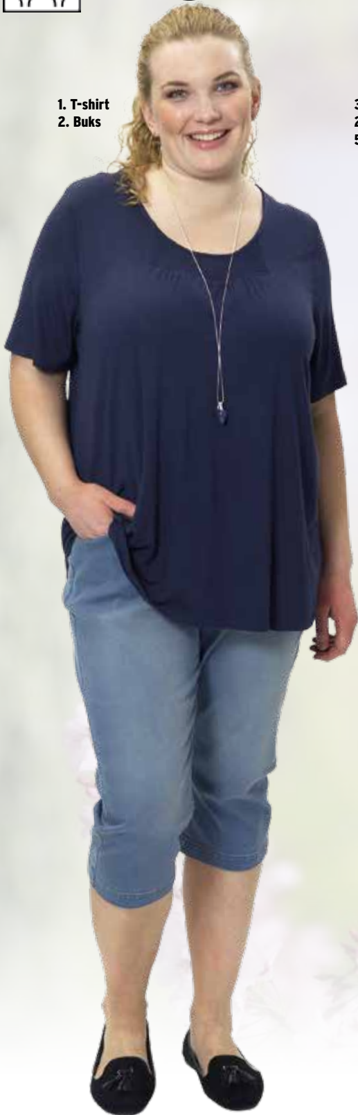
1. T-shirt 2. Buks