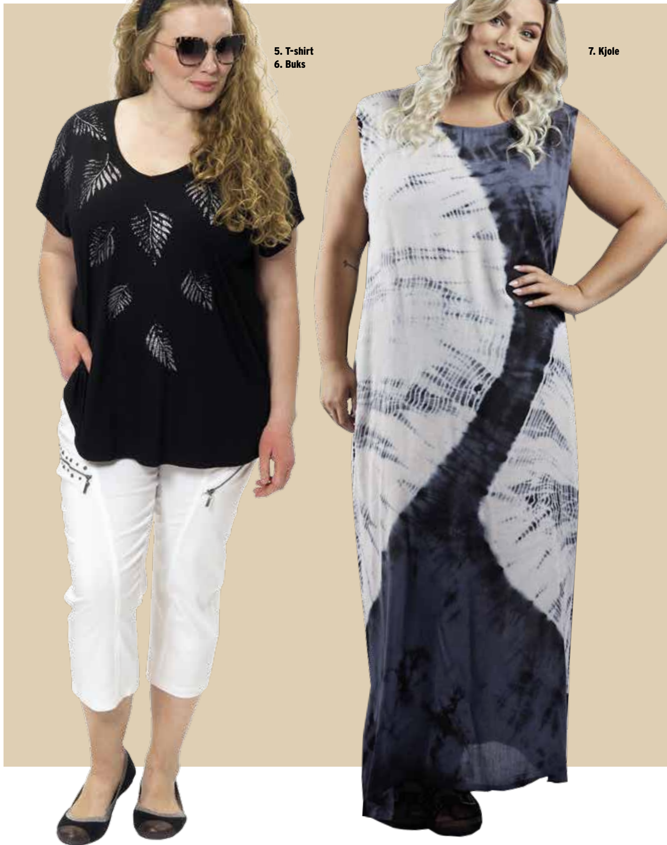
5. T-shirt 6. Buks