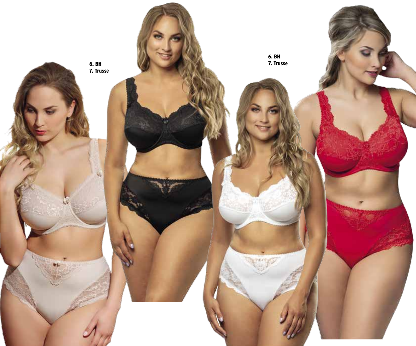
6. BH 7. Trusse