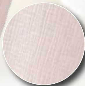
Udsnit af Kjole/tunika