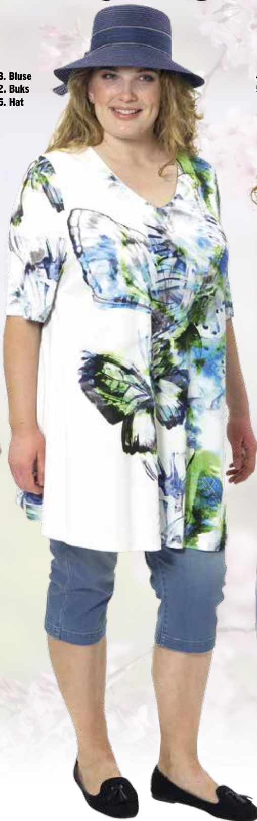
3. Bluse 2. Buks 5. Hat