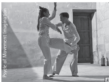
Psyche of Movement Imagination

Produkcija se ostvaruje potporom Új Előadóművészeti Alapítvány (New Performing Arts Foundation).