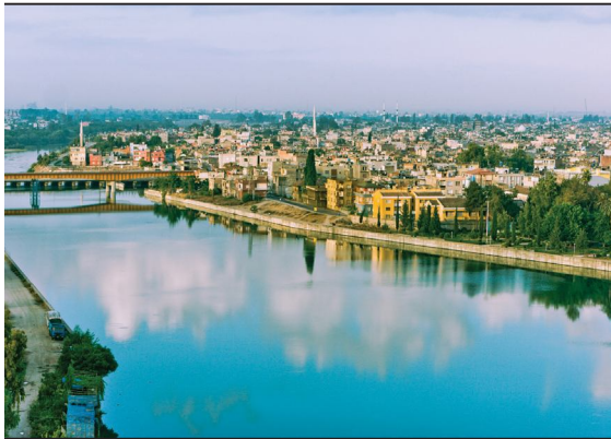
Տեսարան Ադանա քաղաքից

Առավել խտաբնակ են երկրի եվրոպական մասը և ծովափնյա շրջանները (180 մարդ/կմ 2 ): Նոսր են բնակեցված Անատոլիական սարահարթի կենտրոնական և արևելյան մասերը: