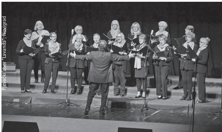
Pjevački zbor "Lavanda" – Novigrad

Kako je rekao Matko Brajša-Rašan u napjevi- ma narodnih pjesama prikazuje se cijela povijest naroda te se u njima vidi cijelo biće naroda. I sada ajte, drage moje pjesme, u poznate i nepoznate slavenske i druge krajeve, upoznajte svijet sa hrvatskim narodom preemile nam Istre te posvjedo- čite same, koliko ste lijepe i mile, vesele i tužne, odvažne i krotke te nježne i pobožne!