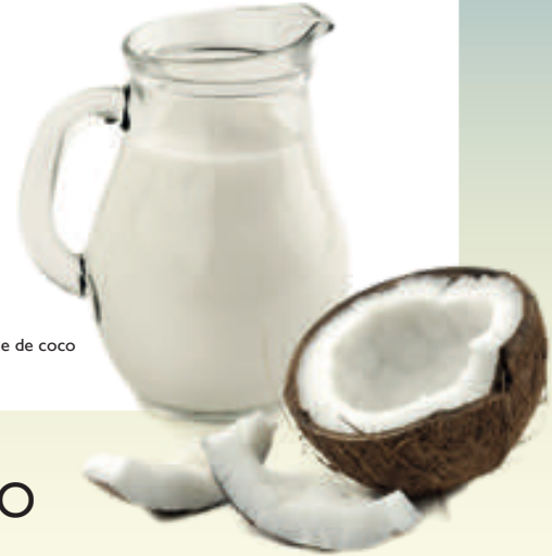
Leche de coco

Rallar el coco es una tarea difícil. En las comunidades se realiza con un rayador artesanal, una cuchilla dentada fijada a un banco, o con una cuchara afilada.