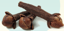
Clavos de olor

Se le puede agregar banano maduro, piña u hojas de naranja al coco una vez hierva, esto con el fin de darle sabores diferentes.