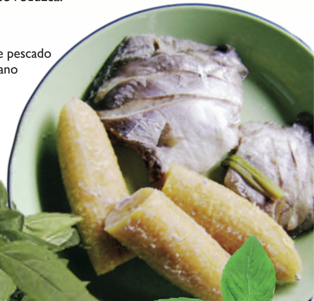
Hierba de azotea