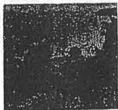
Kombajni žanju od ranog jutra do kasne večeri

manje nego prošle godine, kada je zasijano 158.000 hektara, očekuje se da će ovogodišnji prinosi biti znatno onima iz 1957. godine, kada je prinost pšenice bio rekordan i iznosio 290.000 tona pšenice.