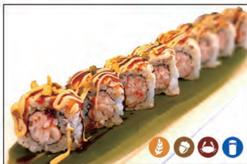
70/ CHEESE ROLL €10.00 con surimi* e gambero* cotto, guarnito con cheese e pistacchio