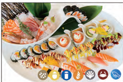
82/ SUSHI PIATTI MAX 48PZ €49.00 12 sashimi, 8 ura, 6 hoso, 12 nigiri, 6 futo, 4 gio