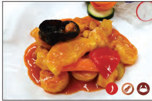
151/ GAMBERI TAILANDESE €7.00 gamberi* saltati con verdure in salsa thailandese