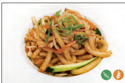
126/ UDON CON VERDURE €5.00 con verdure