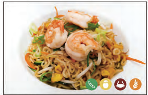
130/ RAMEN CON GAMBERI €6.00 con gamberi* verdure e uova