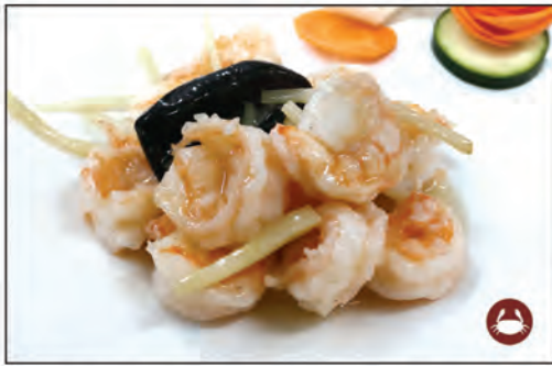
150/ GAMBERI FUNGHI E BAMBU €7.00 gamberi* saltati con funghi e bambu