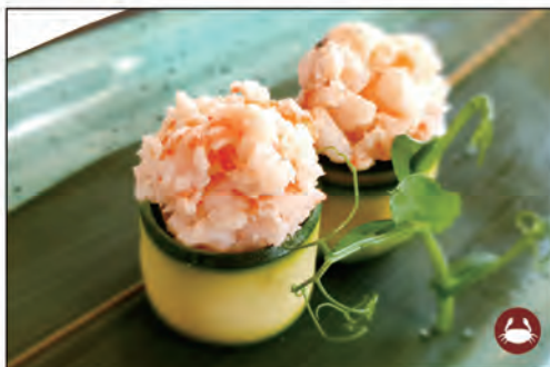
96/ GIO ZUCCHINE €5.00 bocconcini di riso avvolti con zucchine, sopra con gambero* cotto e salsa allo zafferano