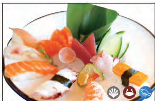
79/ SU-SA MORIAWASE 12PZ €14.00 6 nigiri*, 6 sashimi