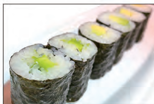
74/ AVOCADO €4.00 con avocado e avvolto con alga nori