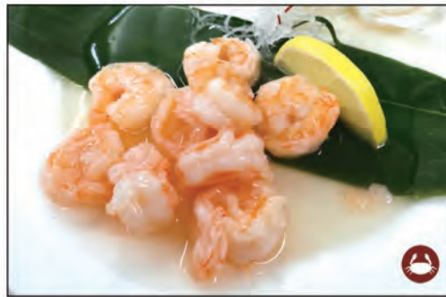
155/ GAMBERI LIMONE €7.00 gamberi* saltati in salsa al limone