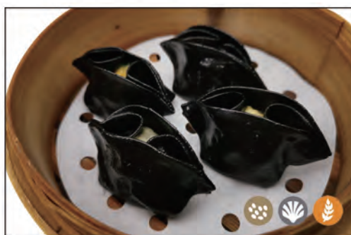
08/ RAVIOLI* DI CALAMARO 4PZ €5.00 ravioli con calamaro al vapore