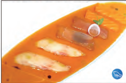
113/ CARPACCIO MISTO €10.00 fettine di pesce misto con salsa speciale