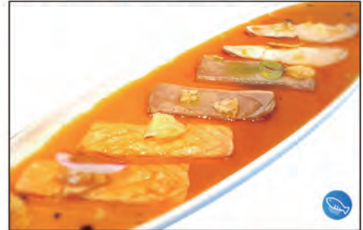
114/ CARPACCIO FLAMBE €12.00 fettine di pesce misto scottato con patatine e flambe