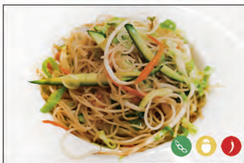
SPAGHETTI DI RISO €5.00 120/ VERDURE 120A/ VERDURE PICCANTE