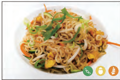
129/ RAMEN CON VERDURE €5.00 con verdure e uova