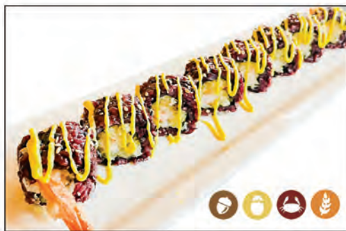
66/ BLACK EBI €10.00 con gambero* fritto e maionese, sopra zafferano e mandorle