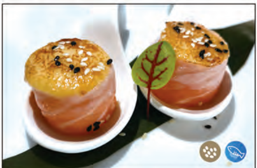
95/ GIO FLAMBE €5.00 bocconcini di riso avvolti con salmone scottato, sopra flambe e sesamo