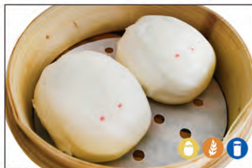
10/ PANE* DOLCE 2PZ €3.00 pane dolce al vapore