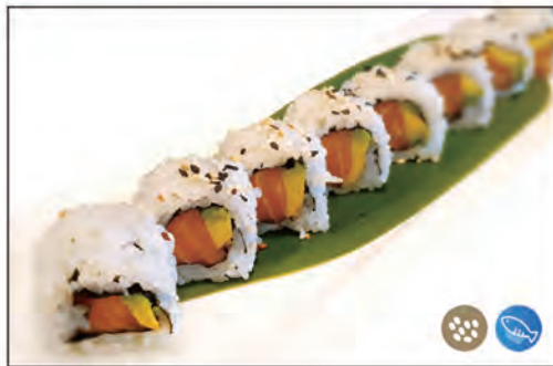
57/ SAKE €8.00 con avocado e salmone, sopra con sesamo