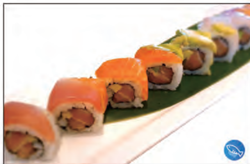
61/ RAINBOW €10.00 con salmone e avocado, guarnito con sashimi misto