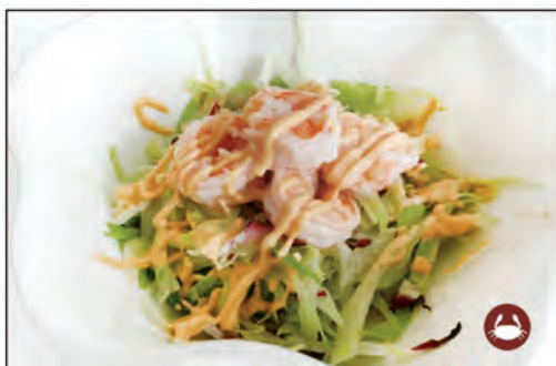
15/ INSALATA GAMBERO €6.00 insalata, radicchio, gambero* cotto, salsa cocktail