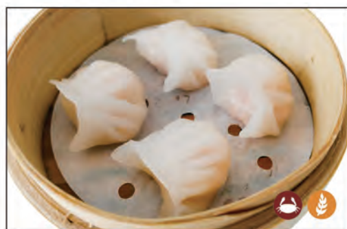
07/ RAVIOLI* GAMBERI 4PZ €5.00 ravioli con gamberi e verdure al vapore