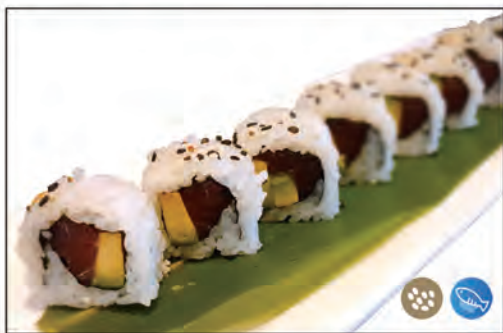
65/ MAGURO €9.00 con tonno crudo e avocado, sopra con sesamo