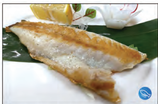
170/ BRANZINO GRIGLIA €7.00 pesce branzino alla griglia con salsa