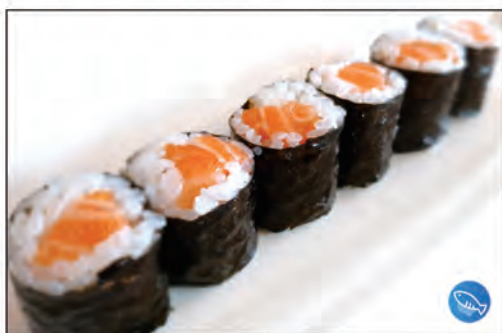
71/ SAKE €5.00 con salmone e avvolto con alga nori