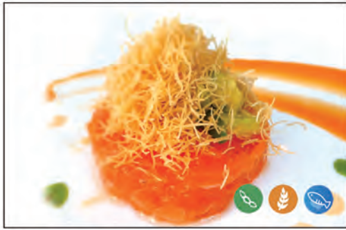
99/ TARTARE SALMONE €8.00 tartare salmone, sopra con avocado, kataifi e salsa speciale