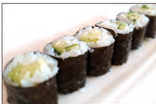
75/ HOSO KAPPA €4.00 con cetrioli e avvolto con alga nori