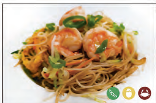
121/ SPAGHETTI DI RISO €6.00 con gamberi* e verdure