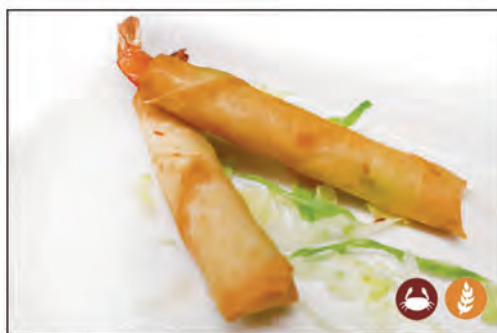
02/ INVOLTINI GAMBERI 2PZ €4.00 con gamberi*, carne di maiale e verdure