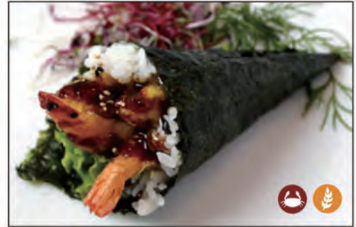
86/ TEMAKI EBITEN €5.00 con tempura di gambero* e insalata