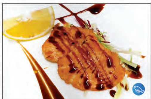
168/ SALMONE GRIGLIA €8.00 fetta di salmone alla griglia con salsa