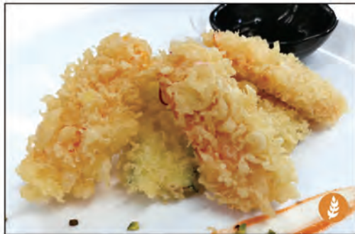
25/ TEMPURA VERDURE €6.00 verdure miste fritte