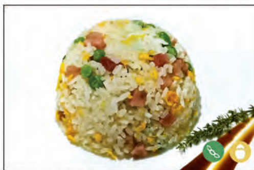
136/ RISO CANTONESE €5.00 riso saltato con piselli, prosciutto e uova