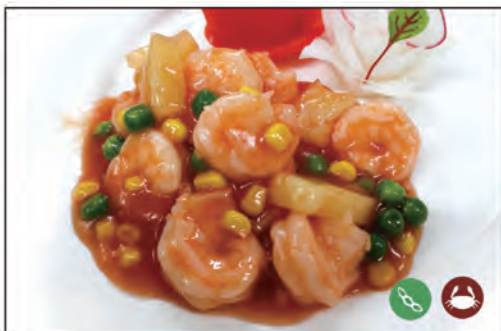
156/ GAMBERI AGRODOLCE €7.00 gamberi*, mais e piselli in salsa agrodolce