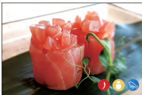
92/ GIO MAGURO SPICY €5.00 avvolto con tonno, sopra e tartare di tonno con uova di pesce volante, maionese e tabasco