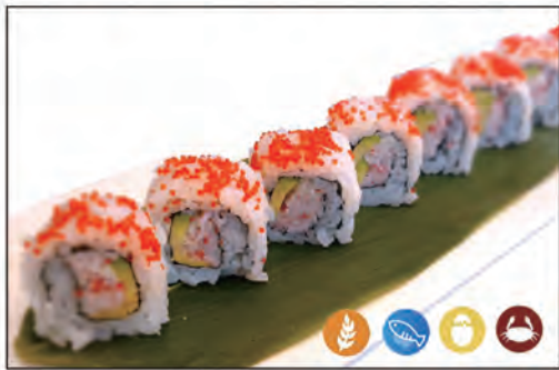
63/ CARIFORNIA €8.00 con surimi di granchio*, maionese e avocado, sopra con uova di pesce volante