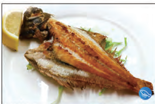
171/ LIMANDA ALLA GRIGLIA €7.00 limanda alla griglia con salsa