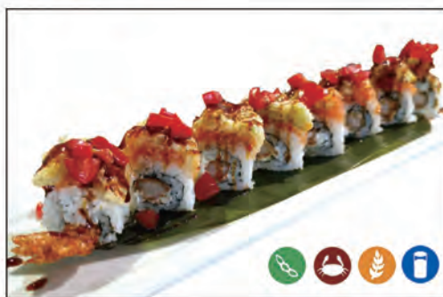
48/ EBI FLOWER €10.00 gambero* fritto e philadelphia esterno tartare fiore di zucca e ciliegino con salsa teriyaki