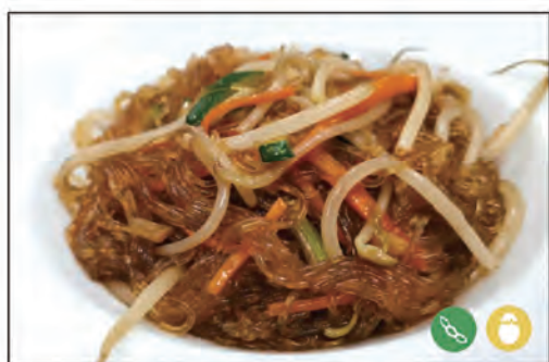
123/ SPAGHETTI DI SOIA €6.00 con verdure