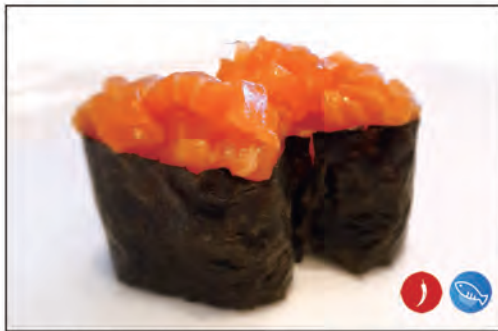
87/ GUNKAN SPICY SAKE €5.00 bocconcini di riso avvolto da salmone, sopra con tartare di salmone e piccante