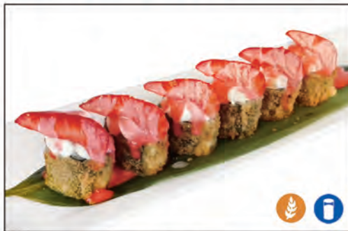
43/ HOSO FRITTO CON FURTTA €8.00 roll fritto con avocado, esterno philadelphia e frutta di stagione