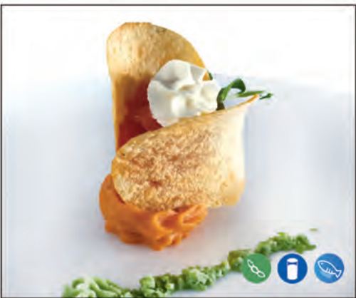
103/ TARTARE CHIPS €9.00 tartare di salmone, philadelphia, patatine, patate dolce