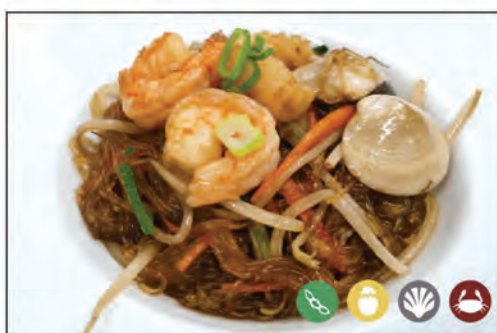
122/ SPAGHETTI DI SOIA €6.00 con frutti di mare* e verdure