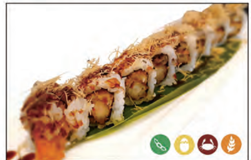
60/ EBI TEN €9.00 con tempura di gambero* e maionese, guarnito con kataifi e teriyaki