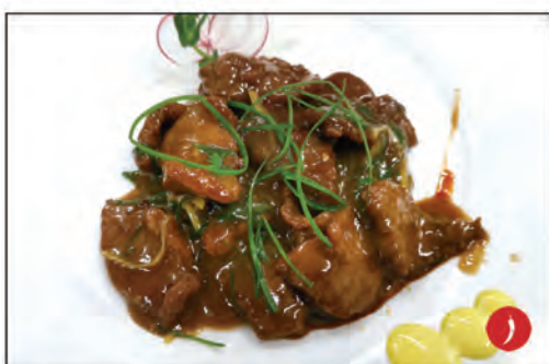
160/ MANZO SICHUAN €7.00 manzo* saltato con zenzero, cipollone e pepe di sichuan