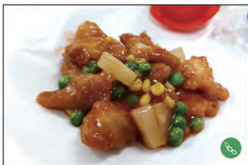
146/ POLLO AGRODOLCE €6.00 pollo* in salsa agrodolce e verdure