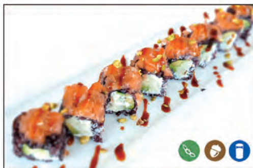
54/ BLACK PHILA €10.00 zucchini fritte avocado e philadelphia esterno tartare salmone teriyaki e pistacchio