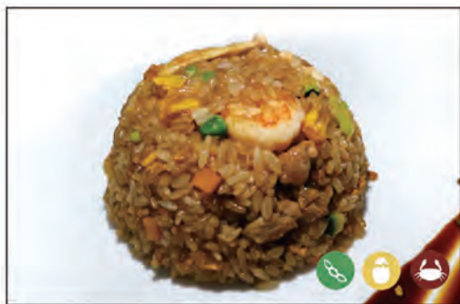
141/ RISO CHAO LAN FAN €6.00 riso saltato con manzo*, pollo*, gamberi*, verdure, uova, mais