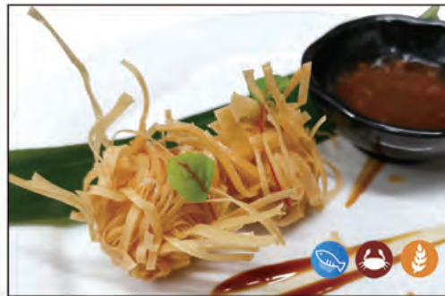
19/ POLPETTE DI MARE 3PZ €6.00 pesce pangasio*, surimi di granchio*, gamberi*