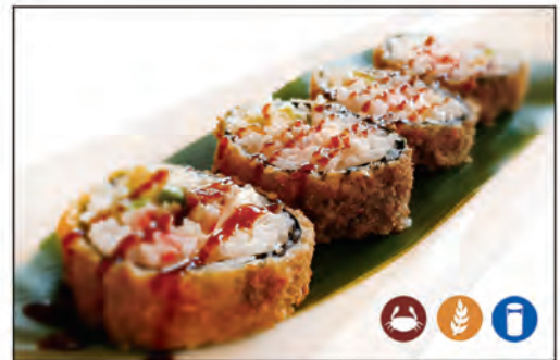
44/ FUTO FRITTO €8.00 roll fritto con surimi*, avocado e philadelphia, avvolto con alga nori