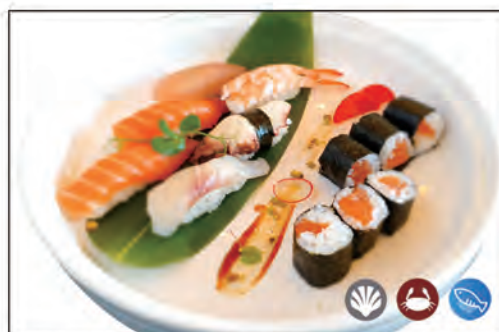
78/ SUSHI MORIAWASE 12PZ €13.00 6 nigiri*, 6 hoso