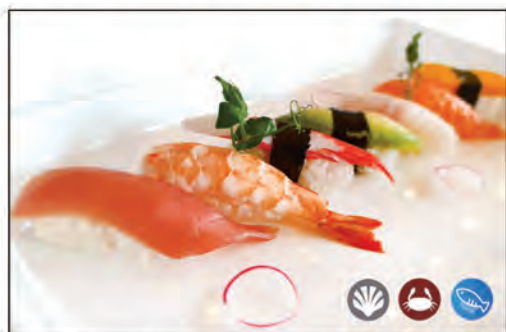
77/ NIGIRI MISTO 6PZ €8.00 pesce* misto