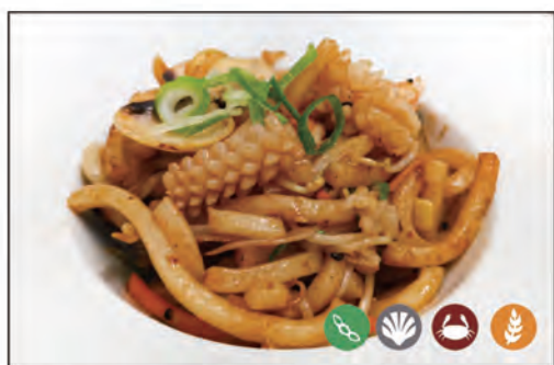
125/ UDON FRUTTI DI MARE €6.00 con frutti di mare* e verdure