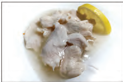
144/ POLLO LIMONE €6.00 pollo* saltato con salsa limone