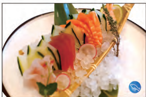
108/ SASHIMI MISTO 12PZ €15.00 3 salmone, 3 tonno, 3 gamberi, 3 branzino