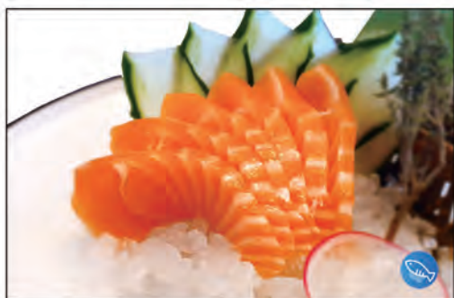
106/ SASHIMI SAKE 6PZ €8.00 fette di salmone