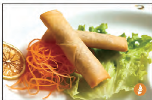
03/ INVOLTINI POLLO 2PZ €4.00 pollo, spaghetti di soia, cavolo, carote