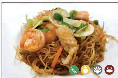
119/ SPAGHETTI DI RISO €6.00 con frutti di mare* e verdure