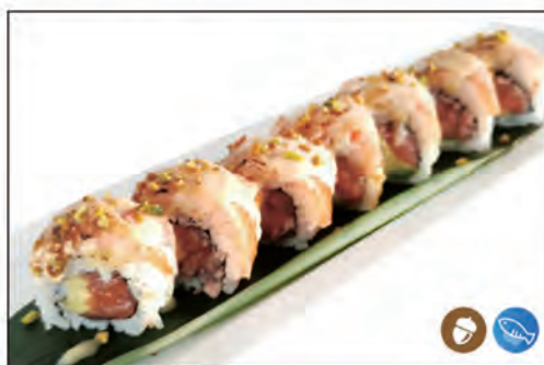
52/ SAKE PLUS €10.00 tartare salmone e avocado esterno salmone scottato pistacchi e salsa flambe