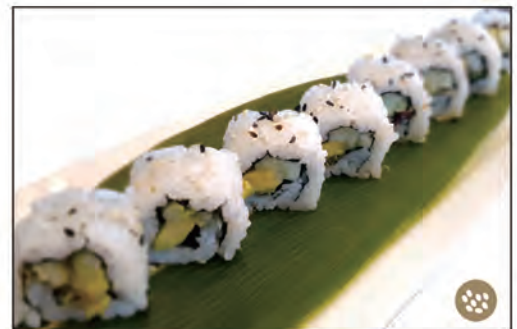
62/ VEGETALIANO €8.00 con cetrioli, insalata, avocado e sesamo