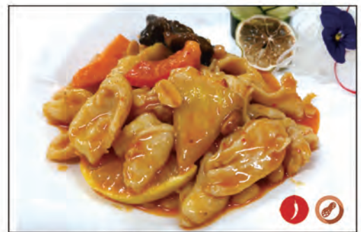
145/ POLLO TAILANDESE €6.00 pollo* saltato con verdure e salsa thailandese