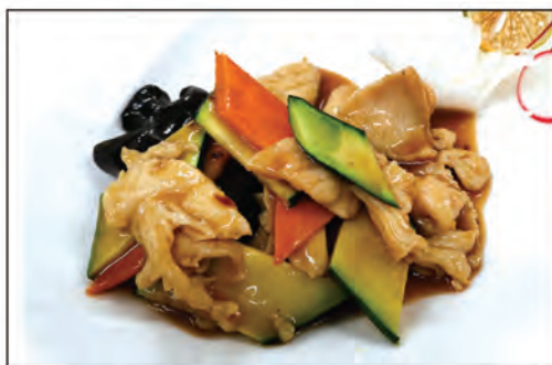
148/ POLLO CON VERDURE €6.00 pollo* saltato con verdure