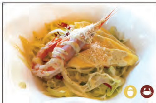
16/ INSALATA TAILANDESE €6.00 insalata, radicchio, mango, gambero* crudo, maionese