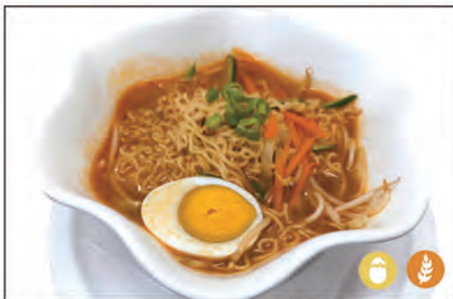
27/ RAMEN IN BRODO €6.00 remen bollito con brodo, verdura e uova