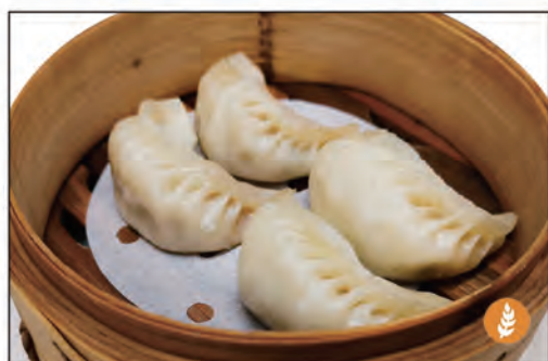
RAVIOLI* DI CARNE 4PZ €4.00 05/ AL VAPORE 05A/ ALLA GRIGLIA