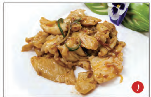
147/ POLLO SICHUAN €6.00 pollo* saltato con zenzero e cipollone e pepe sichuan