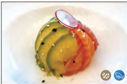
115/ CHIRASHI SAKE €12.00 sotto riso, sopra sashimi di salmone, avocado, sesamo e salsa flambe