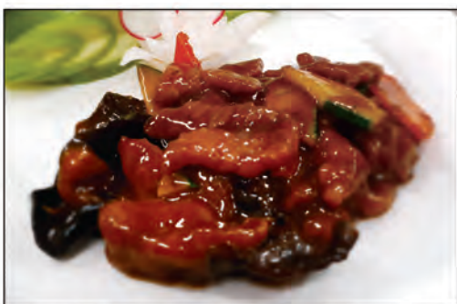
162/ MANZO CON VERDURE €6.00 manzo* saltato con verdure miste