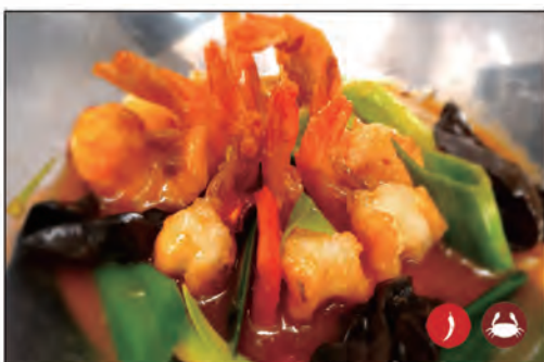
164/ FAI DA TE CON GAMBERI €8.00 gamberi* e verdure