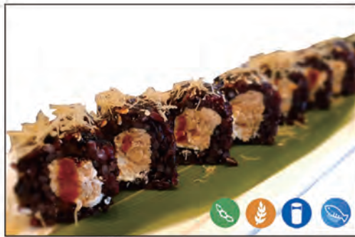
64/ BLACK MIURA €10.00 con salmone cotto e philadelphia, sopra kataifi e teriyaki