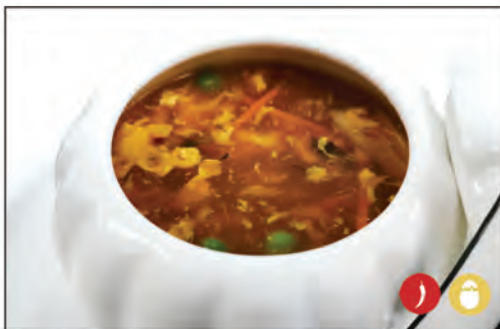
29/ ZUPPA AGROPICCANTE €4.00 verdure miste, uova, amido di patate, salsa piccante