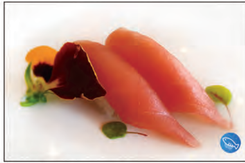
32/ NIGIRI MAGURO