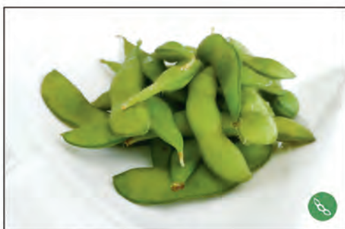
11/ FAGIOLINI* DI SOIA €5.00