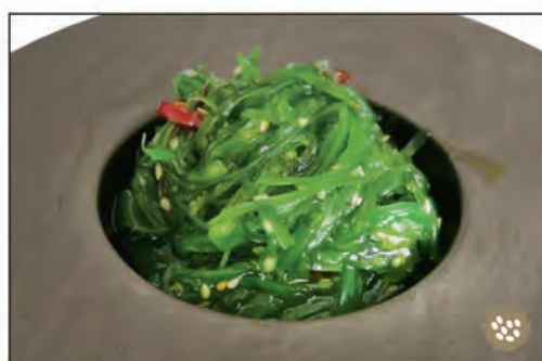
12/ WAKAME* €5.00 insalata di alghe