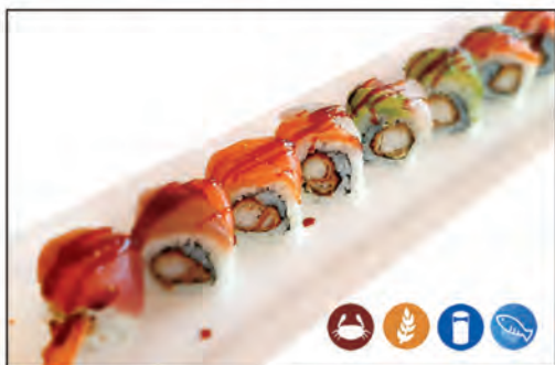
69/ TIGER ROLL €10.00 con gamberi* fritti e philadelphia, guarnito con sashimi misto e salsa flambe