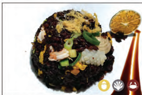
140/ RISO VENERO PESCE €7.00 riso venero saltato con frutti di mare*, verdure e filo di maiale