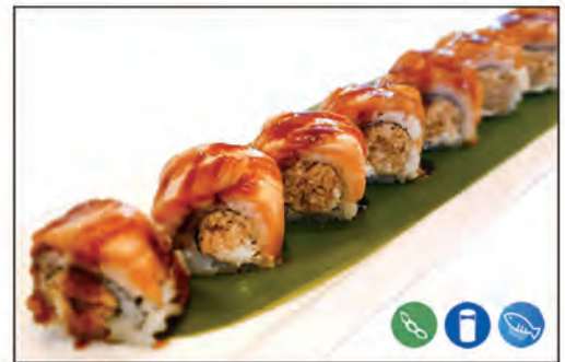
58/ SAKE COTTO €10.00 con salmone cotto e philadelphia, sopra con salmone scottato e teriyaki