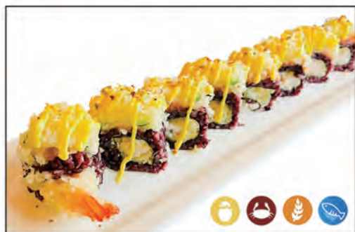
53/ BLACK EBI PLUS €10.00 con gambero* fritto e maionese, sopra tartare di salmone e fiore di zucca e zafferano