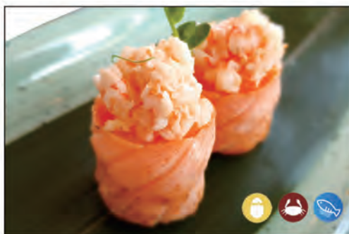
94/ GIO EBI €5.00 bocconcini di riso avvolto con salmone scottato, sopra con gambero* cotto e maionese