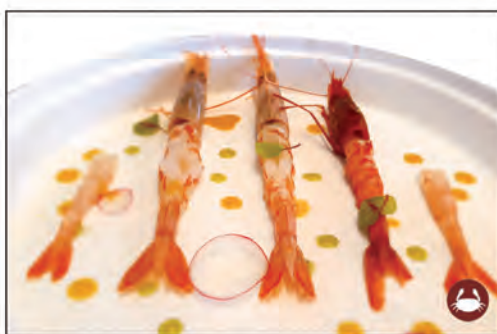
109/ SASHIMI EBI 5PZ €10.00 1 gambero* rosso, 2 gamberone* e 2 amaebi*