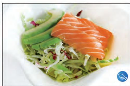
14/ SAKE INSALATA €5.00 insalata, radicchio, salmone, avocado