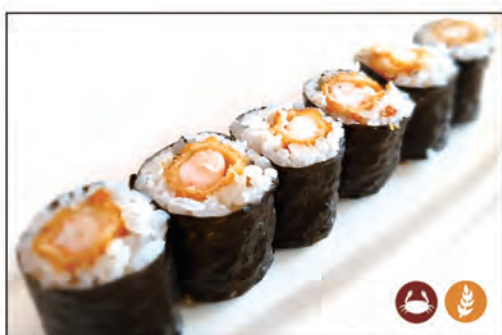
73/ EBITEN €6.00 con tempura di gamberi* e avvolto con alga nori