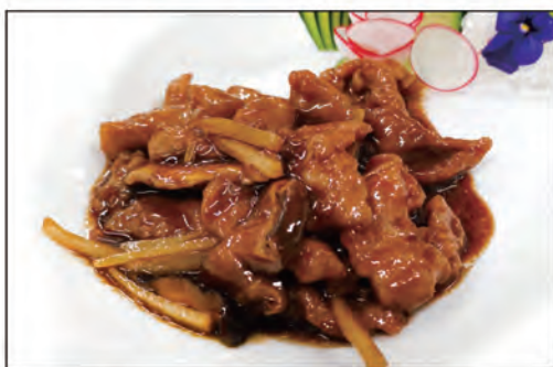
158/ MANZO FUNGHI BAMBU €6.00 manzo* saltato con funghi e bambu