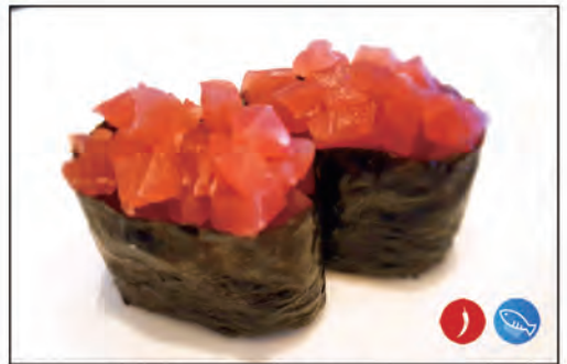
88/ GUNKAN SPICY TUNA €5.00 bocconcini di riso avvolto da tonno, sopra con tartare di tonno e piccante