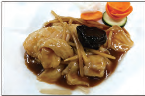
142/ POLLO FUNGHI BAMBU €6.00 pollo* saltato con funghi e bambu