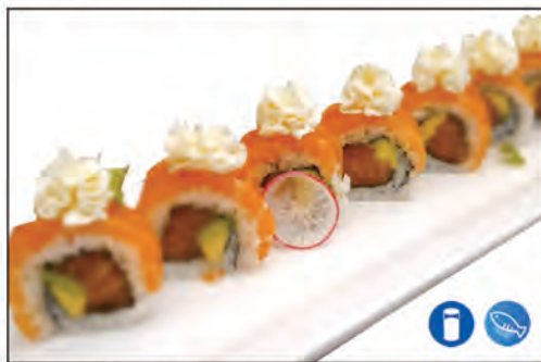
68/ SAKE PHI €9.00 con salmone, avocado, philadelphia e sopra con salmone e philadelphia