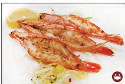
169/ GAMBERONI GRIGLIA €8.00 gamberoni* alla griglia con salsa