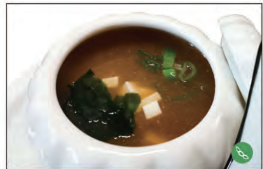
28/ ZUPPA DI MISO €4.00 toufu, cipollina, alghe giapponese