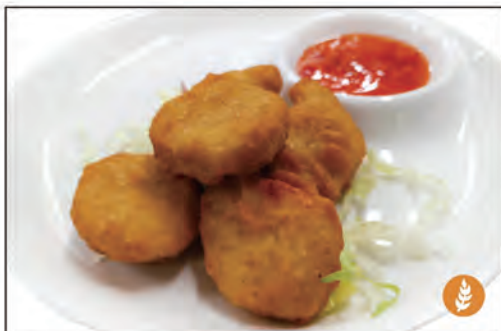
22/ CHICKEN NUGGETS* €5.00