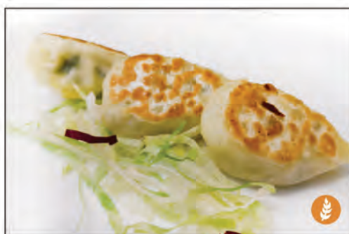
RAVIOLI* DI VERDURE 4PZ €4.00 06/ AL VAPORE 06A/ ALLA GRIGLIA