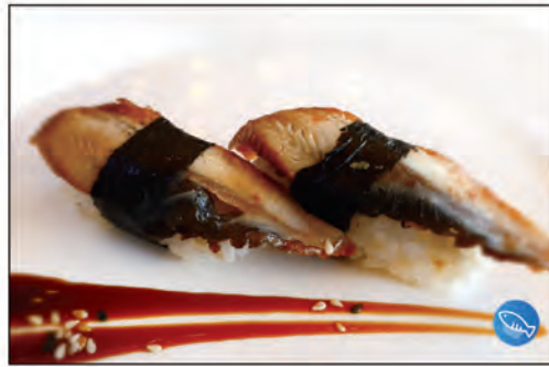
36/ NIGIRI UNAGI