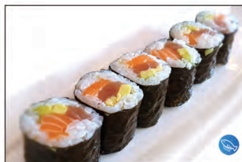
76/ HOSO MAX €6.00 con avocado, salmone e tonno