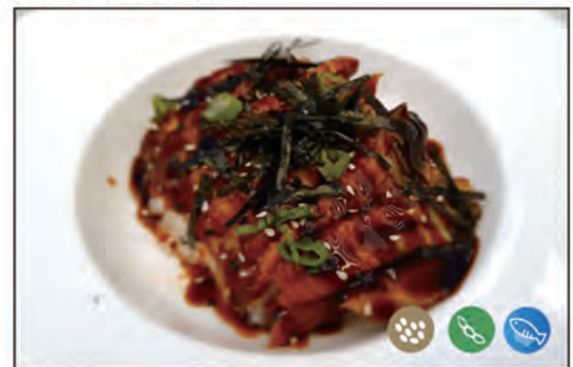
118/ CHIRASHI UNAGI €14.00 sotto riso, sopra sashimi di anguilla, avocado, sesamo e salsa teriyaki