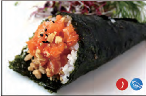
85/ TEMAKI SPICY €4.00 con salmone e salsa piccante