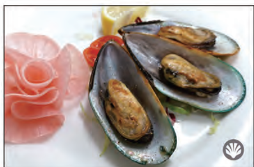
172/ COZZE VERDE GRIGLIA €7.00 cozze verde alla griglia