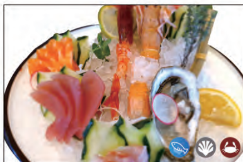
110/ SASHIMI SPECIALE €24.00 12 sashimi misti, 1 gambero* rosso, 1 scampo*, 1 ostrica