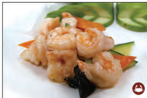
157/ GAMBERI VERDURE €7.00 gamberi* saltati con verdure miste