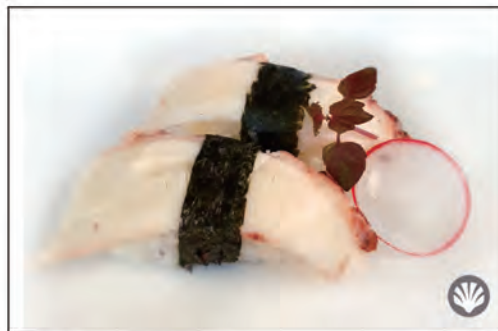
38/ NIGIRI POLIPO