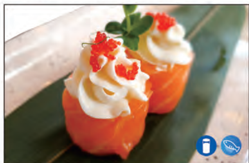
93/ GIO PHILADELPHIA €5.00 bocconcini di riso avvolto da salmone, sopra con uova di pesce salmone e philadelphia