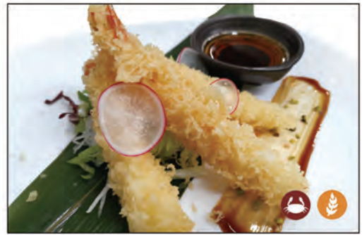
24/ TEMPURA GAMBERI 3PZ €8.00 gamberi* fritti