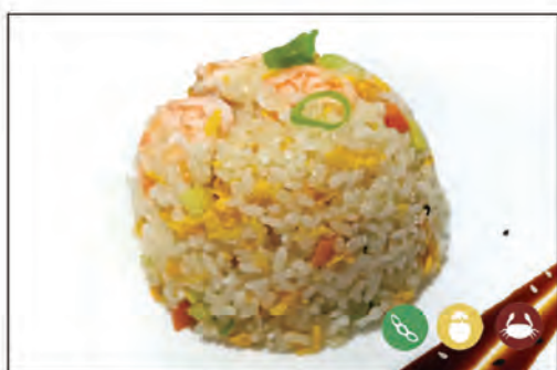
137/ RISO GAMBERI €6.00 riso saltato con gamberi*, uova e verdure