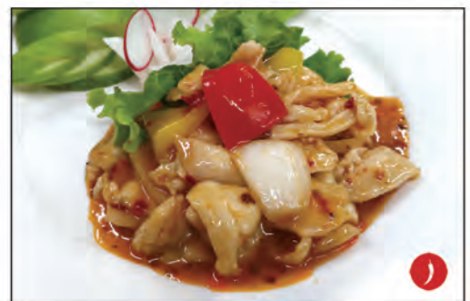
149/ POLLO PICCANTE €6.00 pollo* saltato con verdure e salsa piccante