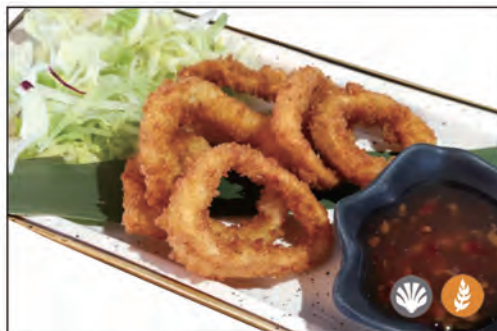
23/ CALAMARI FRITTI €6.00 anelli di calamari* fritti