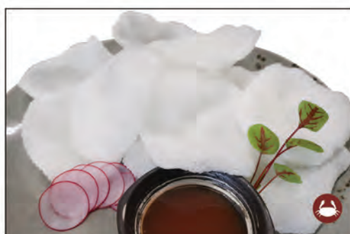
04/ NUVOLE DI GAMBERI €3.00