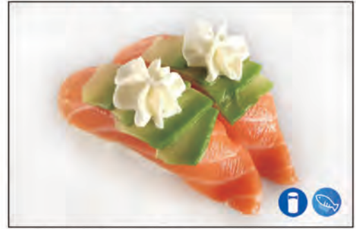
42/ NIGIRI SAKE SPECIALE €3.00 bocconcino di riso con salmone, avocado e philadelphia