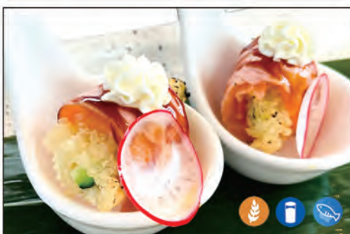
98/ GIO FLOWER €5.00 bocconcini con tempura di fiori di zucca, esterno salmone scottato e philadelphia