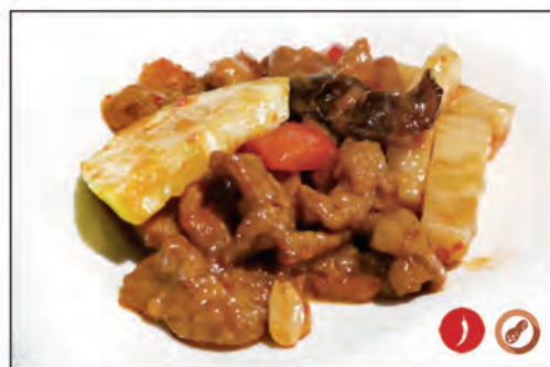
159/ MANZO TAILANDESE €7.00 manzo* saltato con salsa thailandese