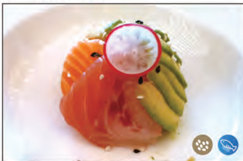
117/ CHIRASHI MISTO €14.00 sotto riso, sopra sashimi di pesce misto, sesamo e salsa flambe