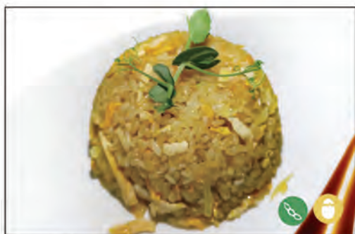
139/ RISO AL CURRY €6.00 pollo*, cipolla, uova