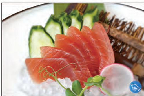
107/ SASHIMI TONNO 6PZ €10.00 fette di tonno