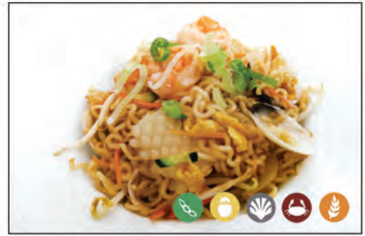
128/ RAMEN CON PESCE €6.00 con frutti di mare* e uova