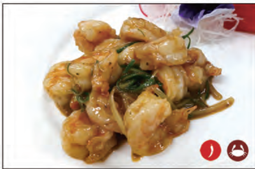
152/ GAMBERI SICHUAN €7.00 gamberi* saltato con zenzero e cipollone e pepe sichuan