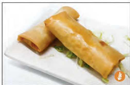
01/ INVOLTINI PRIMAVERA 2PZ €3.00 croccanti involtini di pasta con un gustoso ripieno verdure