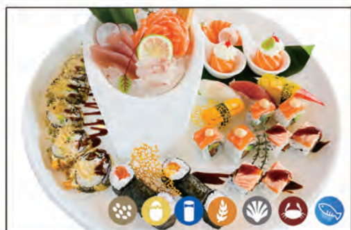
81/ SUSHI PIATTI MEDIA 39PZ €37.00 9 sashimi, 8 ura, 6 hoso, 8 nigiri, 6 futo, 2 gio