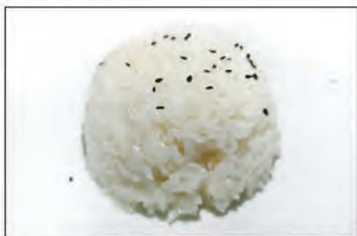
135/ RISO BIANCO BOLLITO €2.50 riso bianco cotto