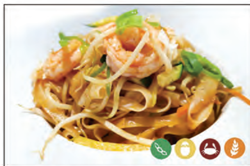
133/ SPAGHETTI TAILANDESE €6.00 con verdure e gamberi*