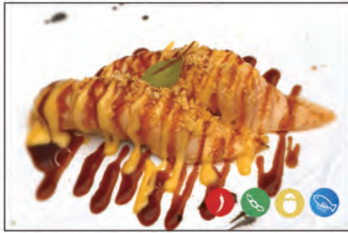
39/ SAKE SCOTTATO €4.00 bocconcino di riso con salmone scottato, maionese spicy e teriyaki