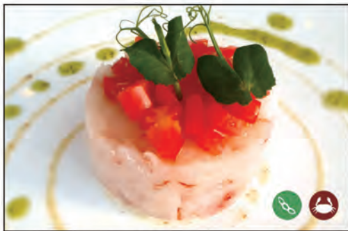
101/ TARTARE AMARBI €10.00 tartare di gambero* crudo, con pomodoro e salsa di frutta