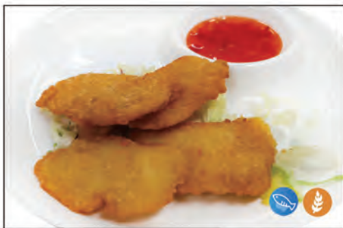
20/ CROCHETTE DI PANGASIO €6.00 pesce pangasio* fritto