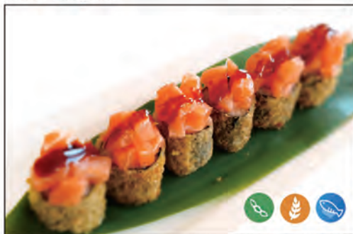
45/ HOSO SAKE FRITTO €7.00 roll fritto con salmone fritto sopra con tartare di salmone e salsa teriyaki