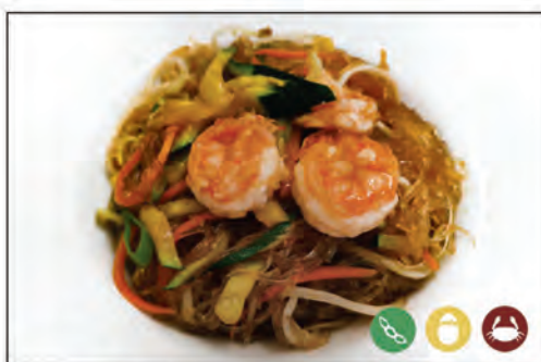
124/ SPAGHETTI DI SOIA €6.00 con gamberi* e verdure