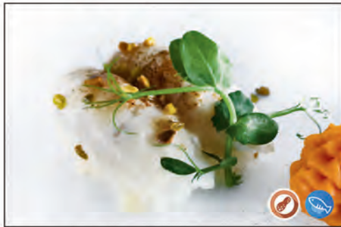
41/ SUZUKI SCOTTATO €4.00 bocconcino di riso con branzino scottato e arachidi