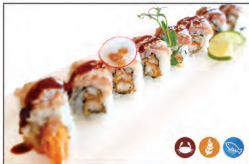
59/ TATAKI ROLL €10.00 con gambero* fritto, guarnito con tonno scottato