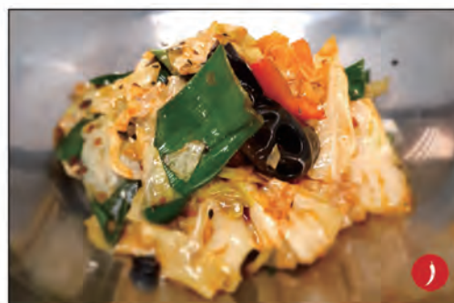
165/ FAI DA TE VERDURE €8.00 verdure miste