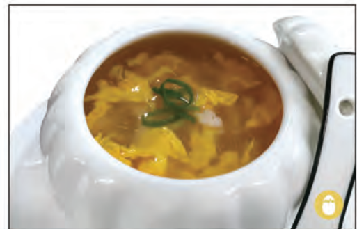
30/ ZUPPA POLLO MAIS €4.00 pollo*, mais, uova, amido di patate