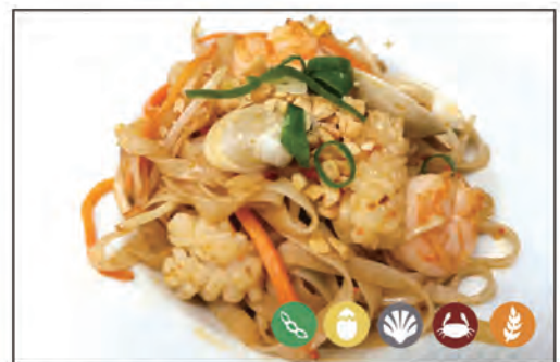
134/ SPAGHETTI TAILANDESE €6.00 con verdure e frutti di mare*