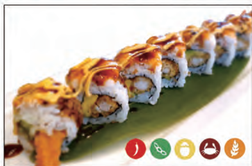
47/ EBI ROLL €10.00 gambero* fritto, avocado e surimi* esterno salsa teriyaki e spicy maio