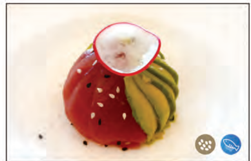
116/ CHIRASHI TUNA €14.00 sotto riso, sopra sashimi di tonno, sesamo e salsa flambe