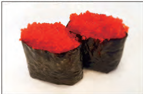
89/ GUNKAN TOBIKO €5.00 bocconcini di riso avvolti con alga nori, guarnito con uova di pesce volante