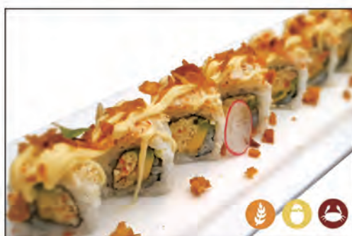
50/ KEY ROLL €10.00 polpa di granchio* e avocado esterno con cipolla frita e maionese