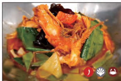
163/ FAI DA TE CON PESCE MISTE €10.00 frutti di mare* e verdure miste