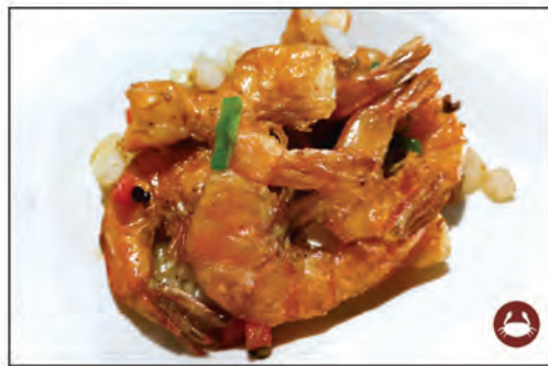
153/ GAMBERI SALE PEPE €8.00 gamberi* saltati con sale e pepe