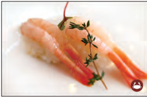
35/ NIGIRI AMAEBI