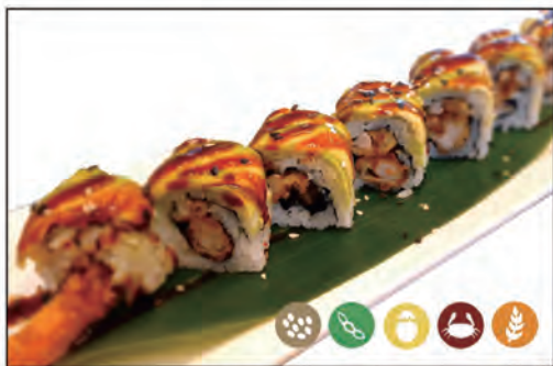
67/ DARAGON ROLL €10.00 con tempura di gambero* e maionese, guarnito con avocado, sesamo e teriyaki