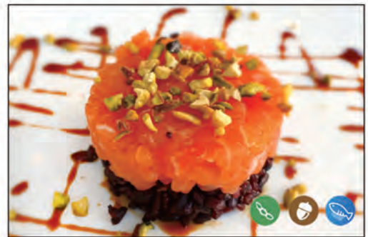
102/ TARTARE TOP €10.00 sotto riso venere e sopra con tartare salmone, pistacchi e salsa teriyaki