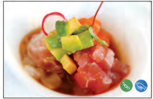
100/ TARTARE MISTO €10.00 tartare pesce misto con avocado e salsa speciale