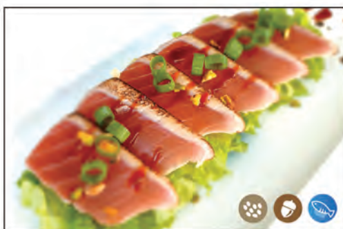
105/ TATAKI TUNA €10.00 con tonno scottato, sopra con cipollotto, pistacchio, sesamo e salsa speciale