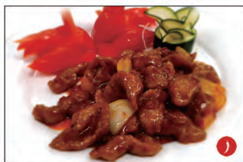
161/ MANZO AL PEPE NERO €7.00 manzo* saltato verdure con pepe nero