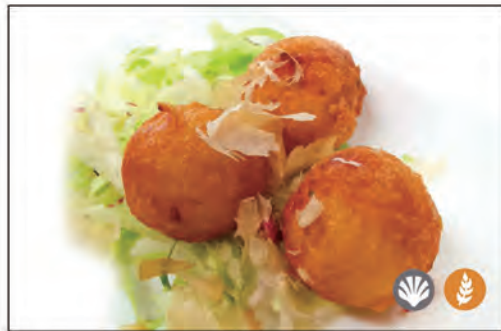
18/ POLPETTE DI POLPO 3PZ €6.00 polpettini al gusto polipo fritto