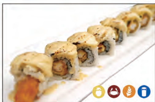
49/ BEN ROLL €10.00 gambero* fritto, maio esterno con formaggio e salsa tartufo