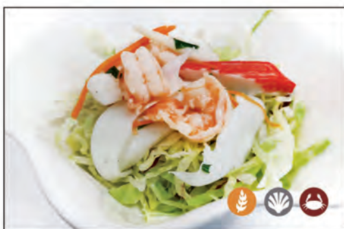
13/ INSALATA DI MARE € 6.00 insalata, radicchio, gambero* cotto, cozze, seppia*, carote, prezzemolo, surimi di granchio*