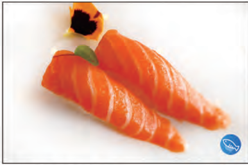
31/ NIGIRI SAKE