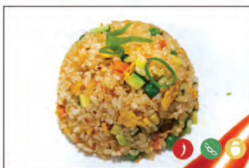
138/ RISO TAILANDESE €6.00 riso saltato con uova e verdure in salsa thailandese