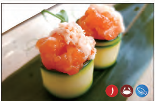
97/ GIO ZUCCHINE SPICY €5.00 bocconcini di riso avvolti con zucchine, sopra con tartare di gambero* cotto e salmone piccante