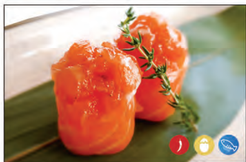
91/ GIO SAKE SPICY €5.00 avvolto con salmone, sopra e tartare di salmone con pesce di volante, maionese e tabasco