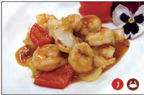
154/ GAMBERI PICCANTI €7.00 gamberi* saltati in salsa piccante