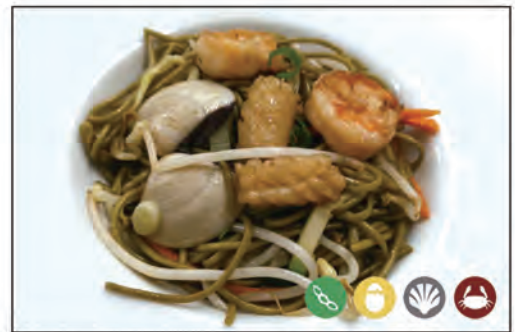
132/ SPAGHETTI DI TÈ VERDE €6.00 con verdure e frutti di mare*