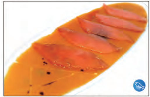
112/ CARPACCIO TONNO €10.00 fettine di tonno con salsa speciale