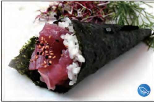
83/ TEMAKI MAGURO €5.00 con tonno e avocado