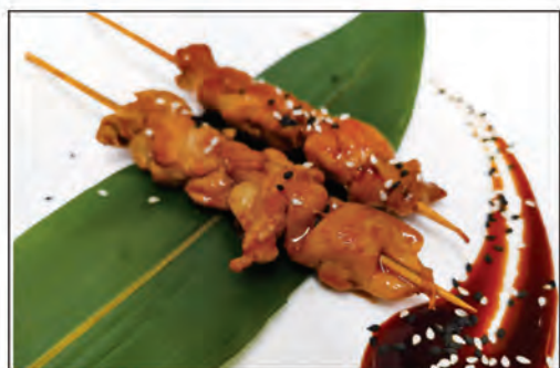
166/ SPIEDINI DI POLLO €6.00 pollo* alla griglia con salsa