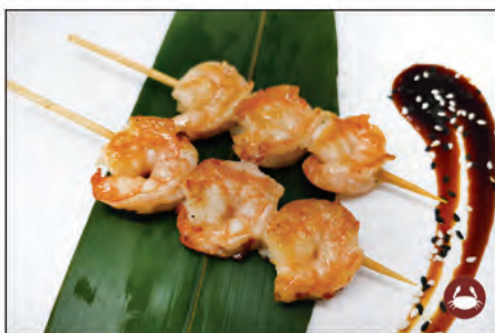
167/ SPIEDINI DI GAMBERI €7.00 gamberi* alla griglia con salsa