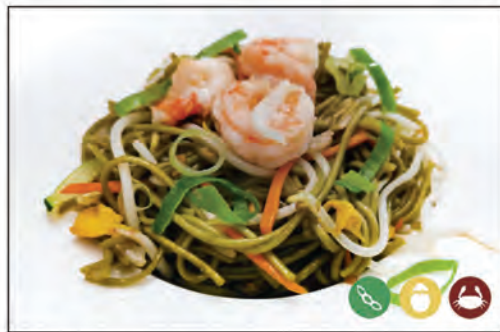
131/ SPAGHETTI DI TÈ VERDE €6.00 con verdure e gamberi*