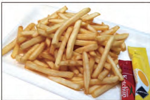
21/ PATATINE FRITTE €5.00 patatine fritte