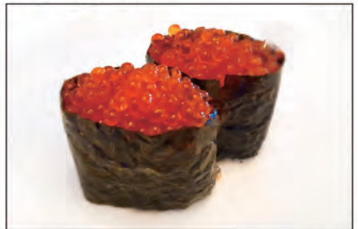
90/ GUNKAN IKURA €5.00 bocconcini di riso avvolti con alga nori, guarnito con uova di pesce salmone