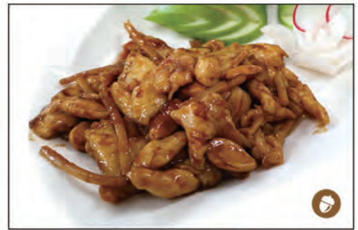
143/ POLLO MANDORLE €6.00 pollo* saltato con mandorle