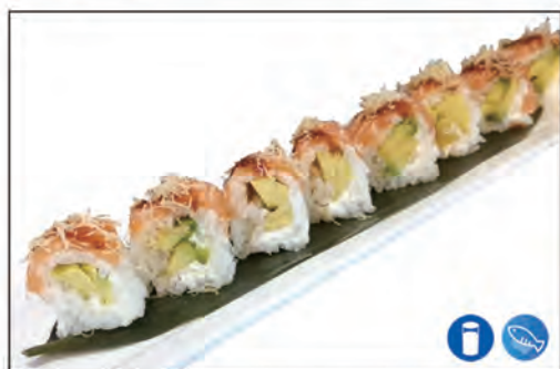
51/ FRESH ROLL €10.00 rotoli di riso con avocado e philadelphia, sopra con salmone