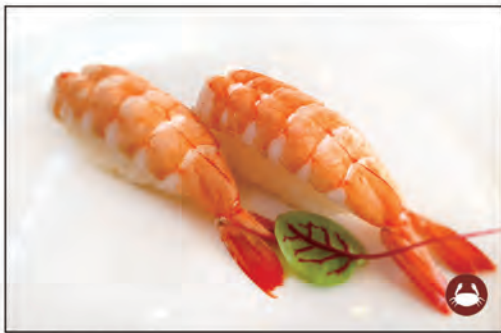
33/ NIGIRI EBI