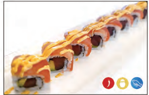
56/ SPICY MAGURO €8.00 con tartare di tonno e avocado, sopra con tartare di tonno e salsa maio spicy