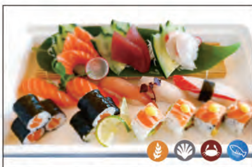
80/ SUSHI PIATTI PICCOLA 22PZ €22.00 6 sashimi, 4 ura, 6 hoso, 6 nigiri*