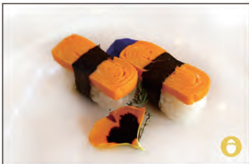
37/ NIGIRI TAMAGO