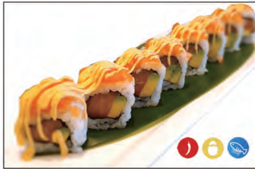
55/ SPICY SAKE €9.00 con tartare di salmone e avocado e sopra con tartare di salmone e salsa maio spicy