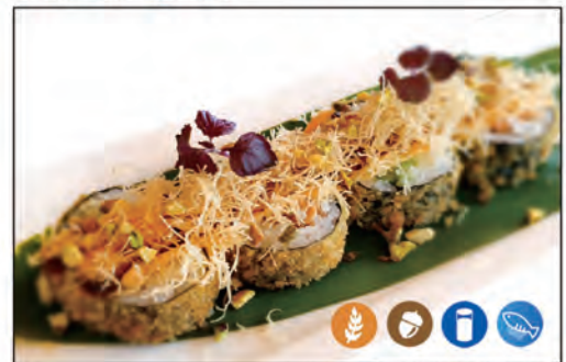
46/ FUTOMAKI SPECIALE FRITTO €10.00 roll fritto con salmone, avocado, philadelphia, sopra pistacchio, kataifi e salsa speciale