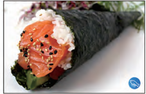
84/ TEMAKI SAKE €4.00 con salmone e avocado