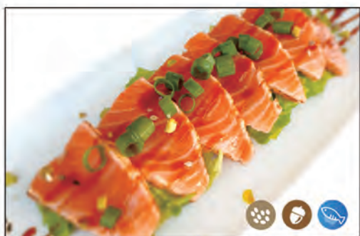
104/ TATAKI SAKE €13.00 con salmone scottato, sopra con cipollotto, pistacchio, sesamo e salsa speciale