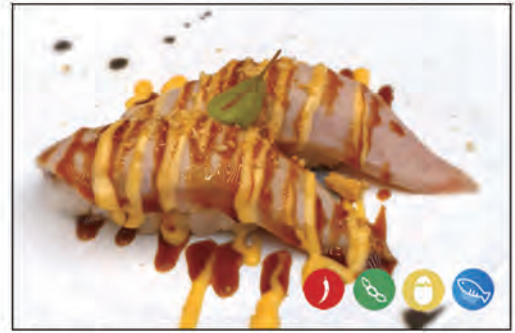
40/ TUNA SCOTTATO €4.00 bocconcino di riso con tonno scottato, maionese spicy e teriyaki