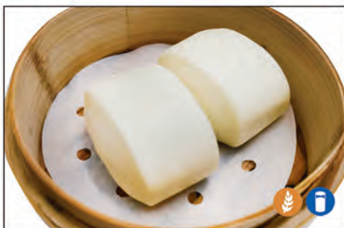
09/ PANE* ORIENTALE 2PZ €2.00 pane orientale al vapore