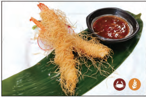
17/ EBI KATAIFI 2PZ €5.00 gamberi* fritti, avvolto esterno pasta frita