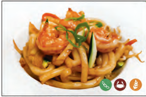
127/ UDON GAMBERI €6.00 con gamberi* e verdure