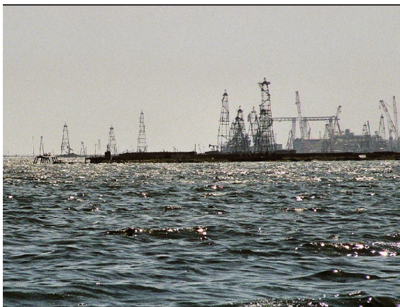
Նավթի հանույթը Ապշերոնի ծանծաղուտում

Արդյունաբերությունը շարունակում է մնալ Աղբբեջանի տնտեսության առաջատար ճյուղը: Արդյունաբերության առաջատար ճյուղը նավթի հանույթն ու վերամշակումն է: Աղբբեջանը նավթի ու գազի հանույթի հնագույն շրջաններից մեկն է աշխարհում: 1913թ. Բաքուն տալիս էր Ռուսաստանի արդյունահանվող նավթի 7/10-ը: Ներկայումս նավթի տարեկան հանույթը կազմում է 10-12 մլն տ: Նավթի մի մասը մշակվում է Բաքվում, մյուս մասը արտահանվում է Բաքու-Թբիլիսի-Ջեյհան նավթամուղով: Բնական գազի տարեկան հանույթը (5 մլրդ մ 3 ) չի բավարարում երկրի պահանջը, որի պատճառով գրեթե նույնքան էլ ներմուծվում է: