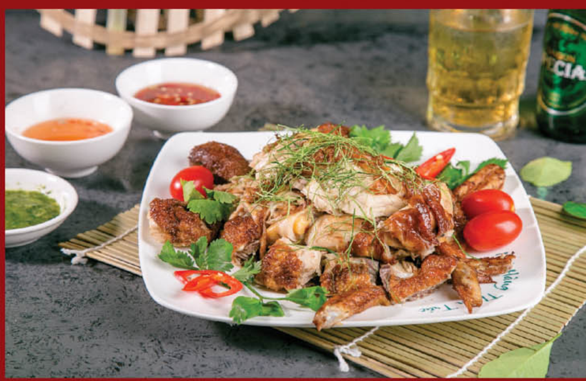
Gà nướng mắc khén 225.000 đ