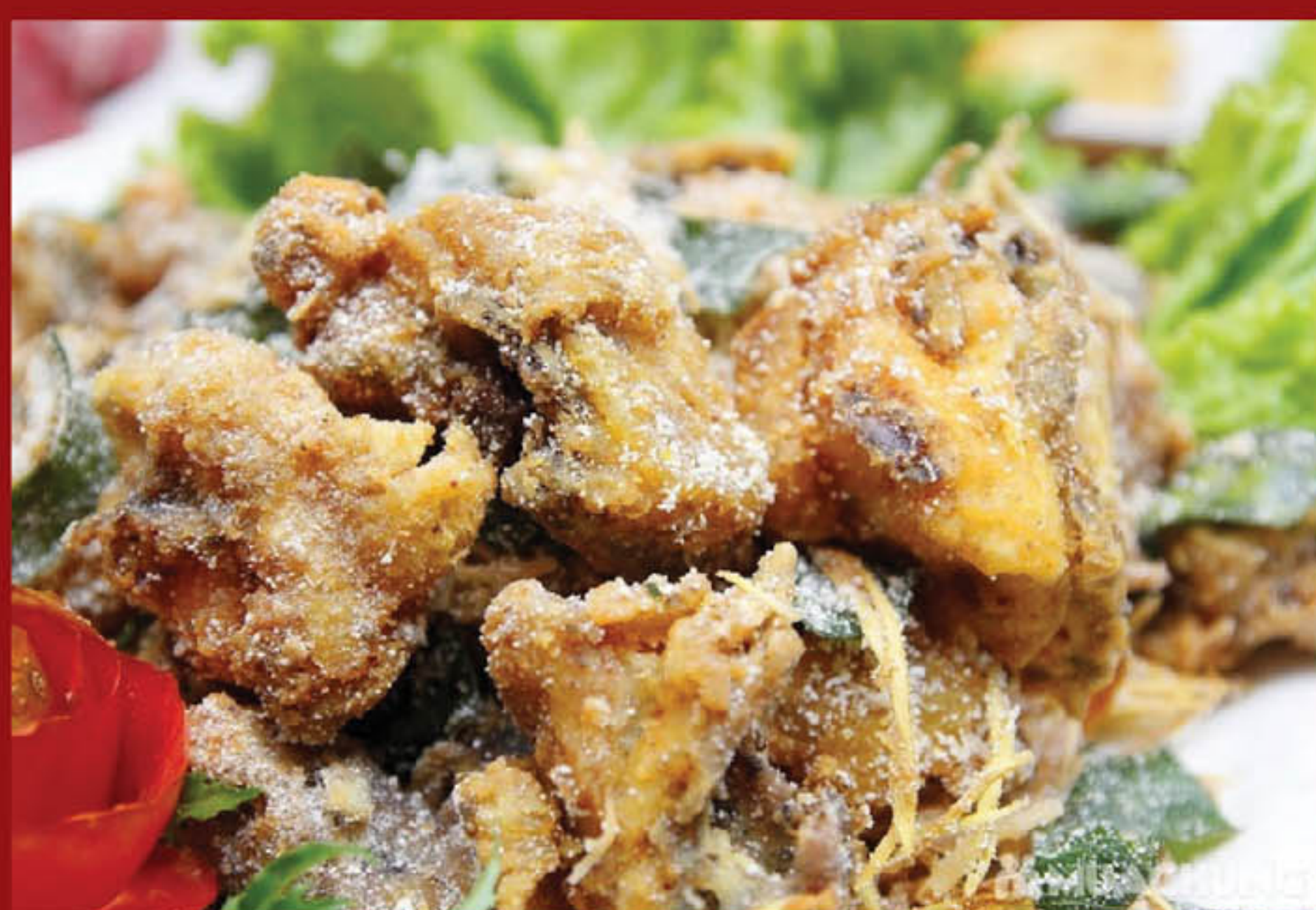
Gà rang muối 225.000 đ