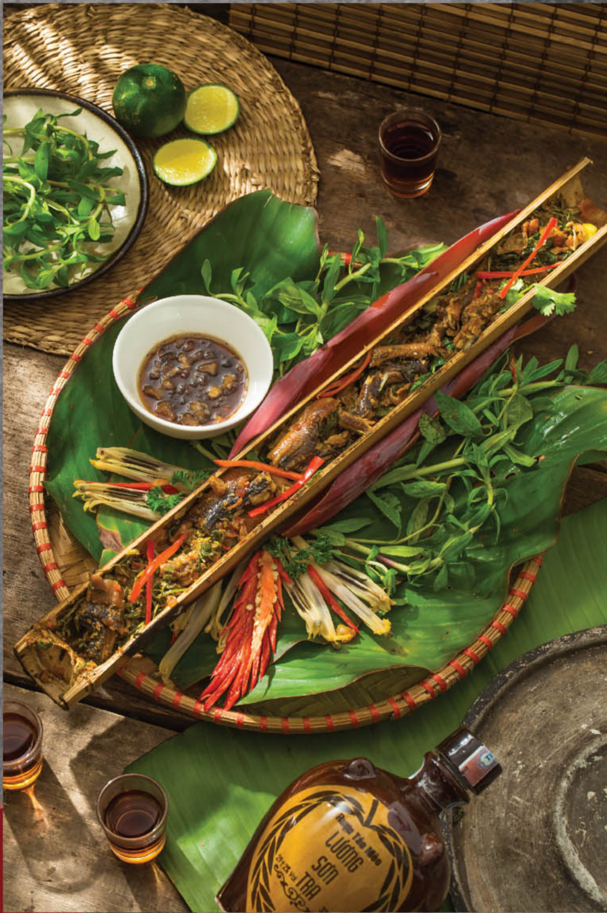
Lươn nướng ống tre 215.000 đ