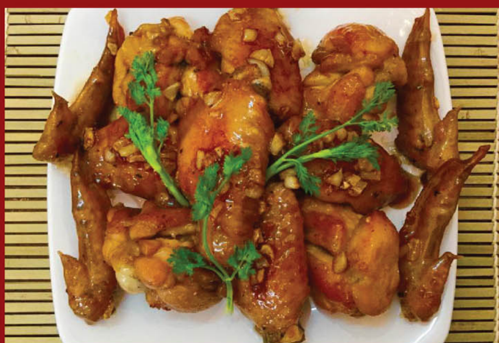
Gà chiên mắm nhĩ 225.000 đ