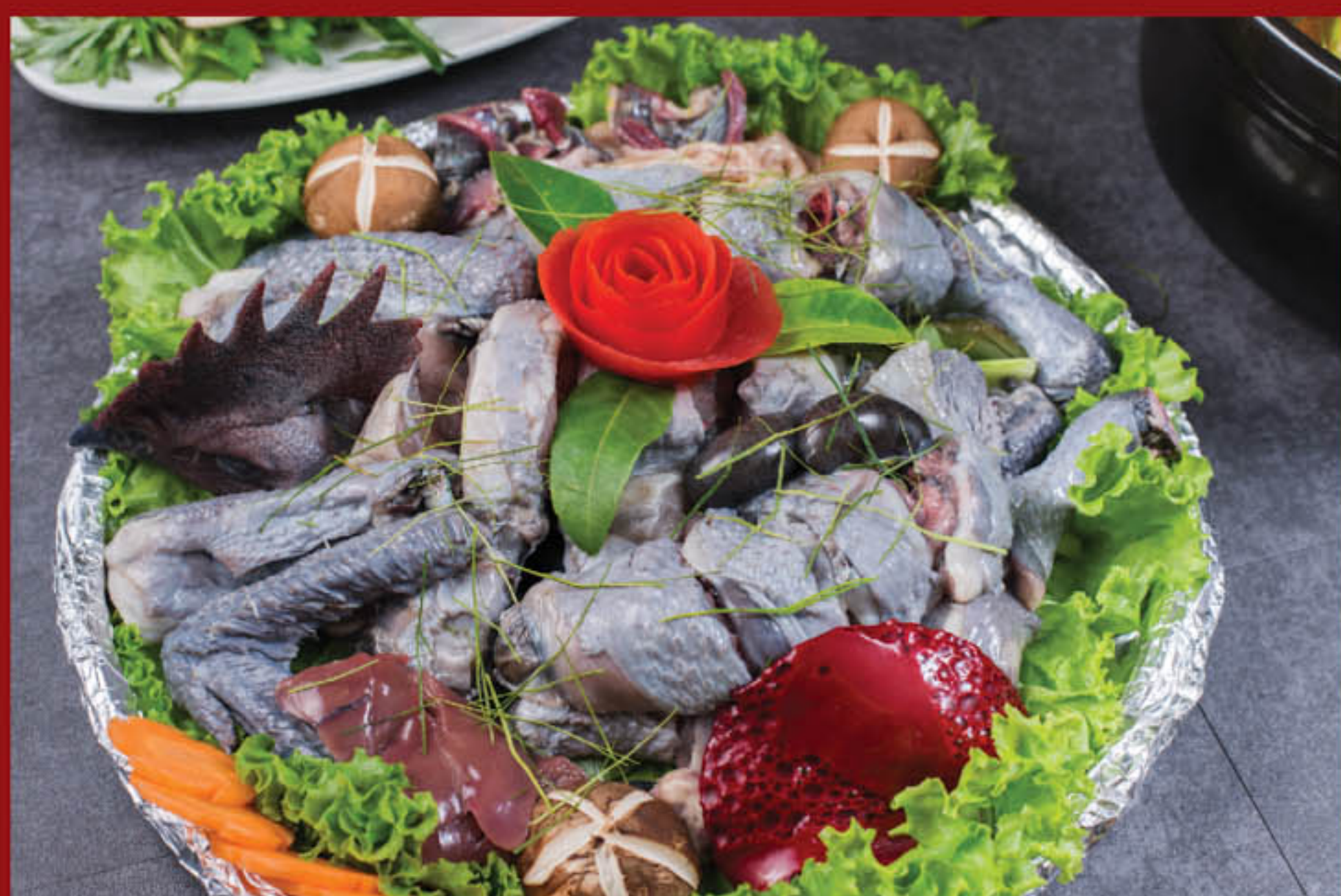
Hắc kê ngự hàn băng 375.000 đ