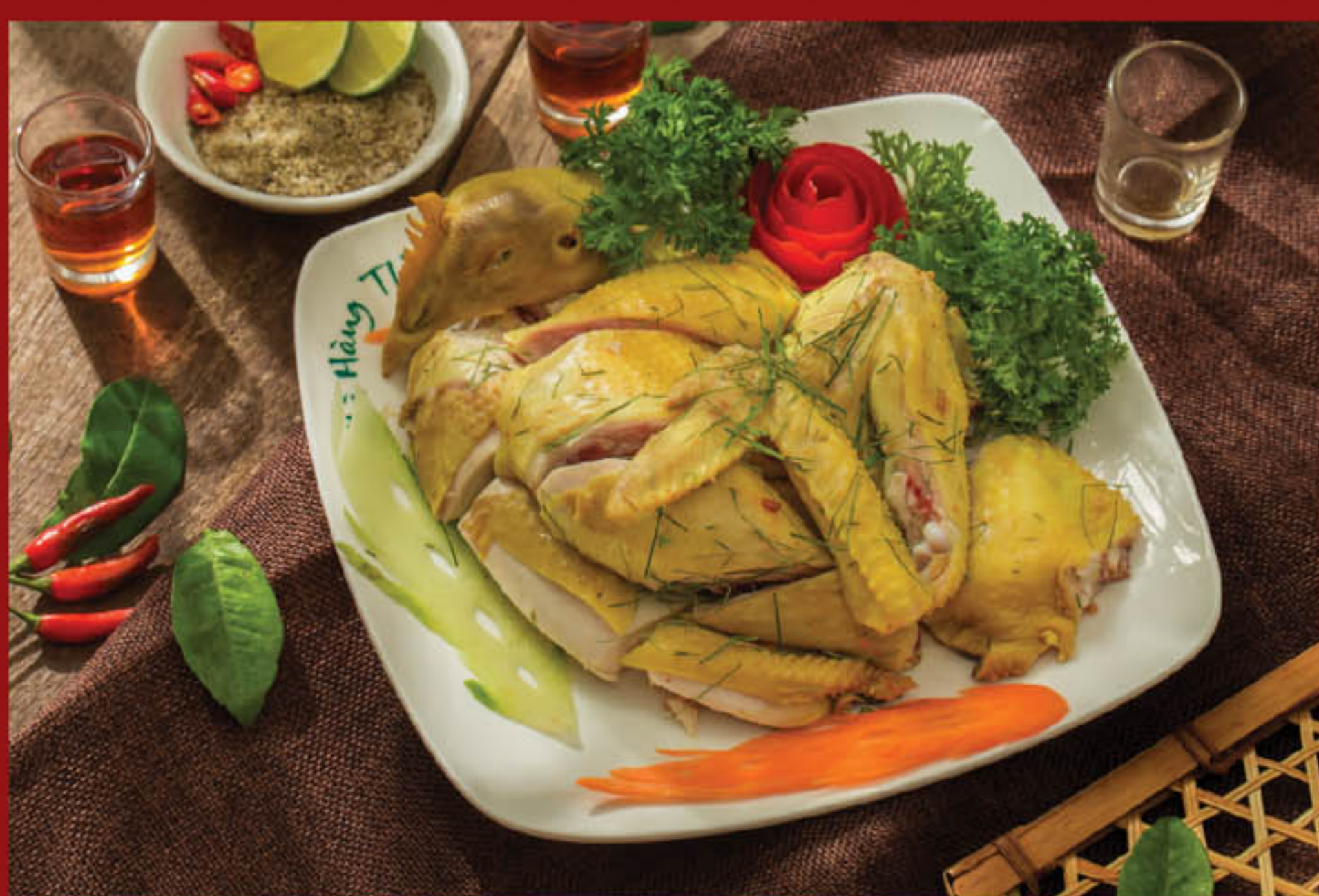
Gà hấp lá chanh 225.000 đ