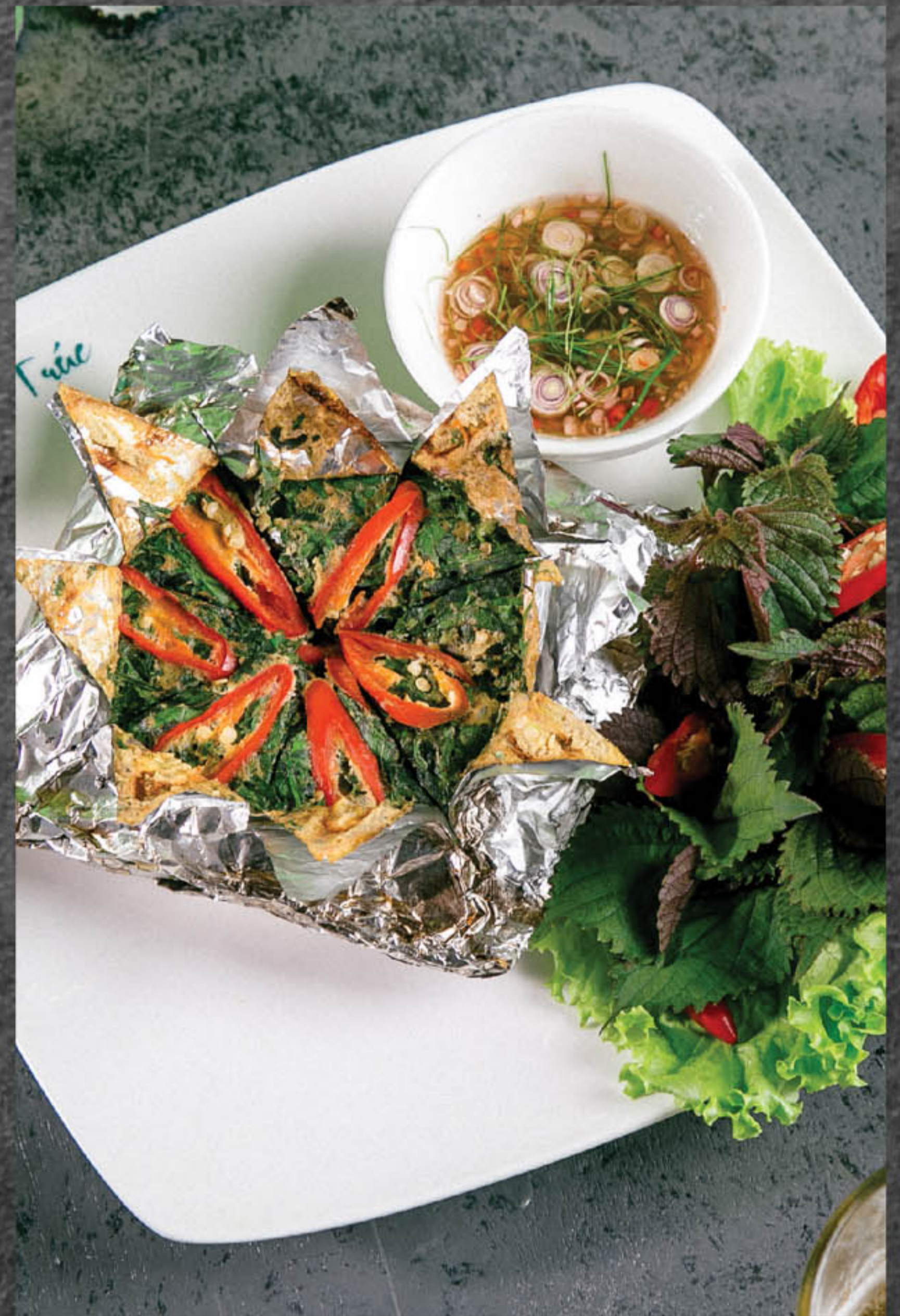
Chả ốc Thiên Ân 115.000 đ