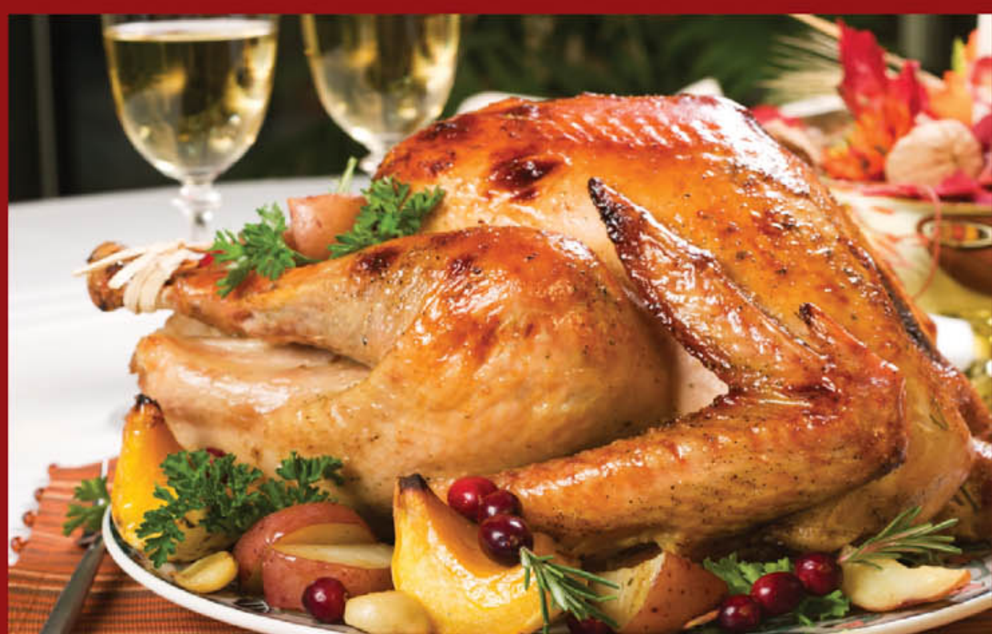
Gà quay lu 225.000 đ