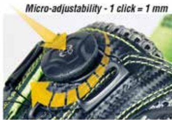
Push and rotate clockwise