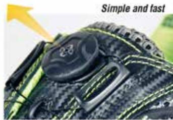
Pull to release the lacing