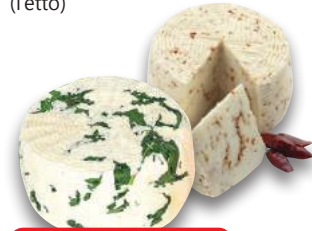
Formaggio Fresco Farcito (l'etto)