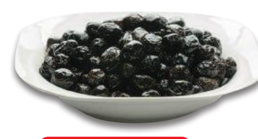
Olive Nere Secche Condite (l'etto)