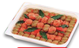
Olive Ripiene alla Messinese (l'etto)