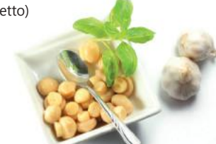
Funghi Champignon Sott'Olio (l'etto)