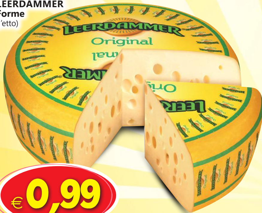
LEERDAMMER Forme (l'etto)