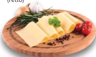
EDAMER Rosso (l'etto)