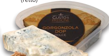
GUSTO & PASSIONE Gorgonzola DOP (l'etto)