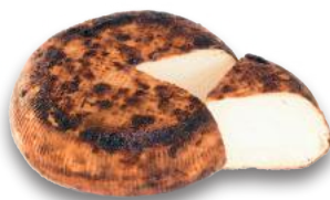
Ricotta Dura al Forno (l'etto)