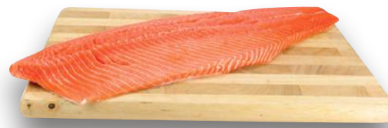
Salmone Norvegese a Fette (l'etto)