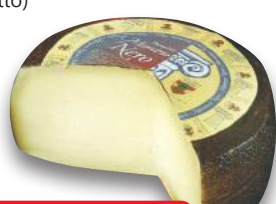
ALTA TUSCIA Pecorino Martano Nero DOP (l'etto)