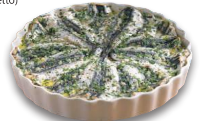
Filetti di Alici Marinate (l'etto)