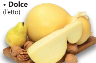
Provola Fresca • Schiacciata • Dolce (l'etto)