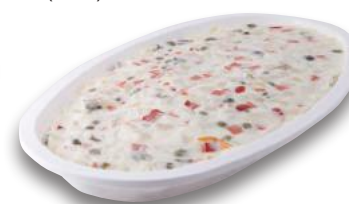
Insalata Russa Vaschetta (l'etto)