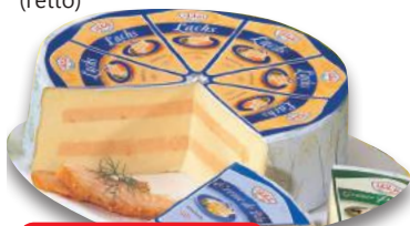
Torta di Formaggio al Salmone (l'etto)