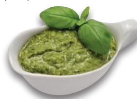
Pesto Fresco Genovese DOP (l'etto)