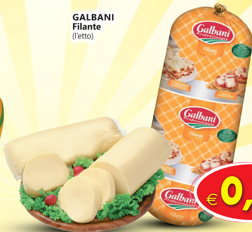
GALBANI Filante (l'etto)