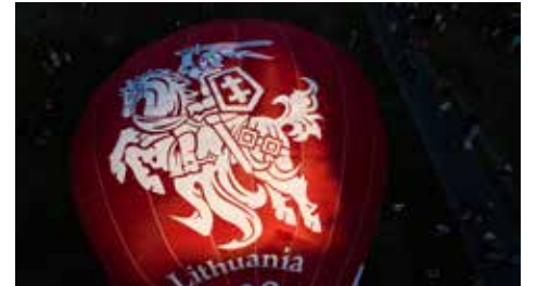
Šimtmečio oro balionas Miesto šventei