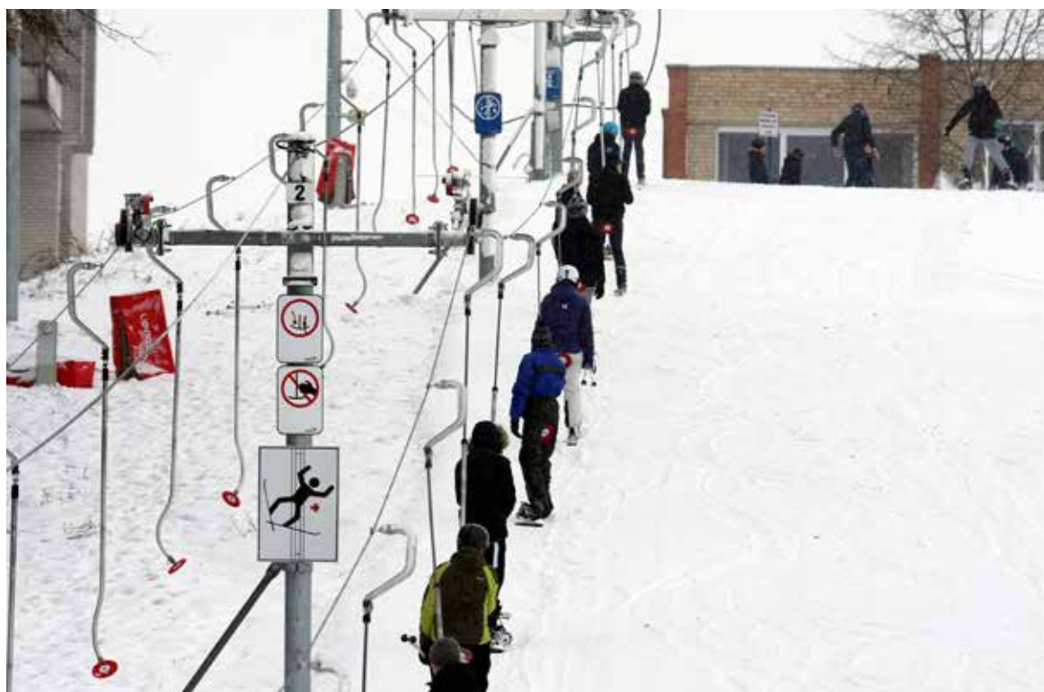
Slidinėjimo centras pritraukia daug žiemos sporto mėgėjų

Siekiame, kad Jonavos kraštas taptų viena patraukliausių vietų gyventi, auginti vaikus, dirbti ir ilsėtis. Mes už klestinčią Jonavą ir laimingus jonaviečius. ●