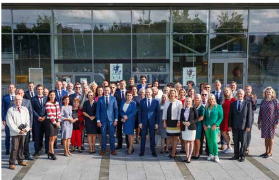
Mūsų komanda, dirbanti Jums!