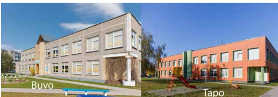
Lopšelis – darželis „Žilvitis“