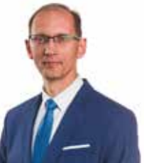
15 ELEGIJUS LAIMIKIS