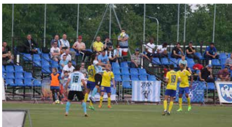
Sporto austruoliams įrengtos naujos tribūnos

Atsižvelgdami į gyventojų pageidavimus ir siekdami, kad spor-