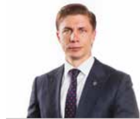
1 MINDAUGAS SINKEVIČIUS