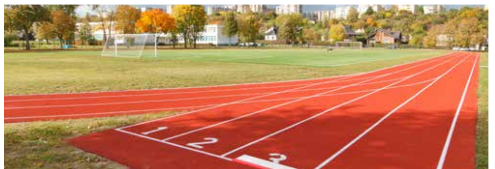
Senamiesčio gimnazijos stadionas