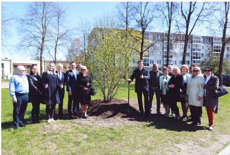
Magnolija miesto centre