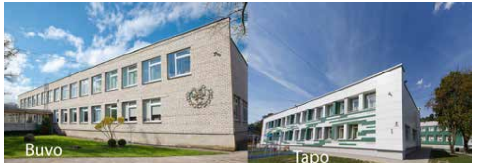
Lopšelis – darželis „Pakalnutė“