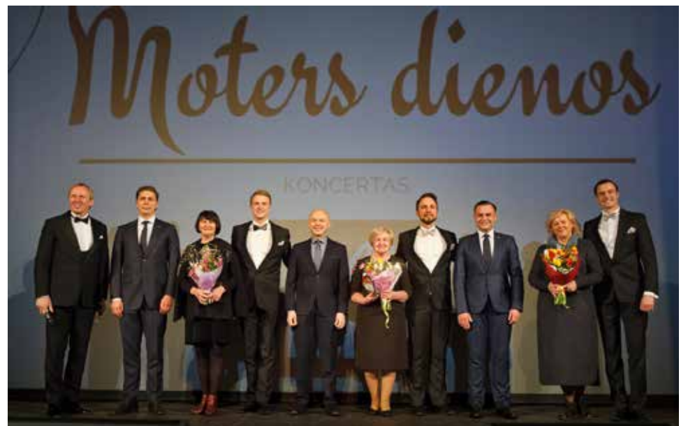
Moters dienos koncertas