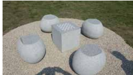
Lauko šachmatų stalas