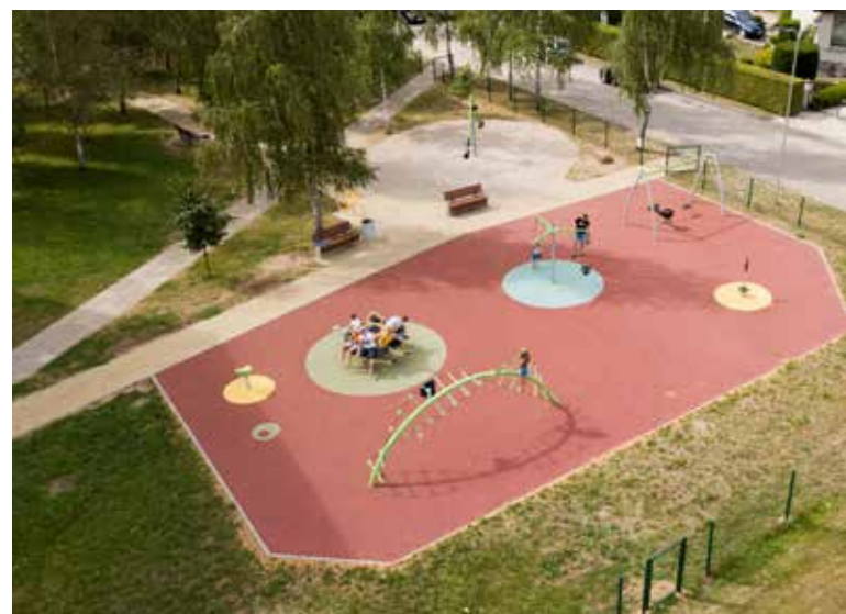
Nuolat atnaujinamos vaikų - žaidimų aikštės

Veiklą pradėjo ir Jonavos sporto savanoriai – unikali jaunimo savanorių organizacija sporto, kultūros, socialiniuose ir kt. pobūdžio renginiuose. Savivaldybė finansuoja ir plečia atviros jaunimo erdvės – Jonavos jaunimo centro veiklą. Kiekvienais metais įgyvendinama vaikų vasaros socializacijos programa, sudaranti galimybę prasmingam vasaros praleidimui. Ir toliau kasmet skirsime lėšų miesto ir kaimo bendruomenėms, jaunimo nevy-