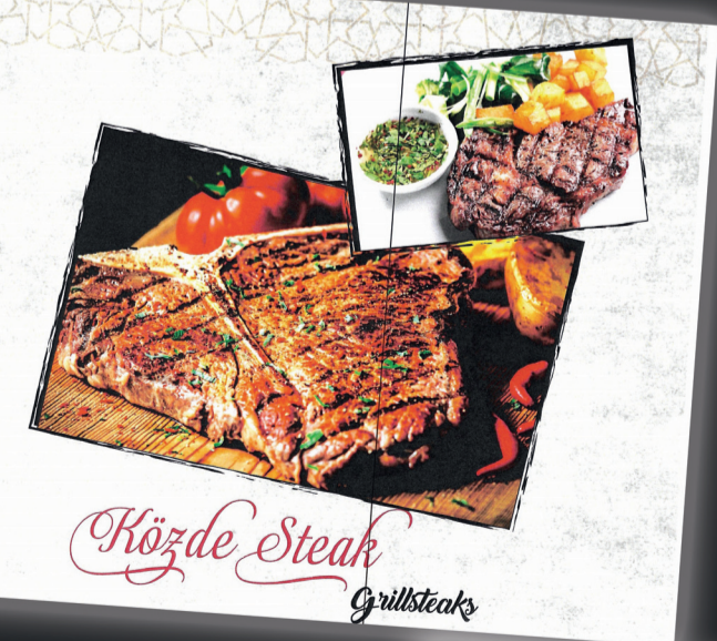
Közde Steak Grillsteaks

Modern dizaynli ve şahane atmosferli restoranımızda hergün Çorba, Kebap, Steak, Lahmacun, Pide, Fırın ve Tava yemeklerini sizin için sakın bir ortamda tadabilirsiniz.