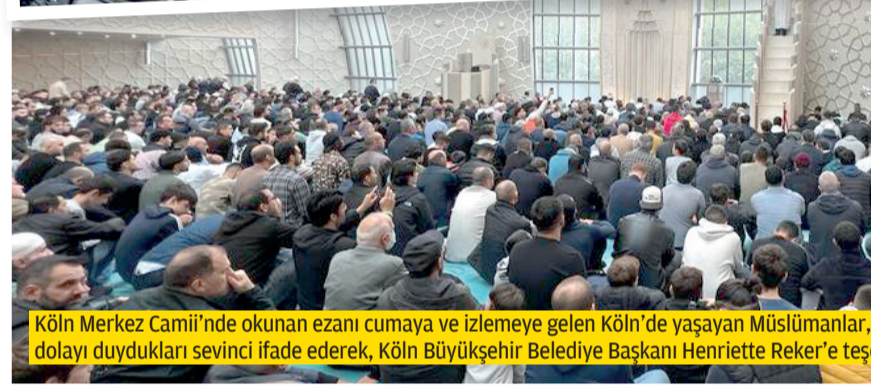
Köln Merkez Camii'nde okunan ezanı cumaya ve izlemeye gelen Köln'de yaşayan Müslümanlar, ezan okunmasından dolayı duydukları sevinci ifade ederek, Köln Büyükşehir Belediye Başkanı Henriette Reker'e teşekkür etti.