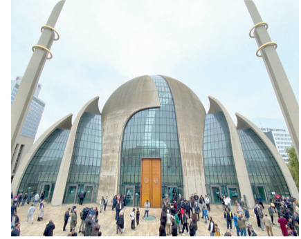
düzeyinin üzerine çıkmamak şartıyla ezan okunacak."

Köln'de ezan okunabilmesi için istenen şartları rapor halinde yerine getirdiklerini belirten Şahinarslan, detaylar hakkında şu bilgileri verdi: "İki yıllık bir pilot proje için şart koşulan raporlar bilirkişi tarafından hazırlanıp sunuldu. Sadece Cuma günlerine özel 12.00-15.00 saatlerinde 5 dakikayı geçmemek ve komşuları rahatsız etmemek, 100 metre mesafede 60 desibel ses