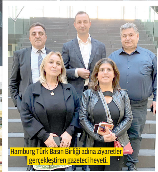
Hamburg Türk Basın Birliği adına ziyaretler gerçekleştiren gazeteci heyeti.