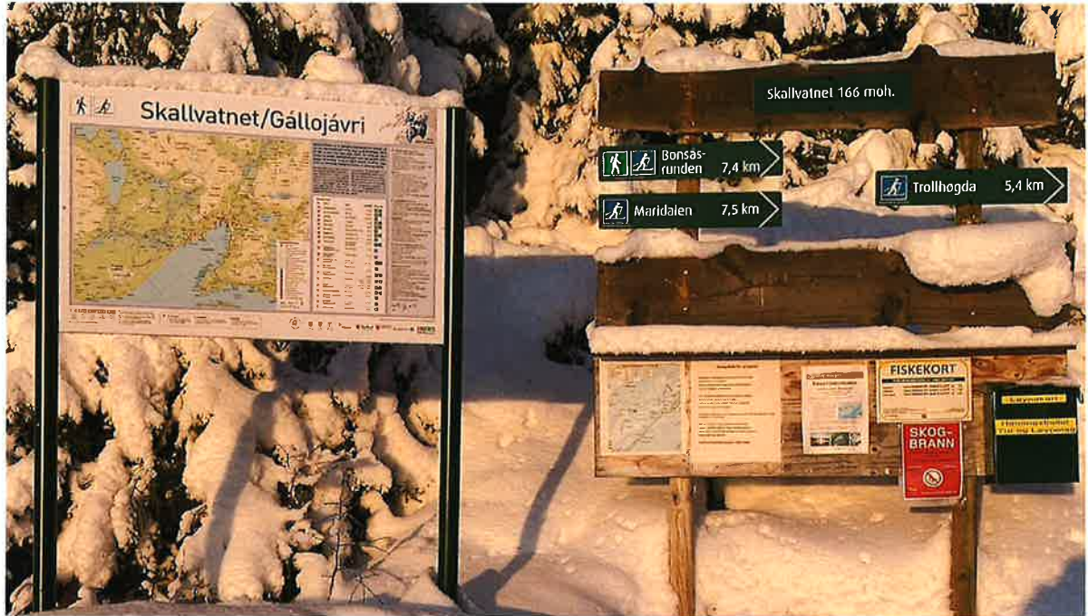
Herjangen tur og løypelag har montert infotavler og skilt som viser til barmark og vinterløyper