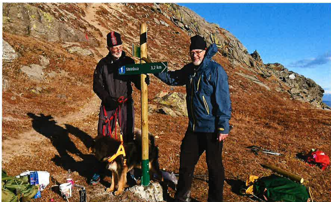
Ballangen Turlag i full sving med skilting i fjellet

Sikre trafikksikre P-plasser og adkomster for friluftslivets ferdselsårer i reguleringsplaner og kommuneplanens arealdel.