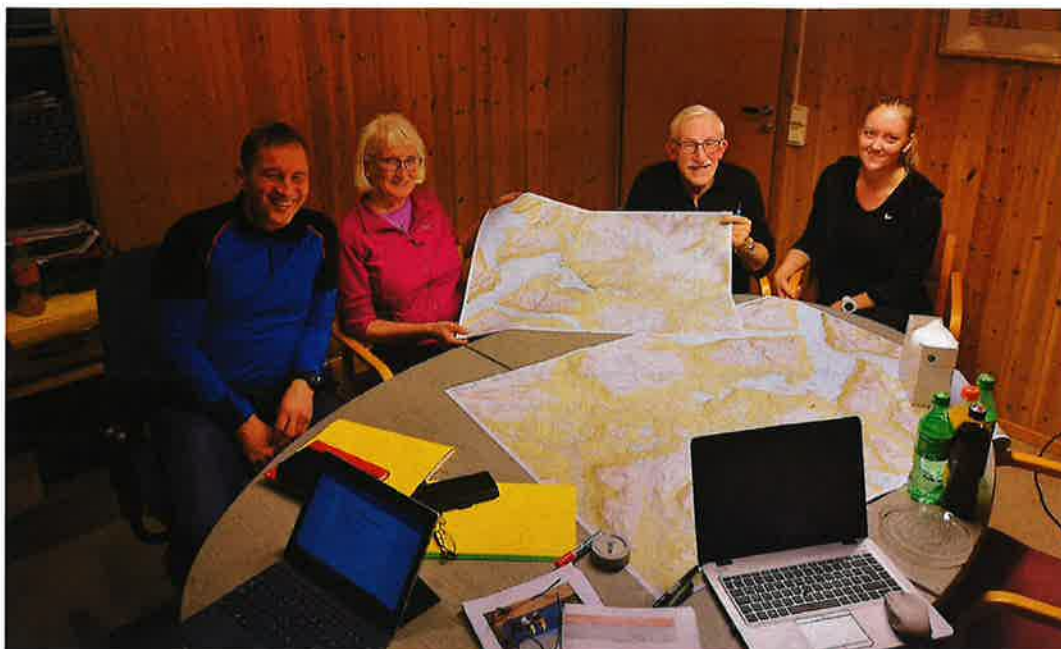
(Salangen kommune sin arbeidsgruppe til ferdselsåreplanen)

Ferdselsåreplanen er en temaplan og binder ikke i seg selv arealbruk. For kommunene avsettes det midler på driftsbudsjett til planarbeidet, samt at det bevilges et mindre bidrag fra kommunene til Midtre Hålogaland friluftsråd for bistand. Friluftsrådet søker i tillegg om midler til planarbeidet hos fylkeskommunene, MD og andre. Friluftsrådet anbefaler at planen innarbeides i kommunens ordinære planverk