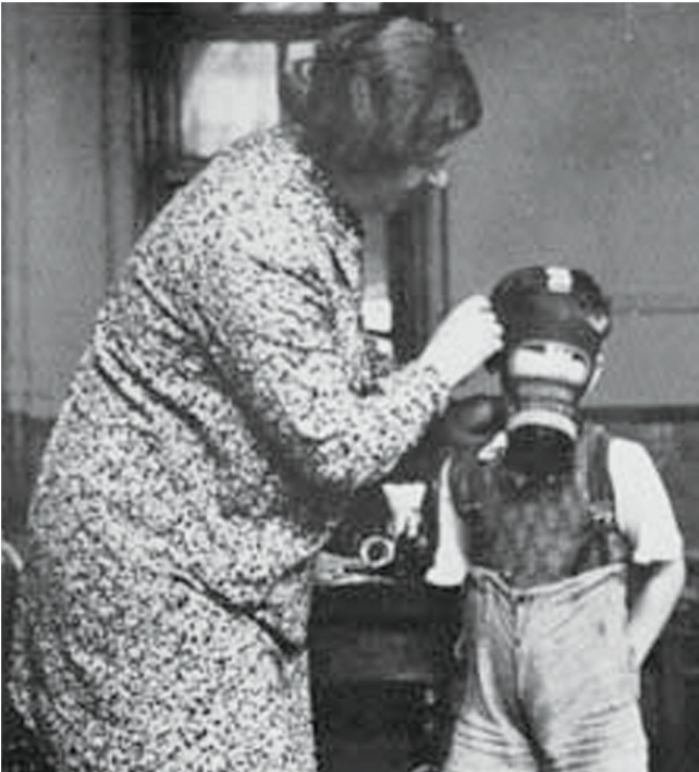
Φόρα το παιδάκι μου για το καλό σου είναι κι αυτό...