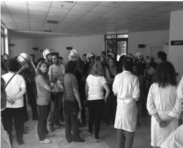
Η δημόσια τάξη στα νοσοκομεία

Κάθε είδους δημαγωγοί προσπαθούν εδώ και καιρό να μας πείσουν ότι προκειμένου «να σωθεί η χώρα και η εθνική οικονομία», «να εξυπηρετηθεί το δημόσιο χρέος» και άλλα τέτοια βαρύγδουπα πρέπει να κάνουμε θυσίες. Ειδικά στην περίπτωση της διάλυσης των νοσοκομείων και των δομών υγείας ο εκβιασμός αυτός σχετικά με «θυσίες που απαιτούνται» γίνεται ανατριχιαστικά κυριολεκτικός.