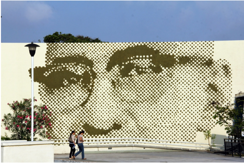
Concepto artístico y coordinación de ejecución del Mural "La Mirada de Monseñor Romero", Plaza de las Banderas , Ministerio de Relaciones Exteriores de El Salvador. Ciudad Merliot . Año de 2014 Acrílico sobre concreto. Dimensiones : 8.00 x 12.0 mts