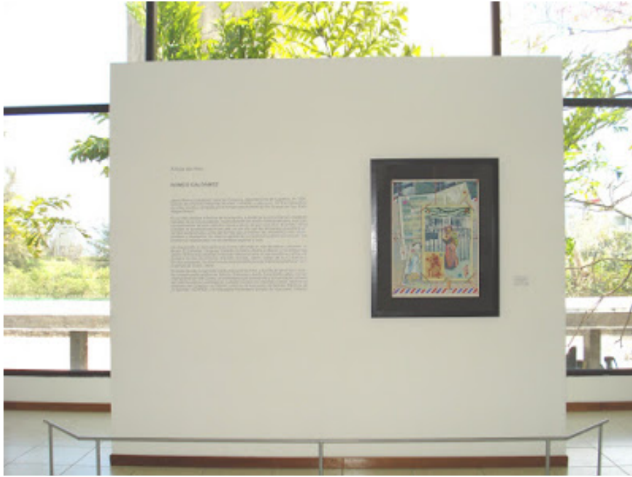
ROMEO GALDAMEZ / Artista del Mes . Museo de Arte de El Salvador, 2008