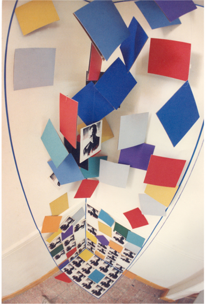
Homenaje a Monseñor Romero.1984. Instalación de Romeo Galdámez. 4.00 x 1.00 x 1.00 mts.. Escuela Michoacana de Diseño , Morelia, Michoacán, México.