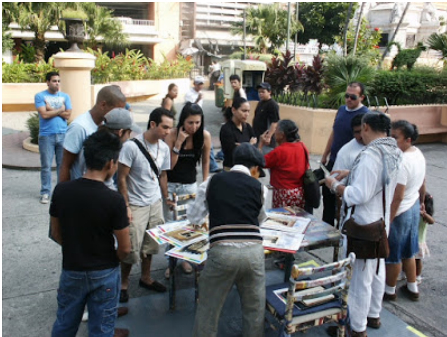
Territorios en tránsito/arte en la red urbana. Colectivo La Fábrica. Plazas públicas de San Salvador y Santa Tecla, El Salvador, C.A..2009