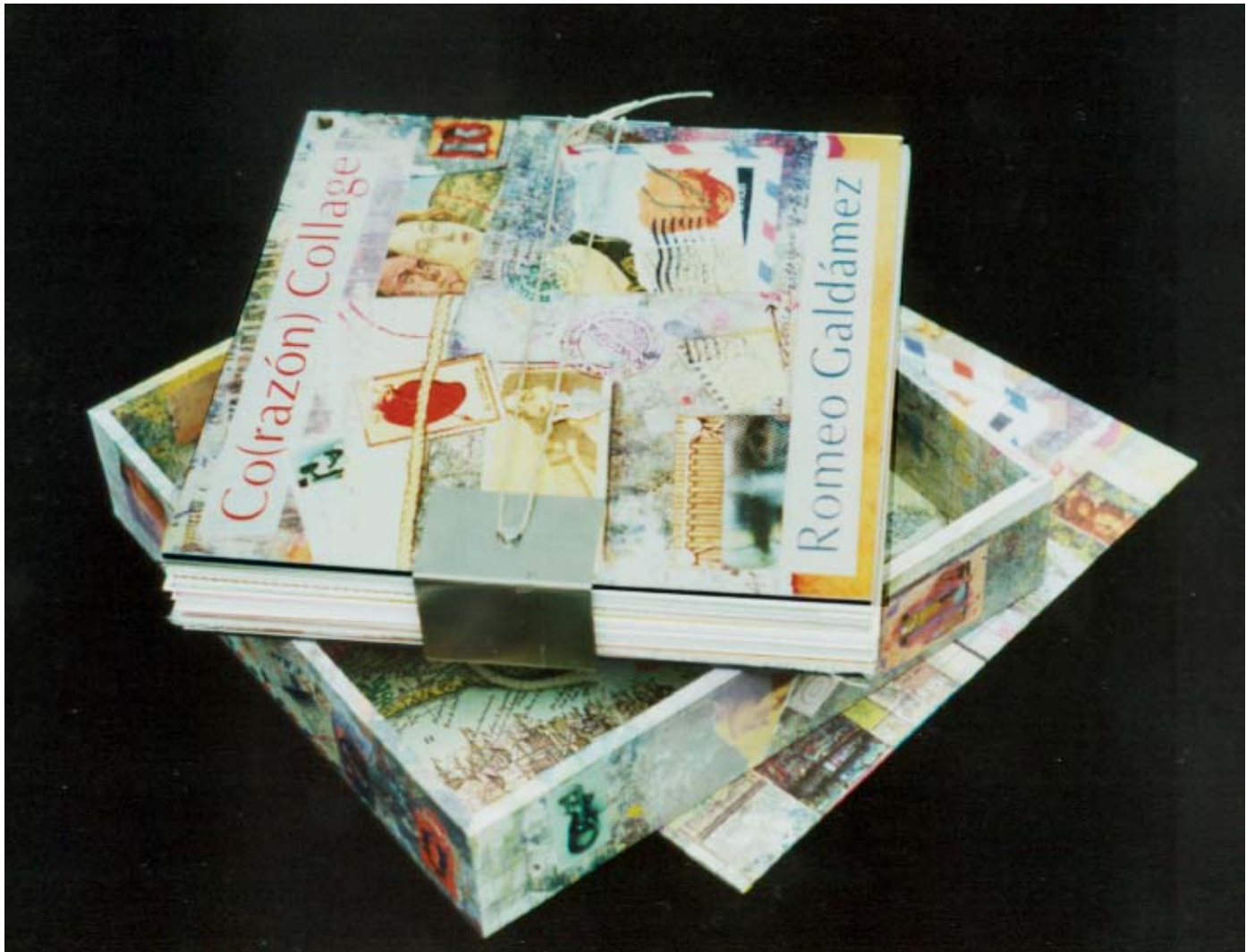
LIBRO-OBJETO DE AUTOR . Ediciones DOS DE DOS. México. 1998