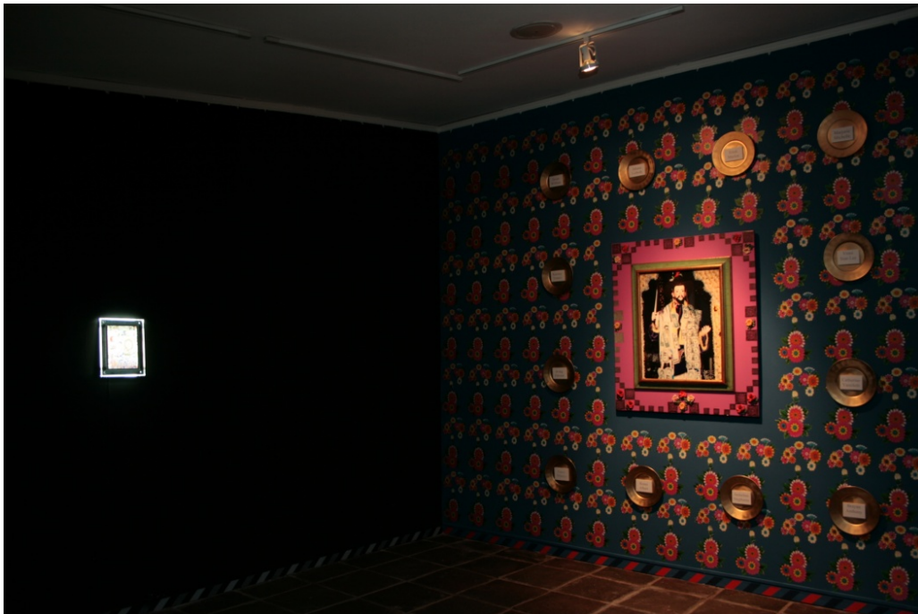
Exposición Posdata: identidades. com(partidas) . Centro Cultural de España. San Salvador, El Salvador. 2008.