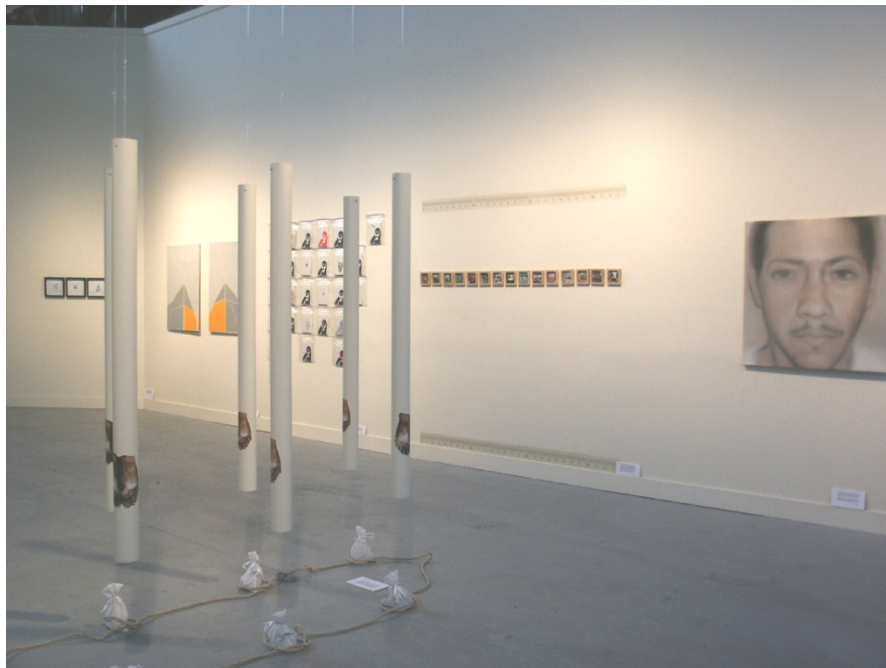
TERRITORIOS / Somarts Main Gallery Colectivo La Fábri-K. San Francisco, CA. USA. 2009.