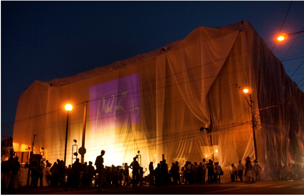
Concepto artístico y coordinación de la producción de instalación e intervención urbana. Teatro Nacional de San Salvador. El Salvador. Año 2011