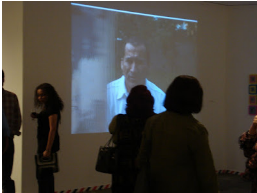
Exposición Posdata: identidades. com(partidas) . Centro Cultural de España. San Salvador, El Salvador. 2008.