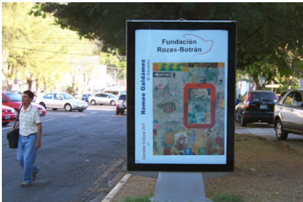
CORREDOR CULTURAL. Fundación Rozas-Bostrán. Espacios públicos simultáneos en las ciudades de Guatemala y San Salvador. Centroamérica. 2010/2011.