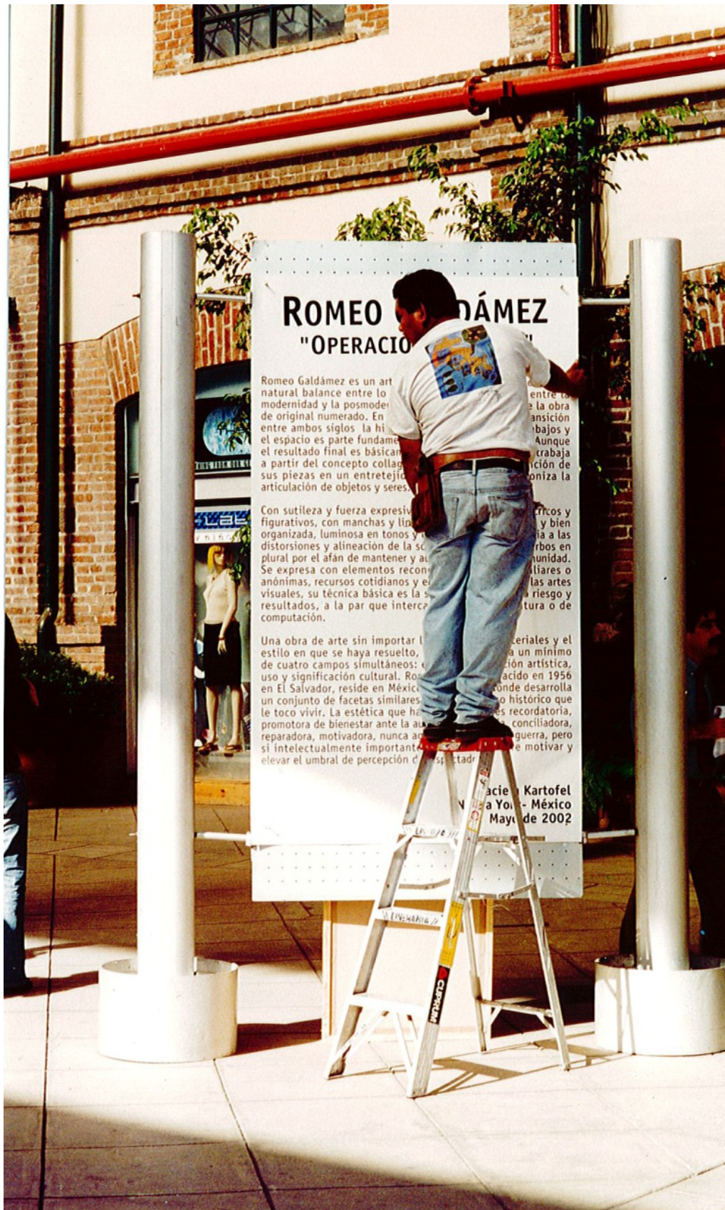
Retrospectiva. Galería Nave Mayor de Plaza Loreto, México, D.F. México. 2002