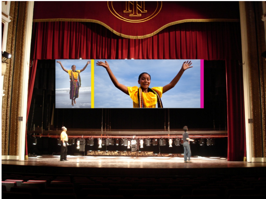
Concepto artístico y producción de video-instalación. Teatro Nacional de San Salvador. El Salvador. Año 2012