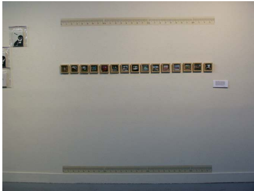
TERRITORIOS / Somarts Main Gallery Colectivo La Fábri-K. San Francisco, CA. USA. 2009.