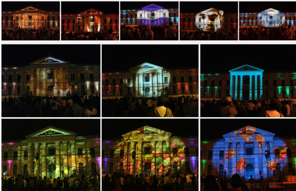
Concepto artístico y coordinación de la producción del videomapping "BICENTENARIO", Palacio Nacional, San Salvador. El Salvador. Año 2011