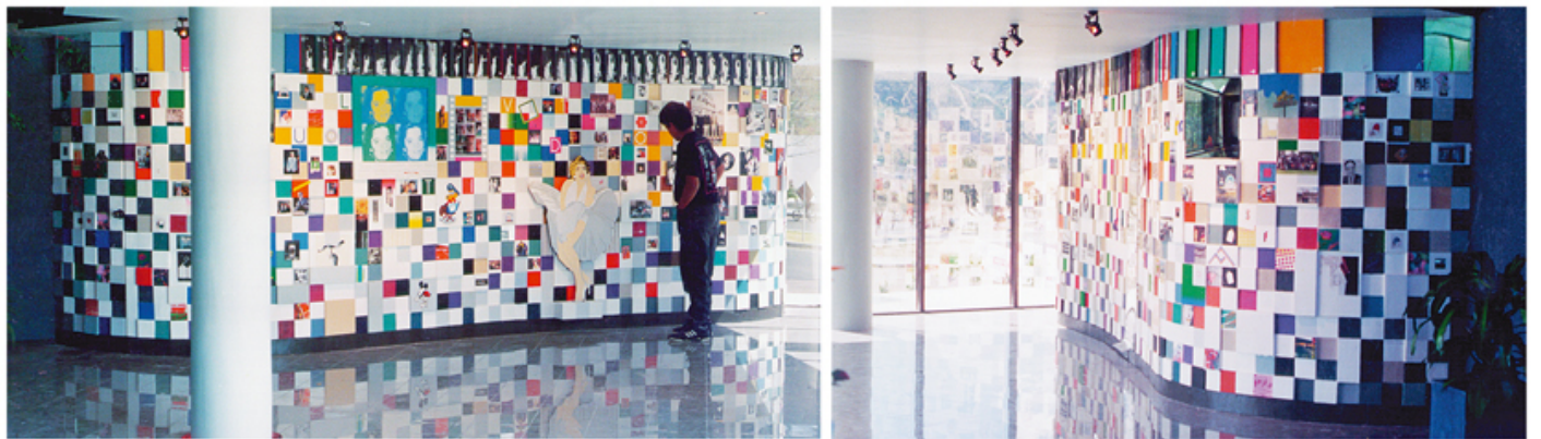
Mural en edificio de oficinas centrales de Multivideo Mexicano . 1992 Organización Ramírez, S.A. de C.V., Morelia , Michoacán, México. Técnica: mixta sobre tela. 2.20 x 14.00 mts..