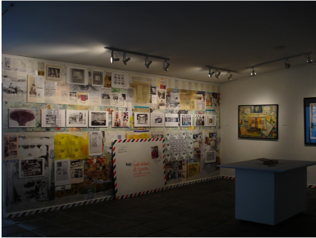
Exposición Posdata: identidades. com(partidas) . Centro Cultural de España. San Salvador, El Salvador. 2008.