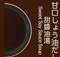
甘口しょう油だし 甜醬油湯 Sweet Soy Sauce Soup