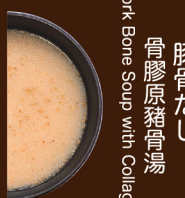
コラーゲン 豚骨だし 骨膠原豬骨湯 Pork Bone Soup with Collagen