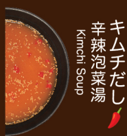
キムチだし 辛辣泡菜湯 Kinchi Soup