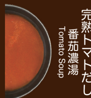
完熟トマトだし 番茄濃湯 Tomato Soup