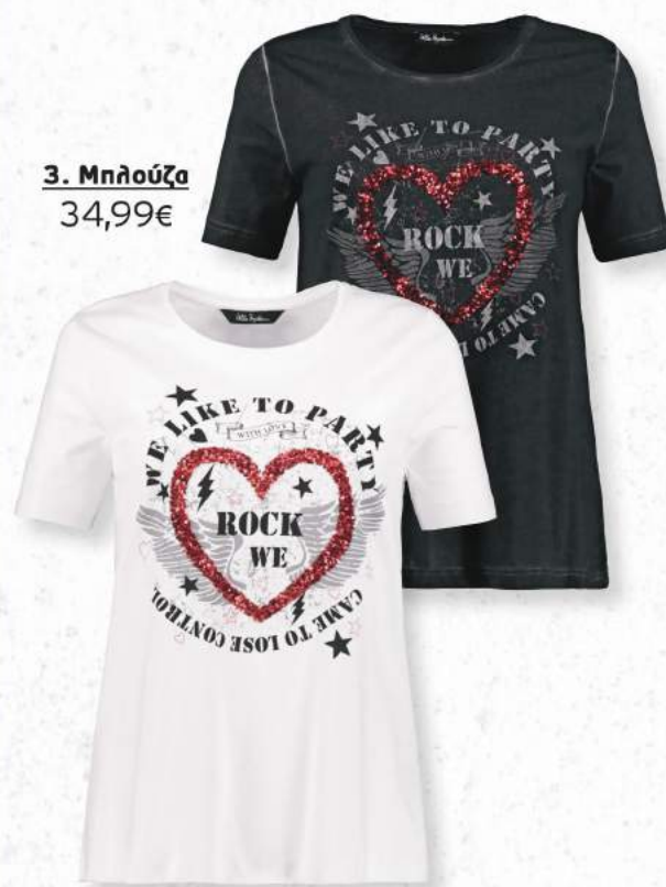
3. Μηλούζα 34,99€