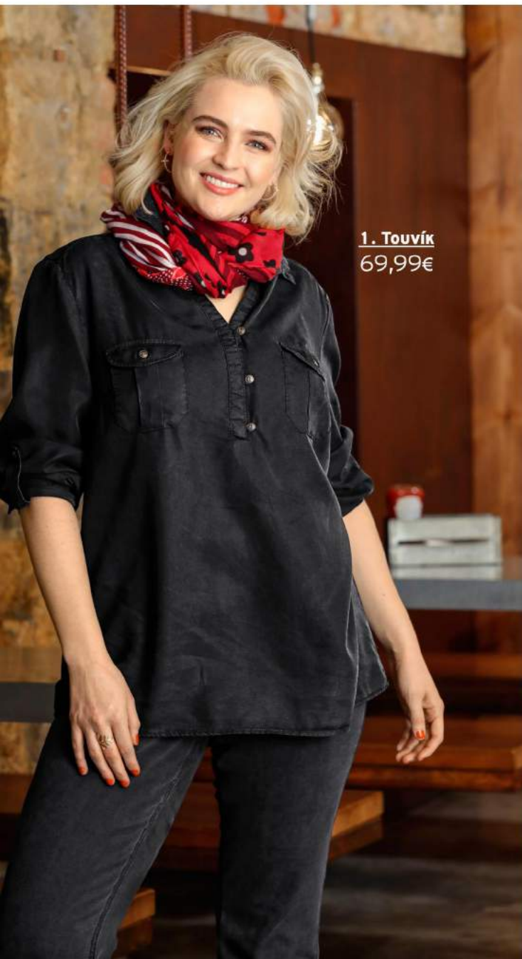
1. Τουνίκ 69,99€