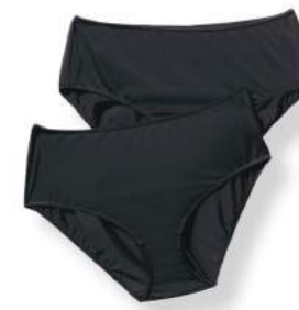
11. Σλιπ 2τμχ 22,99€