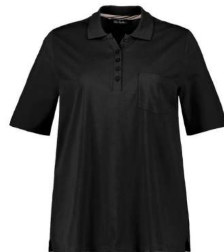
3. Μπλούζα 44,99€