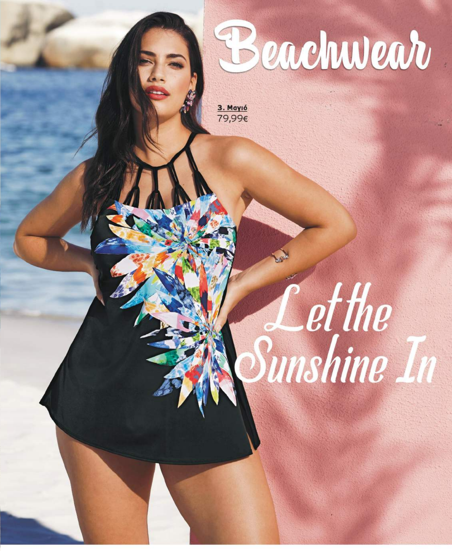
3. Μαγιό 79,99€