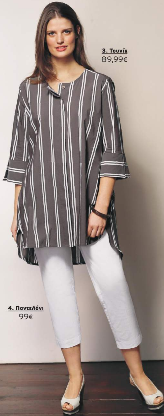
3. Τουνίκ 89,99€