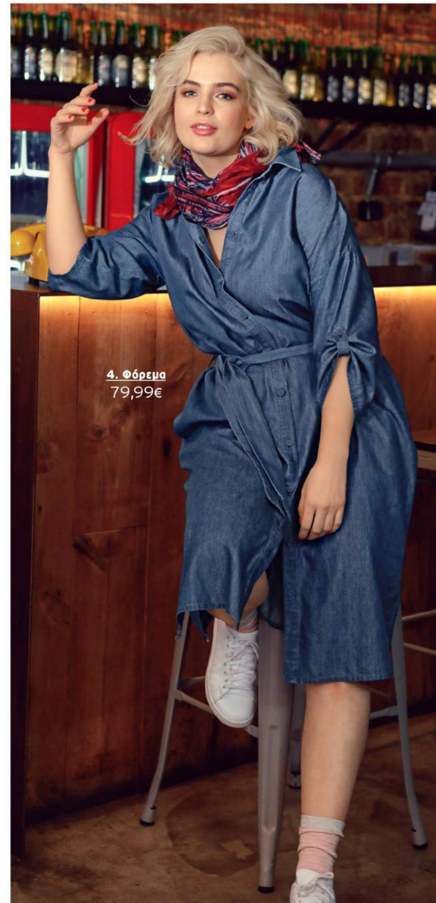
4. Φόρεμα 79,99€

1 Τουνίκ με τσέπες στο στήθος, πιέτα στην πλάτη και μακριά μανίκια που μαζεύουν. 100% Lyocell. Πλύσιμο στο πλυντήριο. Μήκος περίπου: 68-78 cm. Μεγέθη: 42/44, 46/48, 50/52, 54/56, 58/60, 62/64 723 654 10 Μαύρο 69,99€