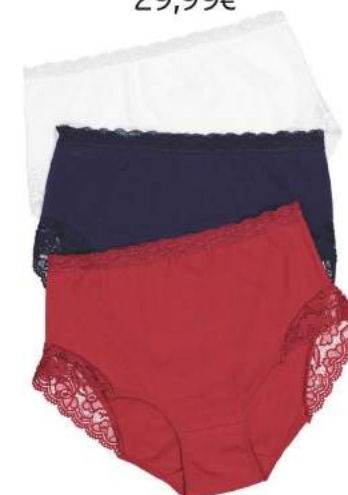
6. Σλιπ 3τμχ 29,99€

1 Μπουστάκι 2 τεμάχια. 82% Polyamid, 18% Elasthan. Μεγέθν: CUP D: 85, 90, 95, 100, 105, 110, 115, 120, 125, 130