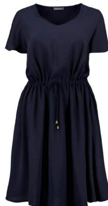
5. Φόρεμα 89,99€