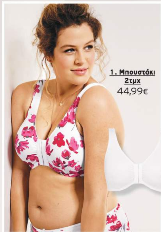
1. Μπουστάκι 2τμχ 44,99€