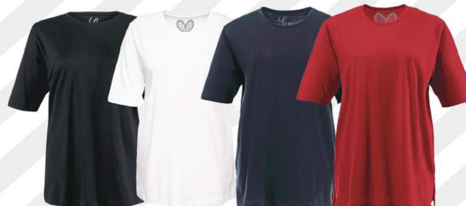
3. Μπλούζα 15,99€