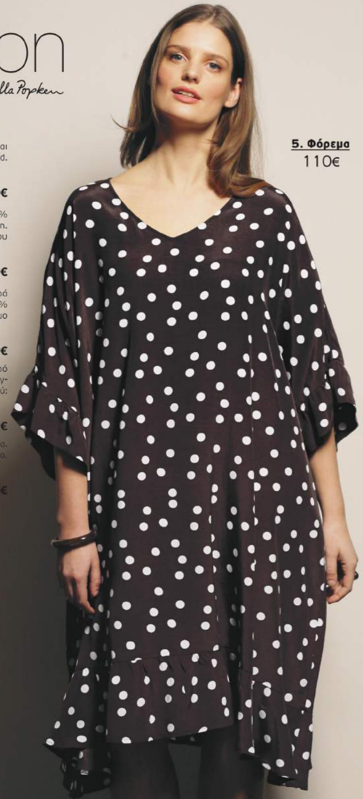
5. Φόρεμα 110€

5 Φόρεμα πουά, ιδιαίτερο άνετο με 3/4 μανίκια. 100% Viskose. Πλύσιμο στο πλυντήριο. Μήκος περίπου: 100-104 cm. Μεγέθη: 42/44, 46/48, 50/52, 54/56, 58/60 724 148 30 Καφέ 110€