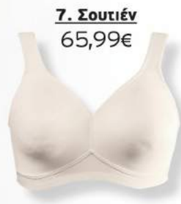
7. Σουτιέν 65,99€

2 Μπουστάκι με κούμπωμα εμπρός. 82% Polyamid, 18% Elasthan. Πλύσιμο στο πλυντήριο. Μεγέθη: CUP D: 85, 90, 95, 100, 105, 110, 115, 120, 125, 130 689 668 10 Μαύρο 689 668 20 Λευκό 22,99€