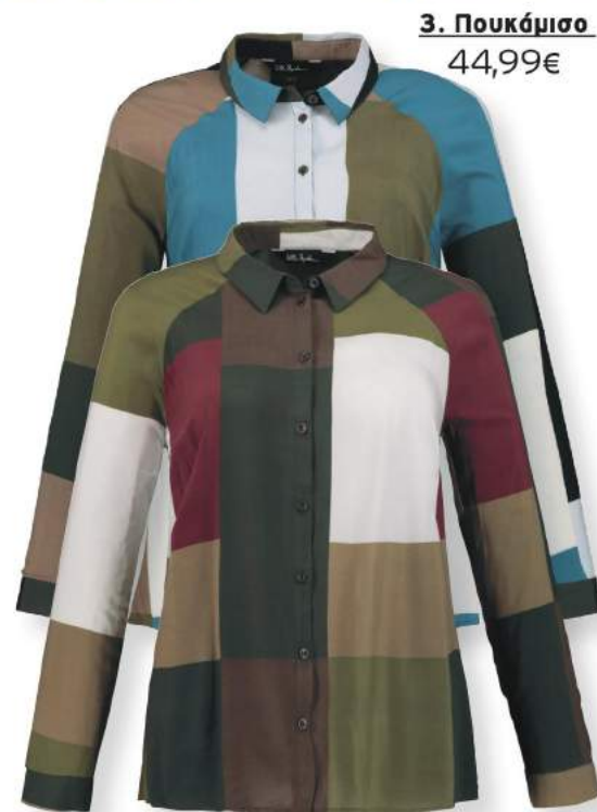
3. Πουκάμισο 44,99€