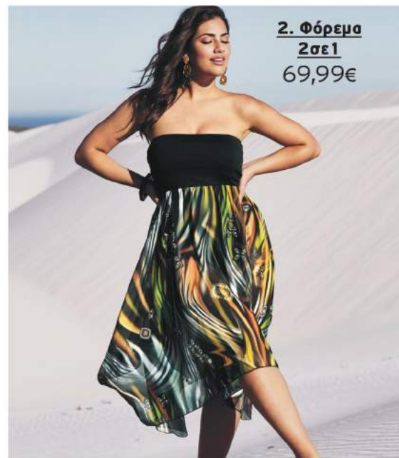
2. Φόρεμα 2σε1 69,99€