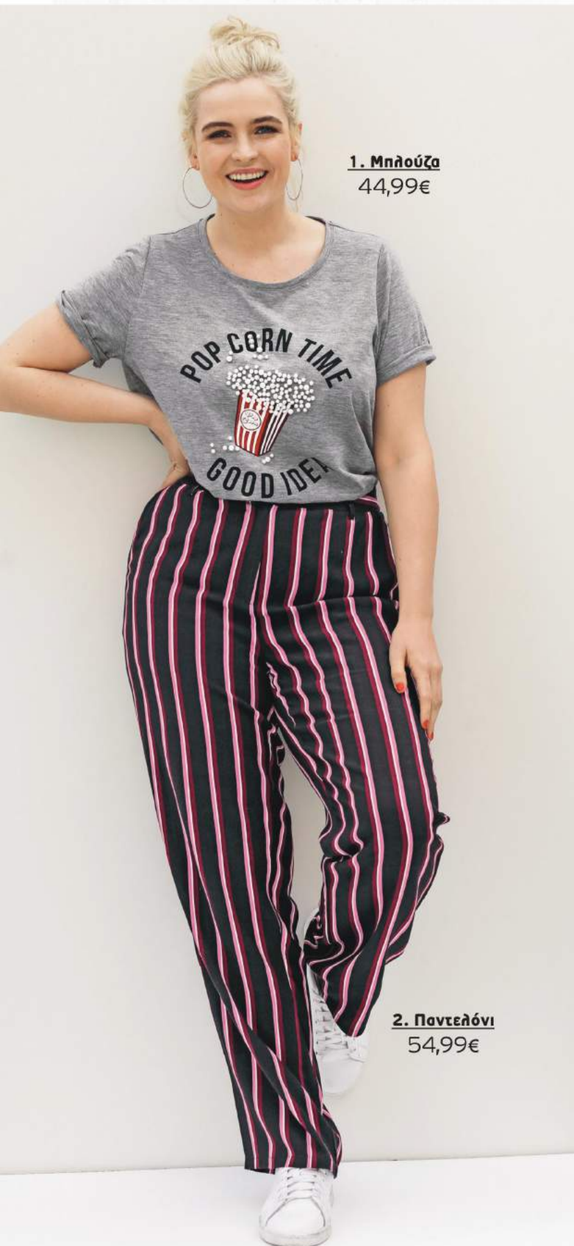
1. Μηλούζα 44,99€