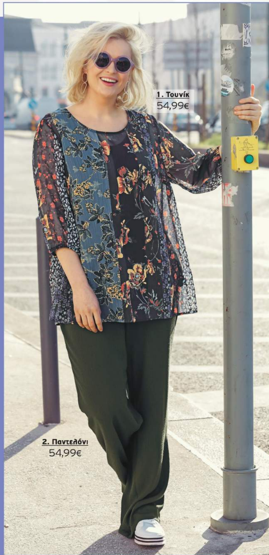
1. Τουνίκ 54,99€

5 Μπλούζα σε A γραμμή, με V λαιμό και κοντά ρεγκλάν μανίκια. 100% Cotton. Πλύσιμο στο πλυντήριο. Μήκος περίπου: 68-78 cm. Μεγέθη: 42/44, 46/48, 50/52, 54/56, 58/60, 62/64 717 569 83 Μπλε Βιολέ 717 569 46 Χακί 34,99€