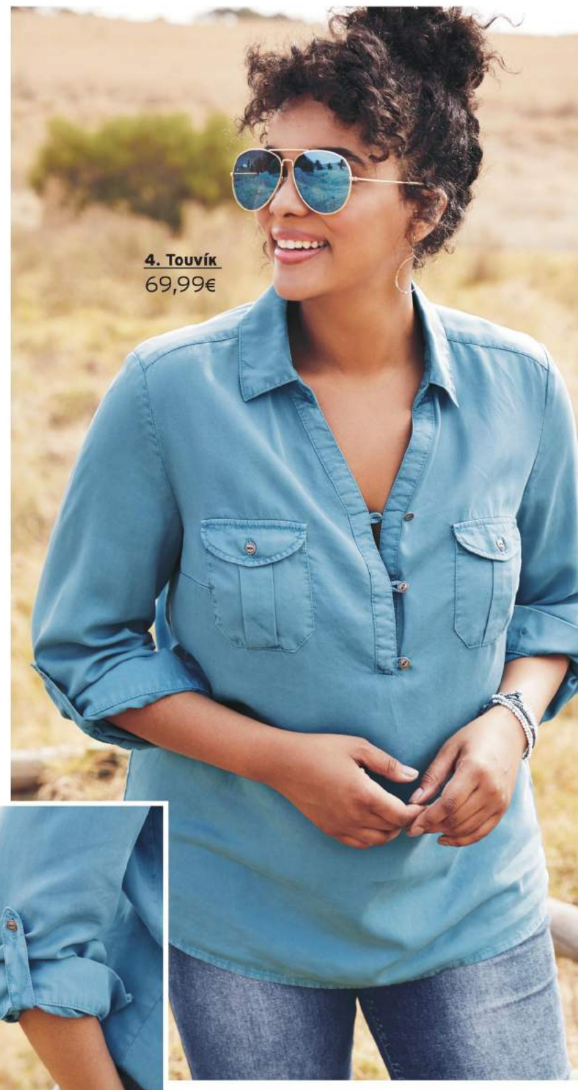
4. Τουνίκ 69,99€