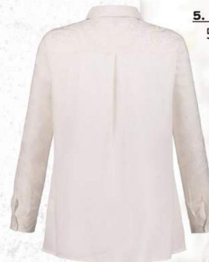
5. Πουκάμισο 54,99€