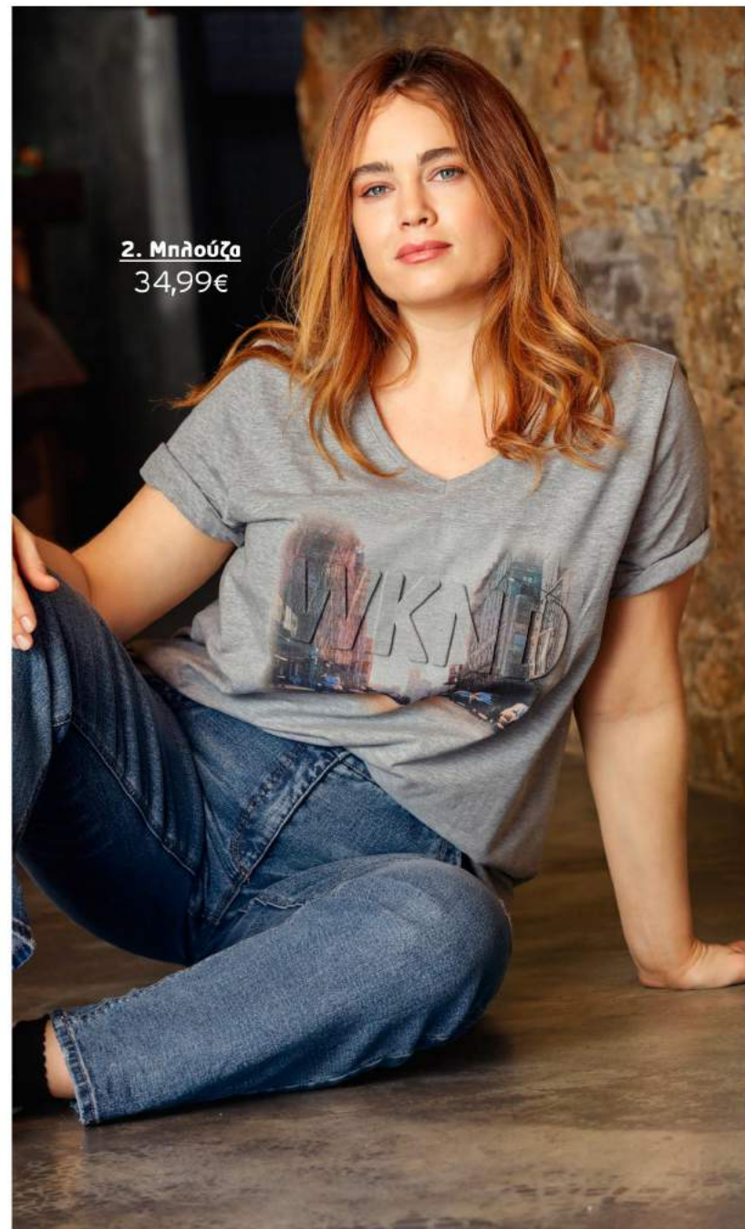
2. Μπλούζα 34,99€