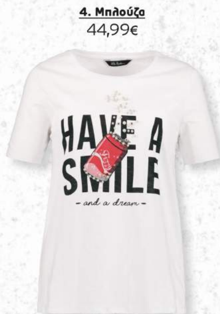
4. Μηλούζα 44,99€