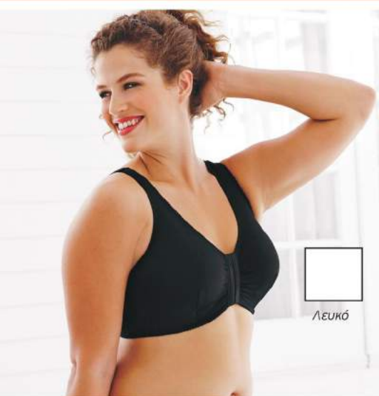
2. Μπουστάκι 22,99€

1 Σουτιέν Kelly χωρίς μπανέλες, με ρυθμιζόμενες τράντες, διακοσμημένο με στρας. Ιδανικό για μεγάλα μεγέθη. 75% Polyamid, 15% Cotton, 5% Polyester, 5% Elasthan. Πλύσιμο στο χέρι. Μεγέθη: CUP D: 85, 90, 95, 100, 105, 110, 115, 120, 125, 130 642 731 10 Μαύρο Μεγέθη: CUP E: 85, 90, 95, 100, 105, 110, 115, 120, 125, 130 642 732 10 Μαύρο Μεγέθη: CUP C: 85, 90, 95, 100, 105, 110, 115, 120, 125, 130 658 495 10 Μαύρο 34,99€