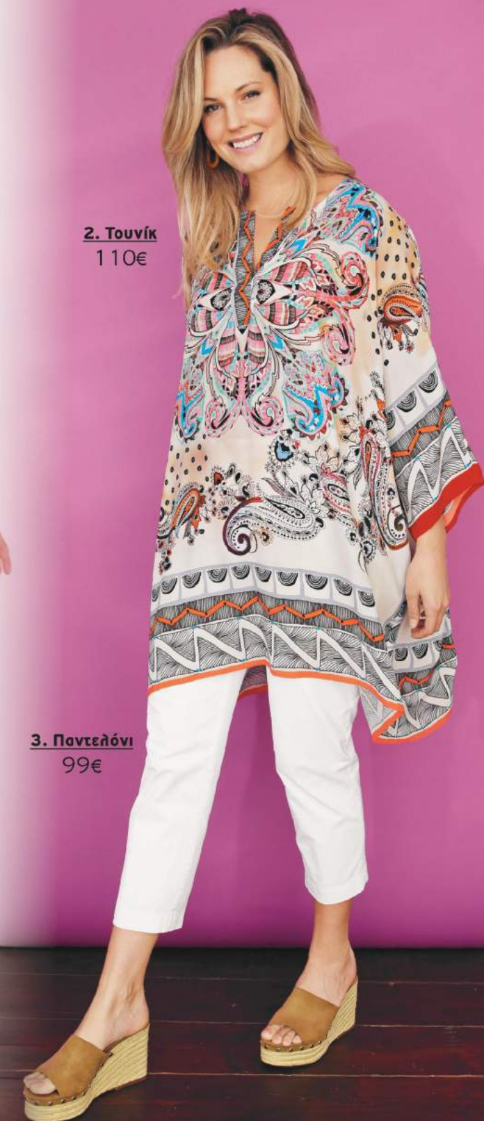
2. Τουνίκ 110€