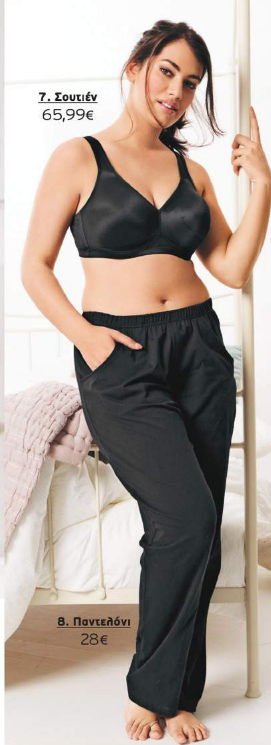
7. Σουτιέν 65,99€