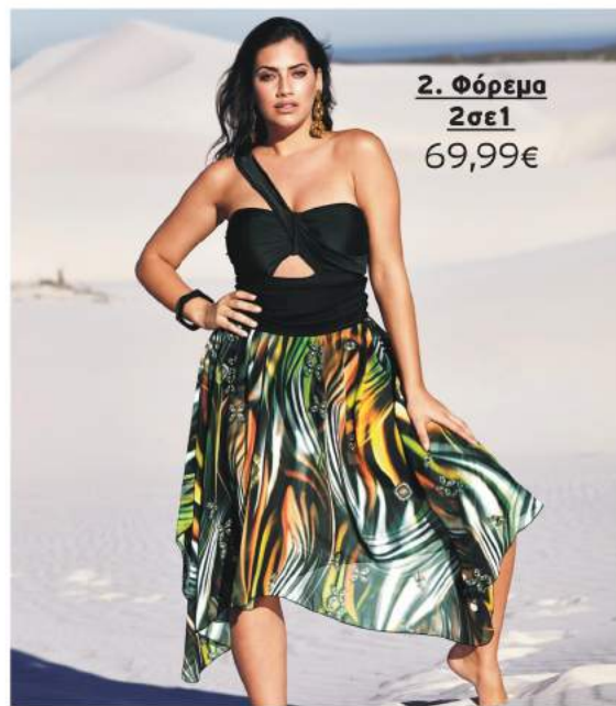
2. Φόρεμα 2σε1 69,99€