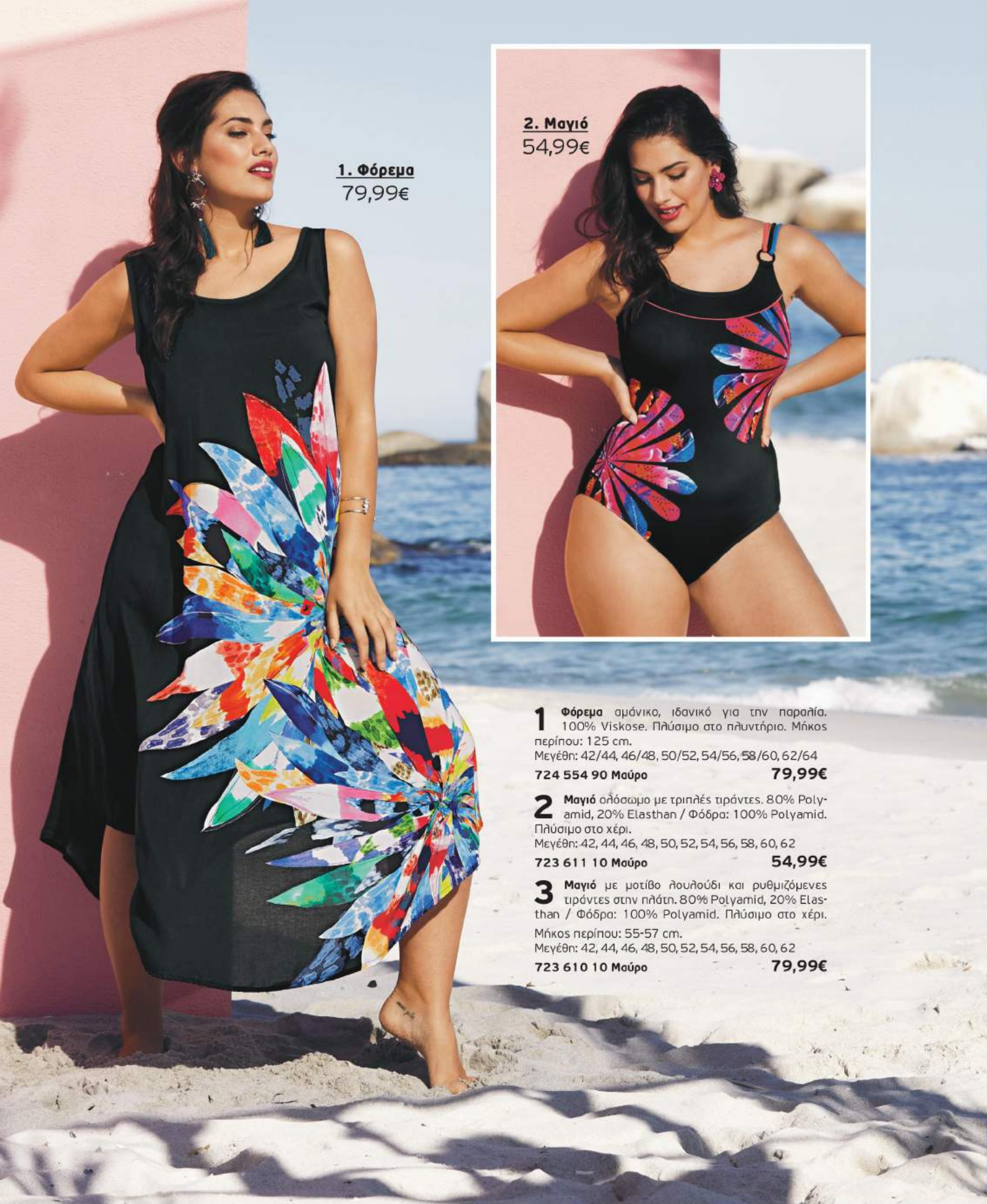
1. Φόρεμα 79,99€