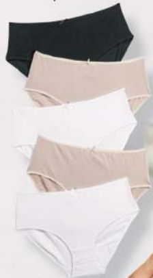
4. Σλιπ 5τμχ 34,99€