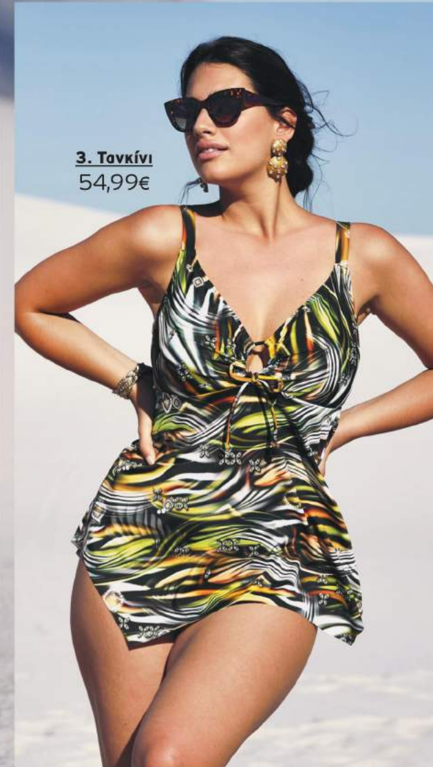
3. Τανκίνι 54,99€