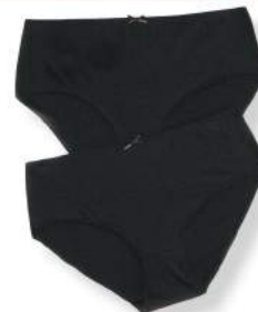
9. Σλιπ 2τμχ 14,99€

11 Σλιπ 2 τεμάχια. 82% Polyamid, 18% Elasthan. Πλύσιμο στο πλυντήριο. Μεγέθη: 42/44, 46/48, 50/52, 54/56, 58/60 644 695 10 Μαύρο 22,99€