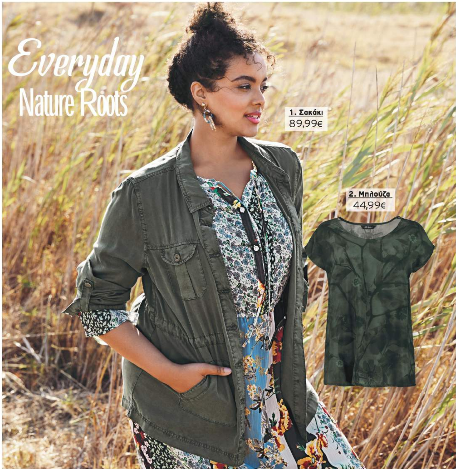
1. Σακάκι 89,99€