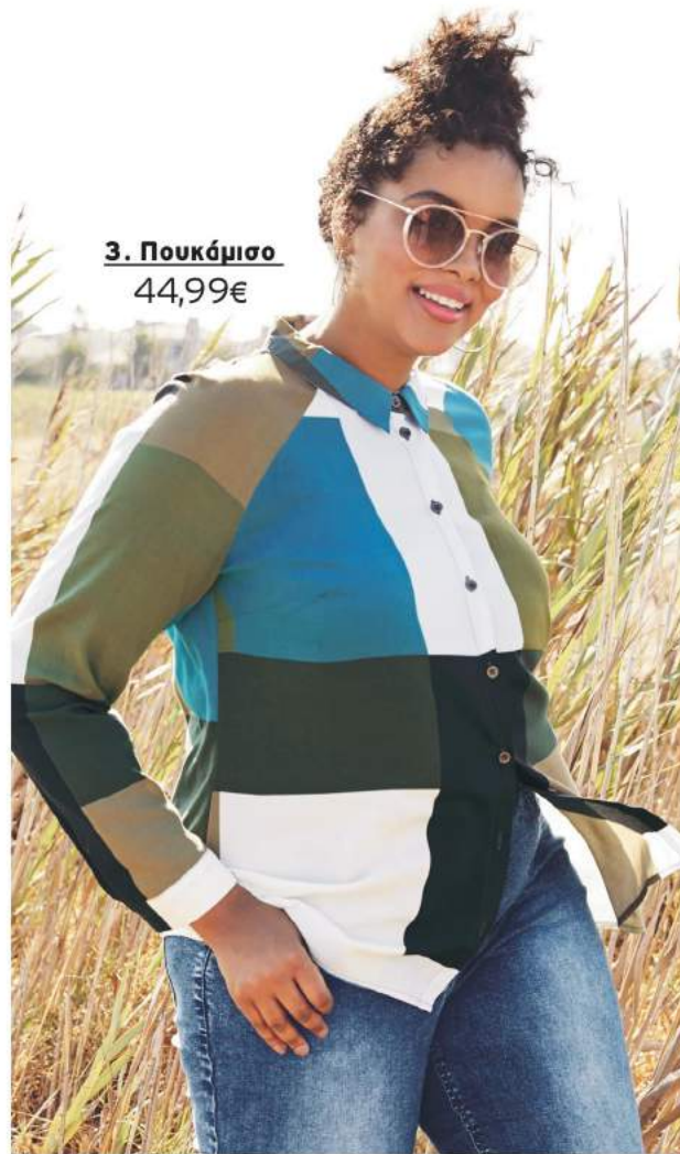
3. Πουκάμισο 44,99€