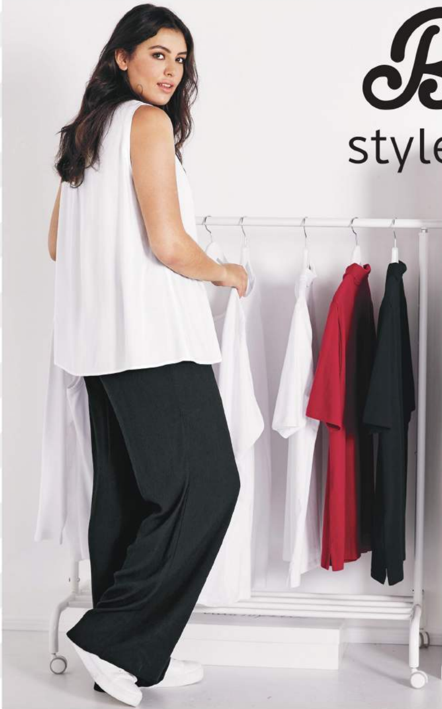
1. Πουκάμισο - γιακάς 17,99€