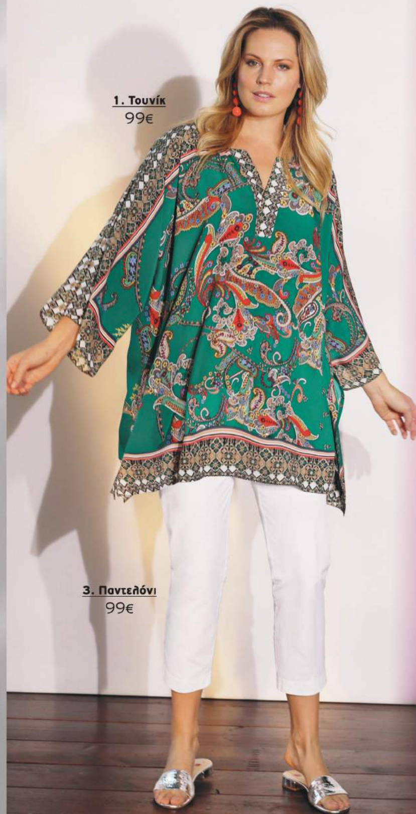
1. Τουνίκ 99€

Μεγέθη: 42, 44, 46, 48, 50, 52, 54, 56, 58, 60 660 046 20 Λευκό 99€