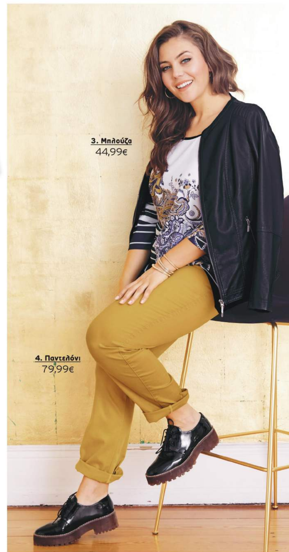
4. Παντελόνι 79,99€