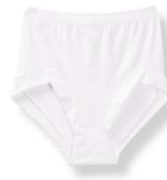
10. Σλιπ 12,99€