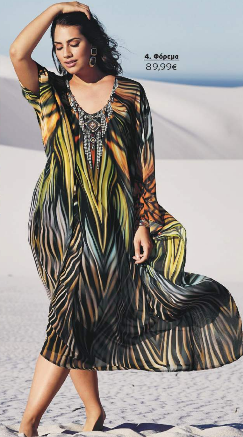
4. Φόρεμα 89,99€