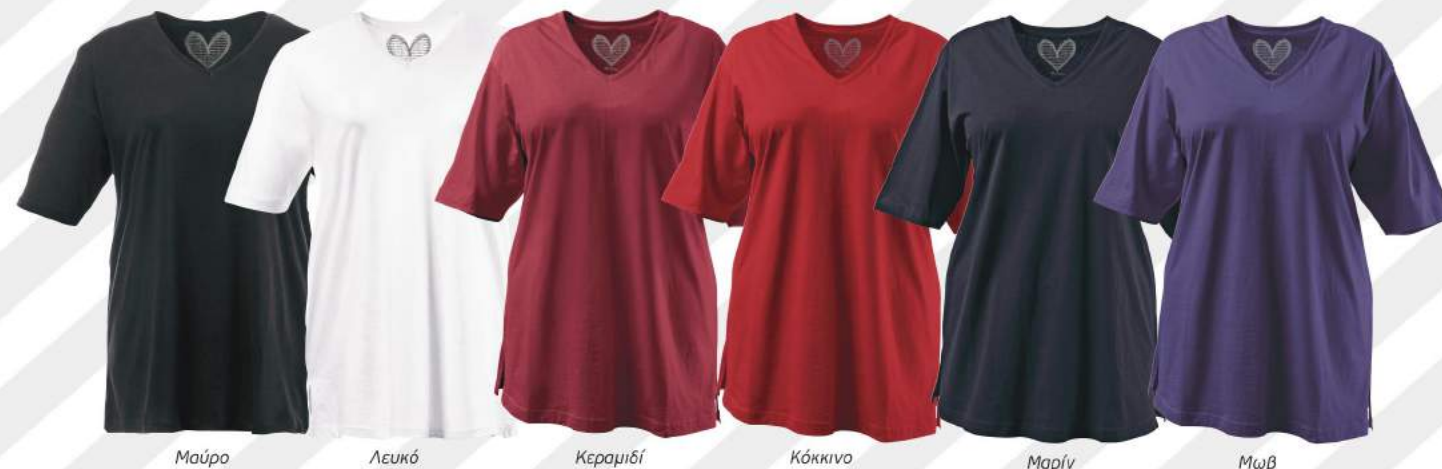
2. Μπλούζα 15,99€