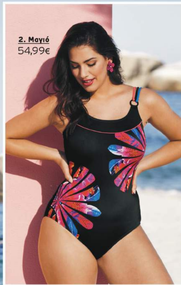
2. Μαγιό 54,99€

1 Φόρεμα αμάνικο, ιδανικό για την παραλία. 100% Viskose. Πλύσιμο στο πλυντήριο. Μήκος περίπου: 125 cm. Μεγέθη: 42/44, 46/48, 50/52, 54/56, 58/60, 62/64 724 554 90 Μαύρο 79,99€