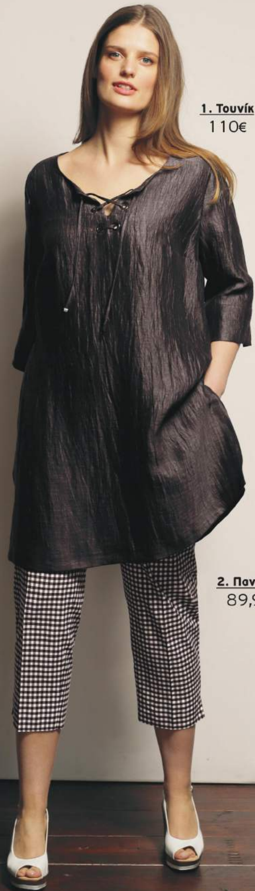
1. Τουνίκ 110€