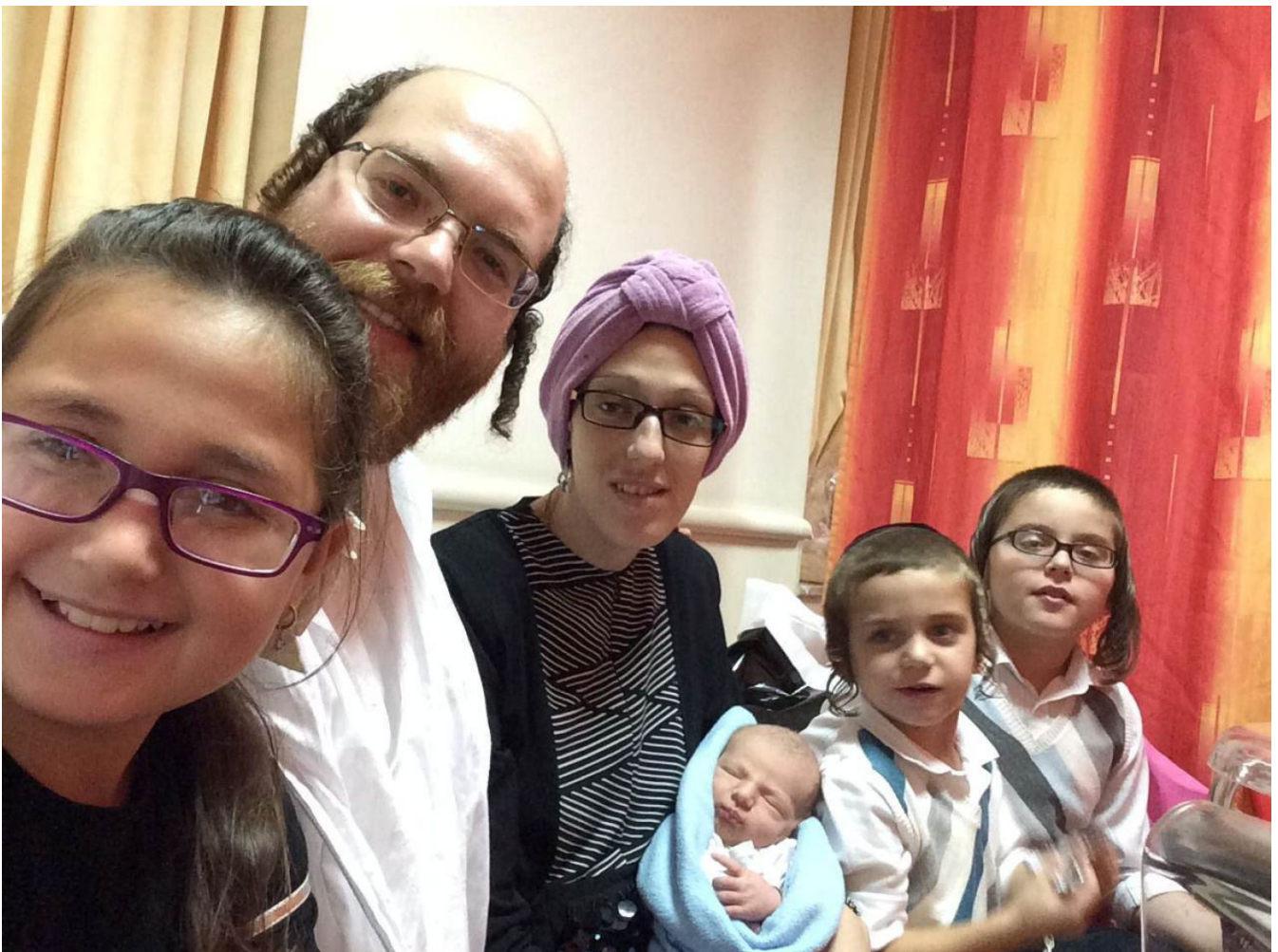
משפחת הלר לפני כשנה. מעיניהם של חברי הקהילה לא נעלם כל שינוי מזערי בסגנון החולצה

יום אחד, כשהיה בגיל בר־מצווה בערך, ראה הלר איש שקפץ אל מותו באתר בנייה ליד הבית. "התחלתי לחשוב על המוות. שאלתי את עצמי למה בן אדם רוצה למות. למה בן אדם חי. כחרדי התשובות מאוד ברורות, אבל לי היו המון מחשבות. על העולם הבא. מלמדים אותך שהחילונים הם זבל, חדלי אישים, ופתאום אתה מבין שלכל אחד יש נשמה".