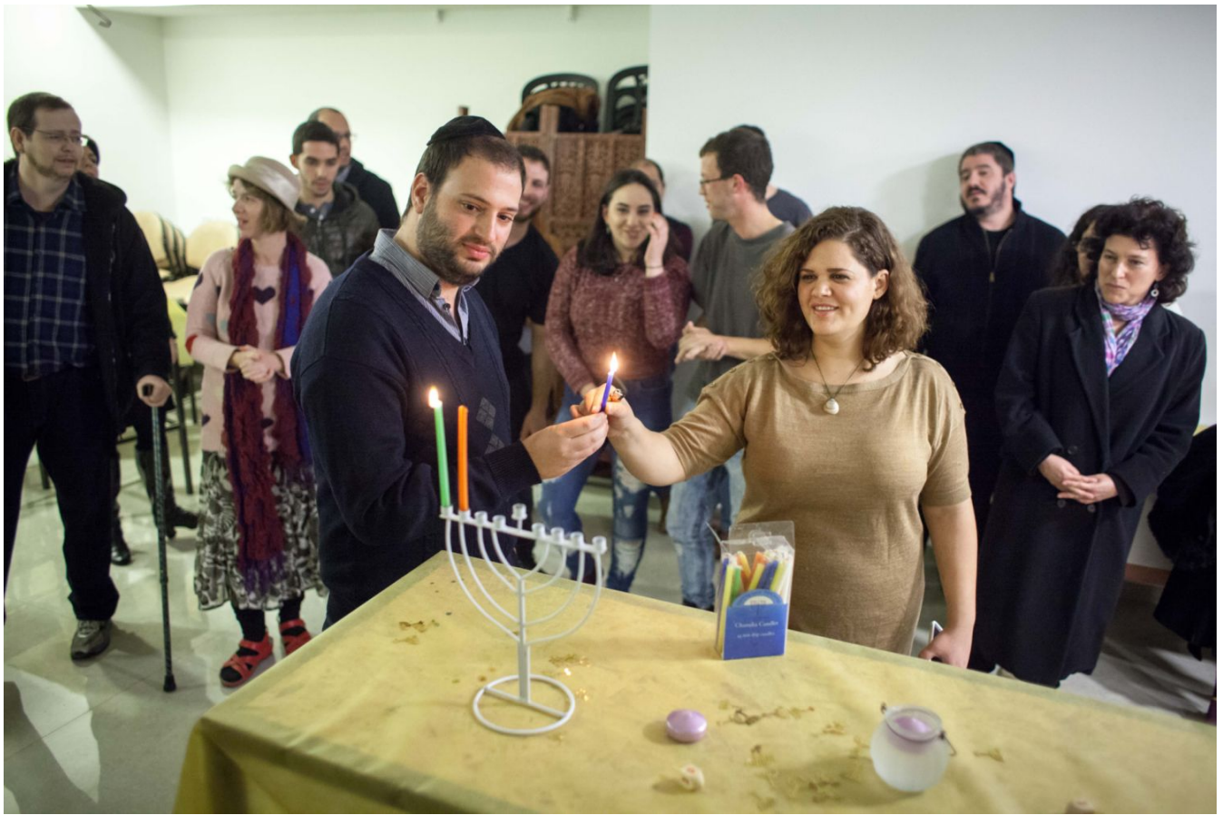
הדלקת נר חנוכה במפגש של "מיתרים" בירושלים. החברים נמצאים בשלבים שונים של עזיבת החברה החרדית

נאור מציע למי שחי בקונפליקט להשהות את ההחלטה. למצוא פתרונות. לשוחח עם האשה ולעשות את הצעדים שלו בשיתוף פעולה איתה. משם מתחיל המסע. "ובחרת" בקשר עם כל קשת העוזבים, וביניהם אנוסים (חרדים לא מאמינים שנשארים בחברה) שהם, כדבריו, "אנשים שהם ברוב המוחלט מסלתה ומשמנה של הקהילה, רבנים, ראשי ישיבות, מגידי שיעור, עסקנים בכירים ואנשי תקשורת שלא יכולים לבטא איזשהו פקפוק בעמדה הרשמית, כי המעמד שלהם יירד".