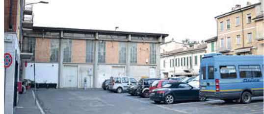
L'attuale Parcheggio di Piazza Italia

mediante opere di consolidamento statico e miglioramento sismico Investimento complessivo: 1 milione e 215.000 euro (1.160.000 euro con contributo statale e per 55.000 euro con risorse comunali.