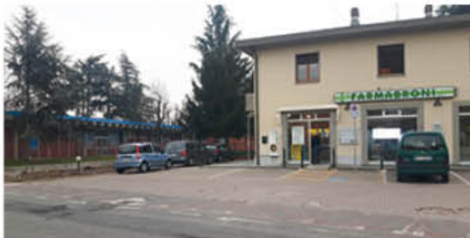
Il parcheggio della Farma Broni