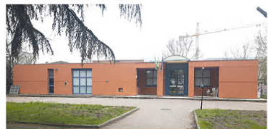
La scuola materna Andersen