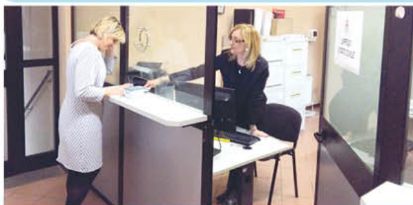
Lo sportello dove viene effettuata la richiesta per la nuova carta d'identità elettronica

Questo passaggio permetterà al Comune di ricevere un contributo dal Ministero per la Semplicazione di 2.000 euro.