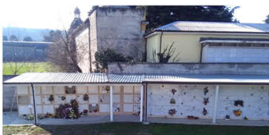
Alcuni dei nuovi loculi realizzati al Cimitero

• MESSA A NORMA DELL'ARCHIVIO DEL PALAZZO MUNICIPALE (installazione porte antincendio, revisione e manutenzione impianti elettrici ed antincendio, posa segnalatori di fumo) – Investimento complessivo € 15.000.