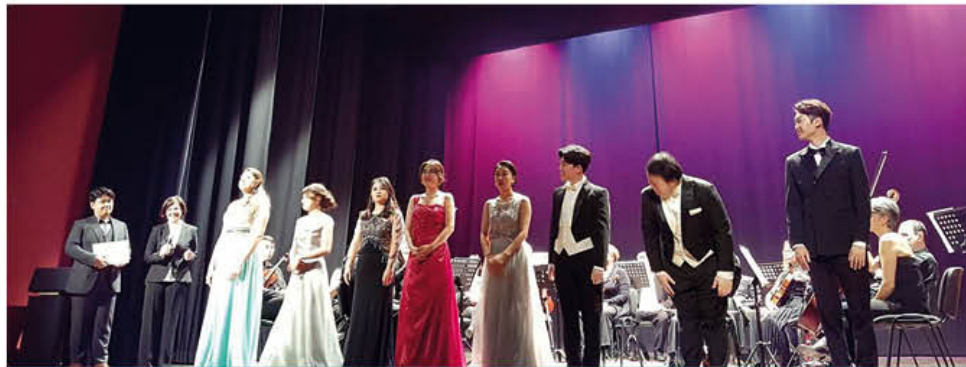
Un momento del concerto al Carbonetti

"E' stata un'importante occasione per far conoscere due prodotti d'eccellenza della cultura italiana che sono il melodramma e il