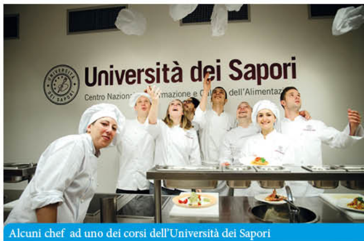
Alcuni chef ad uno dei corsi dell'Università dei Sapori

A settembre l'avvio ufficiale delle attività