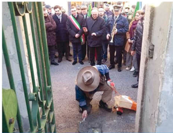
Gunter Demnig posa la pietra d'inciampo in via Emanuelli

La pietra non ha solo la funzione di preservare la memoria delle deportazioni, ma va oltre, rappresentando metaforicamente un invito alla riflessione, al dare il giusto valore al ricordo e alla memoria, obbligandoci a riflettere e a ricordare l'Olocausto, le deportazioni, l'intolleranza, perché simili scempi non si ripetano mai più.