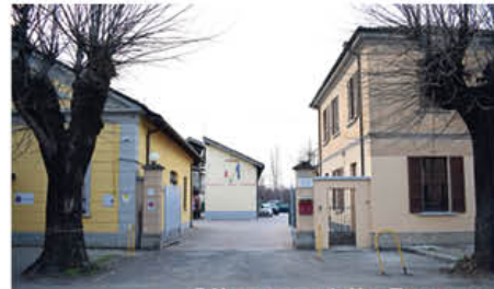
L'ingresso della Caserma dei Vigili del Fuoco