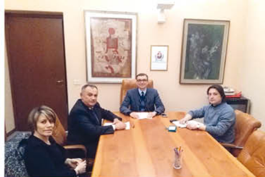
La presentazione dello Sportello amianto

Comune di Broni, tra i fondatori della sezione locale di Aiea, che si occuperà di fare da collegamento tra le Associazioni coinvolte nel progetto e il Comune. Lo sportello, che si avvale della prestazione gratuita dei componenti delle Associazioni partner dell'iniziativa e del supporto della struttura comunale, è aperto ogni sabato mattina dalle 10 alle 12, e il mercoledì pomeriggio su appuntamento (tel. 0385 257011 e attendere in linea senza digitare nessun numero), al secondo piano del palazzo comunale. Gli addetti forniscono gratuitamente ai cittadini un servizio informativo rispetto a vari argomenti riguardanti l'amianto, tra cui: l'assistenza giuridica in materia, aggiornamenti sui benefici contributivi e agevolazioni per