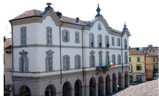
Palazzo Arienti, sede del Comune