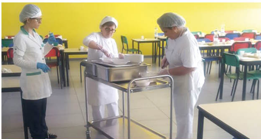
Le operatrici del centro cottura

di concerto con l'Amministrazione comunale, è stata l'istituzione in loco della figura del 'Responsabile del Servizio Mensa', incaricato giornalmente di verificare la qualità e la quantità del cibo servito e garantire il corretto svolgimento del servizio presso i vari plessi scolastici della Città. Nel frattempo, continua l'opera di controllo qualità dell'Amministrazione del servizio di ristorazione scolastica tramite le attività della commissione mensa, le visite in mensa dell'Assessore durante l'orario di servizio e la collaborazione con il personale della società che gestisce il servizio, i docenti ed il personale scolastico.