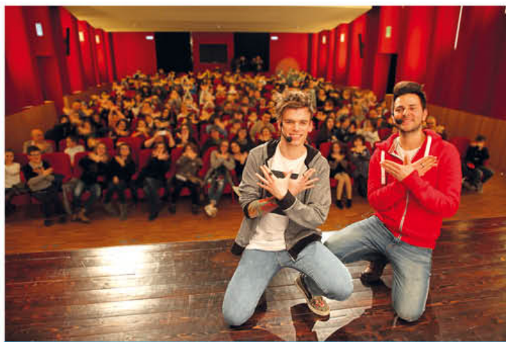
I Pantellas al Carbonetti

della rassegna Di.Domenica, si è aperto ai più giovani e alle famiglie, divenendo la casa di tutti, dove ognuno può trovare le proposte che più si addicono ai propri gusti e alle diverse età della propria vita.