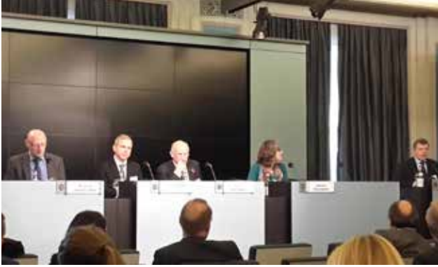
EUROLAB Genel Kurulu 2014 Nisan