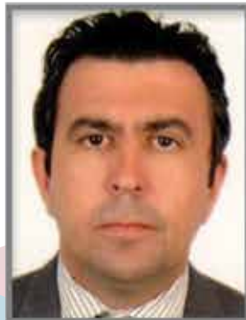
Can COŞKUN Den. Kurulu Yedek Üyesi