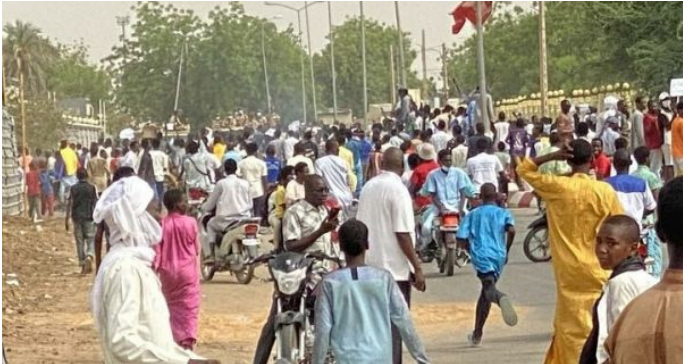
Les manifestants à N'Djabel

Nous avons déjà relaté dans un précédent numéro les événements récents au Mali. Nous traiterons ici de la situation au Tchad, un pays d'Afrique centrale situé au sud de la Libye. Nous ne parlons pas de ces pays par hasard, mais parce que l'impérialisme français - à travers ses grands monopoles économiques, son armée et beaucoup d'autres artifices - y est le principal pourvoyeur de misère et de malheur. En tant que journal démocratique et révolutionnaire basé en France, il est plus que capital pour nous de montrer la réalité de l'impérialisme français, notamment en Afrique, ainsi que de mettre en avant les luttes des peuples en Afrique contre le système de vol organisé qui sévit dans leurs pays. Nous devons saisir que des franges de plus en plus larges des masses du continent africain entrent en lutte prolongée contre les vieux Etats impérialistes et leurs serviteurs corrompus à leur service, les Etats locaux, et que ce processus va se développer toujours plus, dans le cadre de l'offensive de la Révolution Proletarienne Mondiale qui gronde.