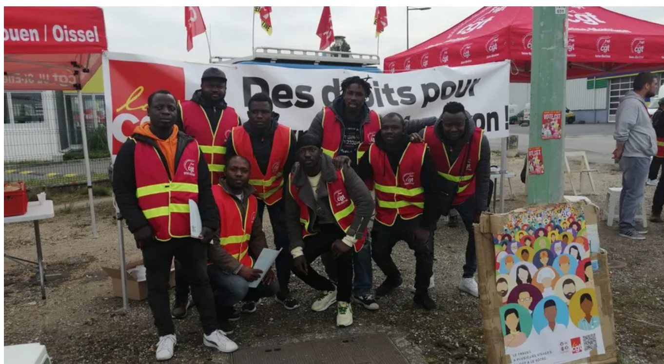
Les travailleurs en lutte de Saint-Etienne du Rouvray

Ils mènent donc une lutte pour recevoir dignement leurs salaires dûs et pour dénoncer les conditions de travail exécrables dans lesquels sont mis les travailleurs du site : horaires légaux complètement dépassés, livraisons jusqu'à une heure du matin, jours de travail trop élevés... Ils parlent même d'«esclavage bien organisé» . ■