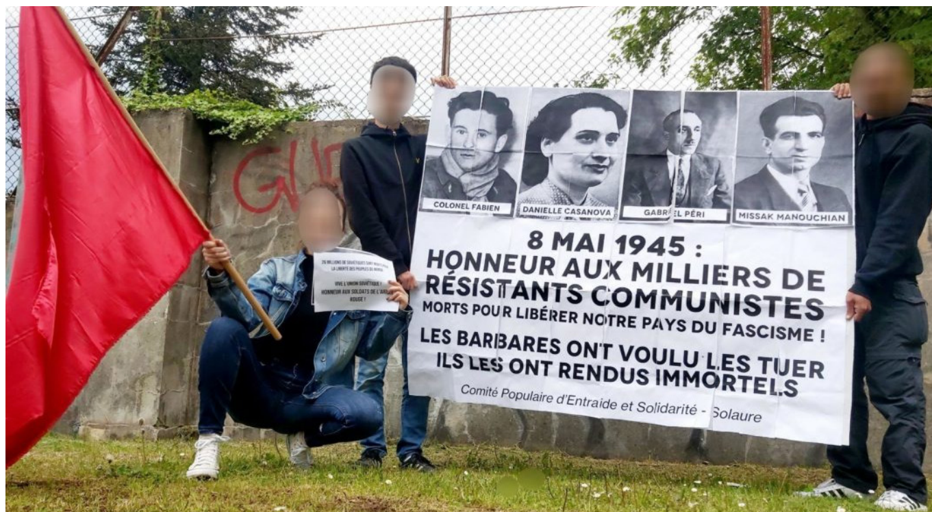
Une action menée à Saint-Etienne dans le quartier de Solaure par le CPES. L'affiche a ensuite été collée sur un point de passage du quartier

La lutte âpre qui se déroule pour que le prolétariat se transforme de classe en soi en classe pour soi se mène sur tous les terrains, et notamment l'Histoire. La bataille pour l'Histoire se trouve, comme tout, sur le terrain de la lutte des classes. La réaction cherche à tout prix à retirer tout contenu de classe des événements historiques pour les rendre conformes à sa vision des choses, c'est-à-dire nier la lutte des classes comme moteur de l'Histoire humaine. Pour cela, elle est prête à tronquer, à réécrire, à falsifier, à déformer la réalité des faits. La bourgeoisie est une classe qui va authentiquement contre la Vérité, entendue comme ce qui est conforme au réel. D'ailleurs, le gauchisme, et en premier plan le trotskysme, se révèle pleinement dans sa vision de l'Histoire comme un agent de la bourgeoisie niant lui aussi le réel.