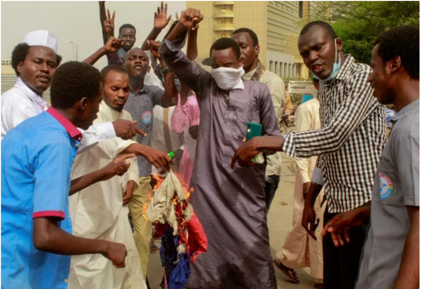
Des manifestants brûlent le drapeau de l'impérialisme français

En effet, au Mali comme au Tchad, la lutte contre l'impérialisme français se fait aujourd'hui sous des drapeaux réactionnaires, ceux de l'impérialisme russe et même parfois de l'impérialisme chinois ! Cependant il faut bien comprendre le fond des choses : aujourd'hui le plus important pour les peuples de ces pays est de combattre l'impérialisme français, impérialisme présent sur ces pays de manière hégémonique. C'est pour cela que le drapeau de l'impérialisme russe est parfois brandi, car les masses se tournent vers un impérialisme montant pour en déstabiliser un autre, en état de putréfaction avancée. De l'autre côté, ceux qui mènent actuellement la guerre d'agression sur l'Ukraine y trouvent leur compte : ils peuvent combattre l'influence française et gagner petit à petit de l'influence dans les pays d'Afrique, pour concurrencer les puissances impérialistes d'Europe de l'Ouest. Sur le moyen-long terme, tout cela est de bon augure pour les Russes, qui voient déjà les parts de marchés des pays ciblés être englouties par leurs monopoles économiques et se délectent par avance.