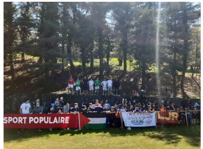
Diverses actions menées par les CPES à Lyon et Saint-Etienne ces derniers mois