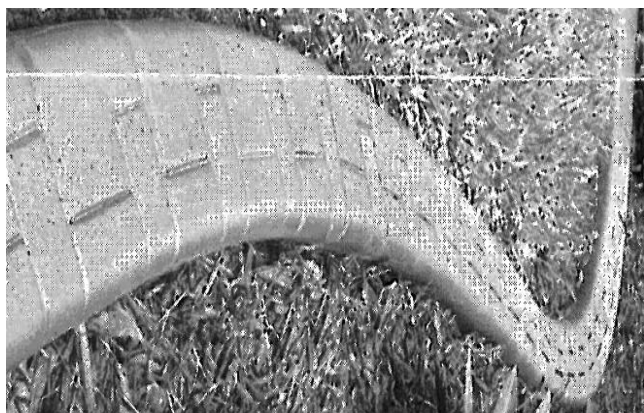
ΠΩΛΕΙΤΑΙ ΚΑΙΝΟΥΡΓΙΟ ΜΗΧΑΝΗΜΑ ΠΟΥ ΚΑΤΑΣΚΕΥΑΖΕΙ ΚΟΡΝΙΖΕΣ ΠΑ ΚΗΠΟΥΣ ΣΕ ΤΙΜΗ ΕΥΚΑΙΡΕΙΑΣ ΤΗΛ. 99543133

Εκδρομή. Η Συνεργατική Πιστωτική Εταιρεία Χλώρακας μέσα στα πλαίσια των συνεχών προσπαθειών της για αναβάθμιση της ευημερίας των κατοίκων της Χλώρακας, των μελών και πελατών της Εταιρείας, διοργάνωσε ψυχαγωγική εκδρομή στα Ελληνικά Νησιά Ρόδο και Καστελόριζο από 24 - 27 Ιουνίου με το νέο κρουαζιερόπλοιο Salamis - Filoxenia. Η κρουαζιέρα ηταν τριήμερη και επιδοτημένη από την Εταιρεία για μέλη - πελάτες προς 50 ευρώ το άτομο.