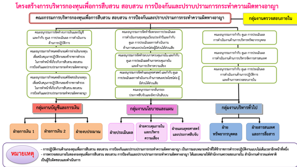
ภาพที่ ๑.๑ โครงสร้างการบริหารกองทุน

โครงสร้างกองทุนเพื่อการสืบสวน สอบสวน การป้องกันและปราบปรามการกระทำความผิดทางอาญา ดังภาพที่ ๑.๑