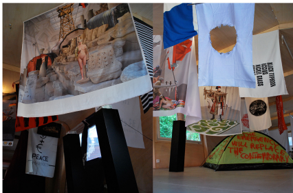
Pohľad do inštalácie výstavy The Kennedy Bunker