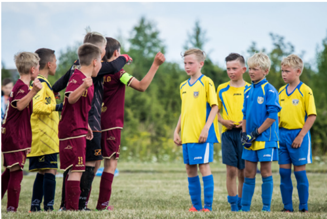
Noored jalgpallurid mängu alustamas.