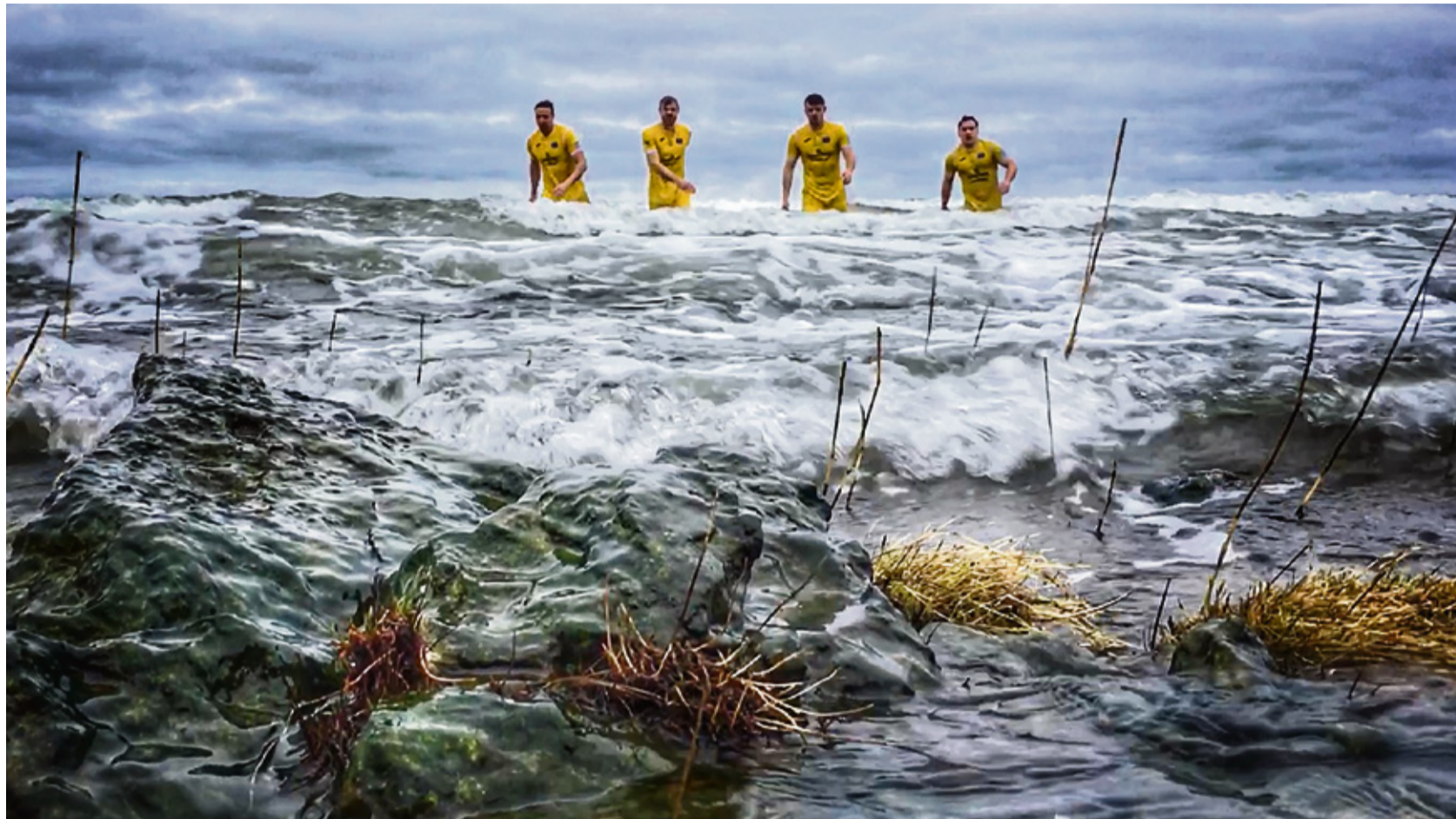
VIIKINGID: Ilma ja vastaseid trotsides on FC Kuressaare mehed valmis liikuma oma eesmärkide poole.