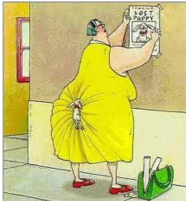
Zaginął mi Piesek

- Phi! Do jednego kłosa będę kombajn zapuszczać?