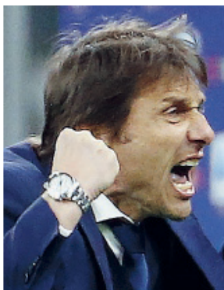
INSAZIABILE Antonio Conte

■ Nati come un onesto gioco di carte, con il tempo i tarocchi hanno assunto la funzione di predire il futuro, oggi diventata prevalente: una superstizione anticristiana. Ma le carte non possiedono capacità divinatorie: si limitano a rivelarci alcune verità sulla nostra natura umana. a pagina 17