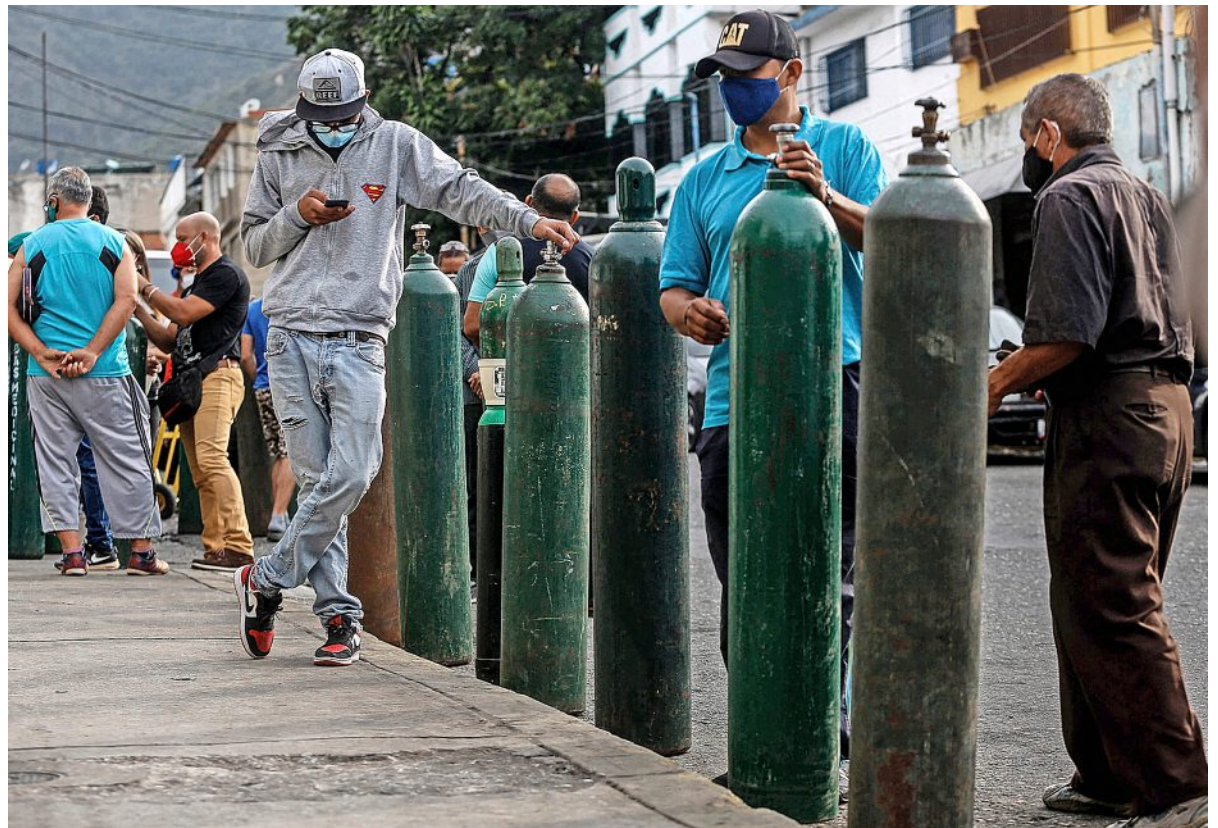
In fila per strada a Caracas, in attesa di farsi riempire di ossigeno la bombola.

LONDRA. Si chiama ossigeno, ma si legge anche "punto debole del sistema sanitario mondiale". Già, perché non si spiega altrimenti la penuria globale di una risorsa