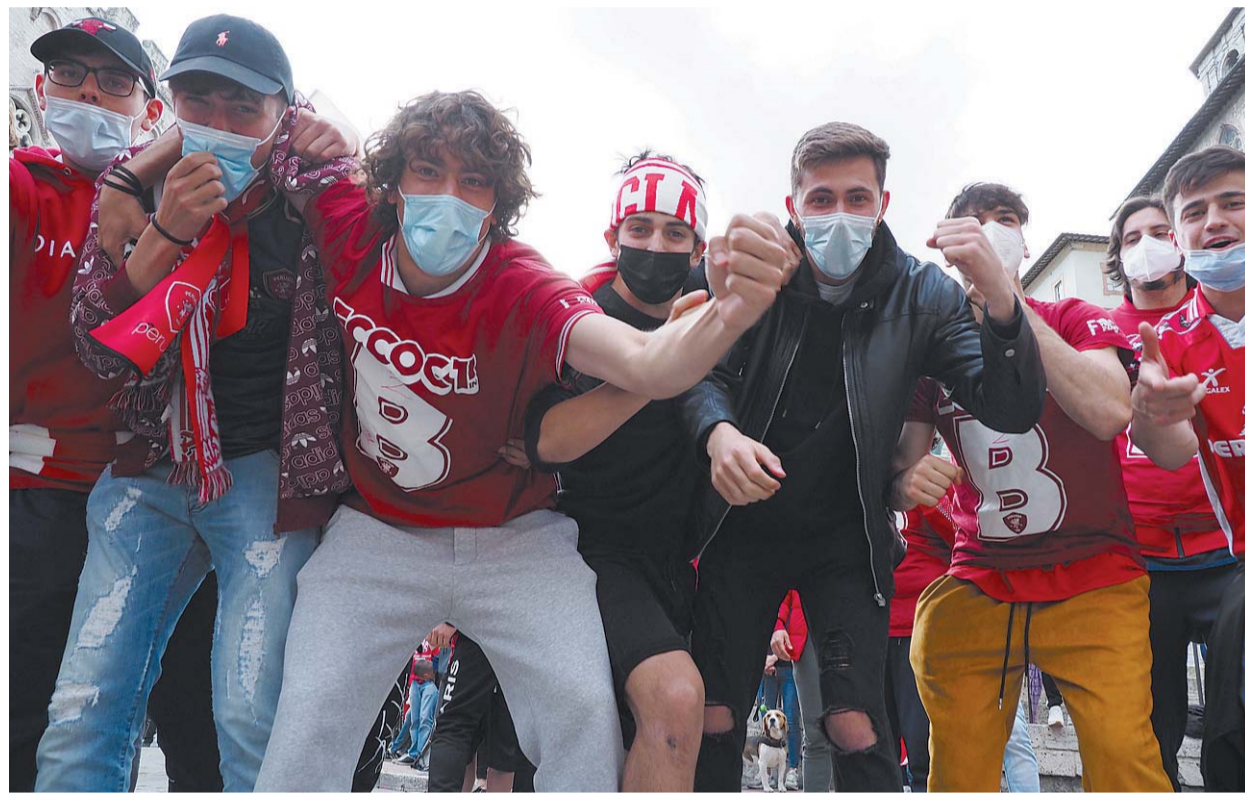
La gioia Tifosi in festa in piazza IV Novembre

→ alle pagine 9, 20, 21, 23, 25, 26 e 27 Uras, Mercadini, Cantarini e Fanelli