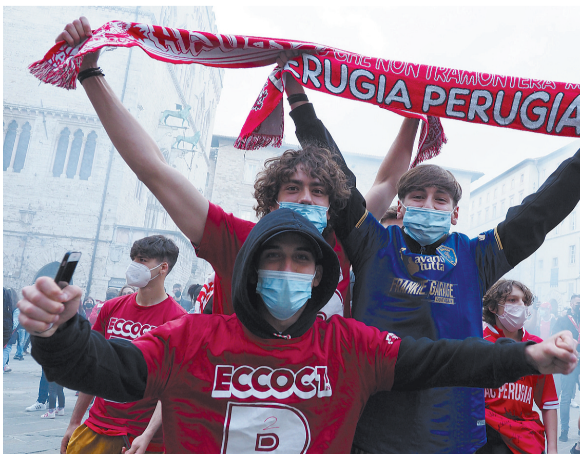
Gioia L'acropoli è stata invasa dal popolo biancorosso: cori, caroselli, fumogeni e fuochi d'artificio per festeggiare una domenica speciale. Pochi minuti dopo il fischio finale i tifosi si sono riversati in centro storico per celebrare il tanto agognato ritorno in serie B