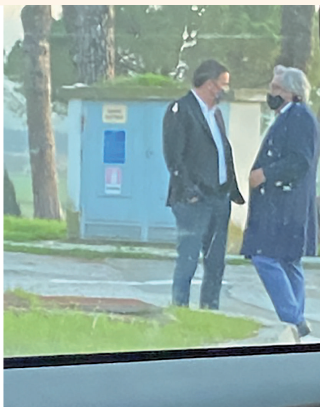
Stasera su Rai3 Matteo Renzi con l'agente Marco Mancini

■ Al mattino va in tv a chiedere che Conte molli la delega sui Servizi. Poi raggiunge in un piazzola di Fiano Romano il discusso dirigente del Dis: "Doveva darmi i Babbi Natale di cioccolato"