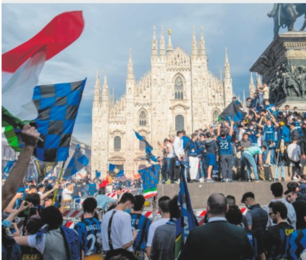
FOLLA (E FOLLIA) I tifosi interisti riversatisi in piazza Duomo a Milano per festeggiare lo scudetto

con Basile, De Carli, Signori e Visnadi da pagina 22 a pagina 25