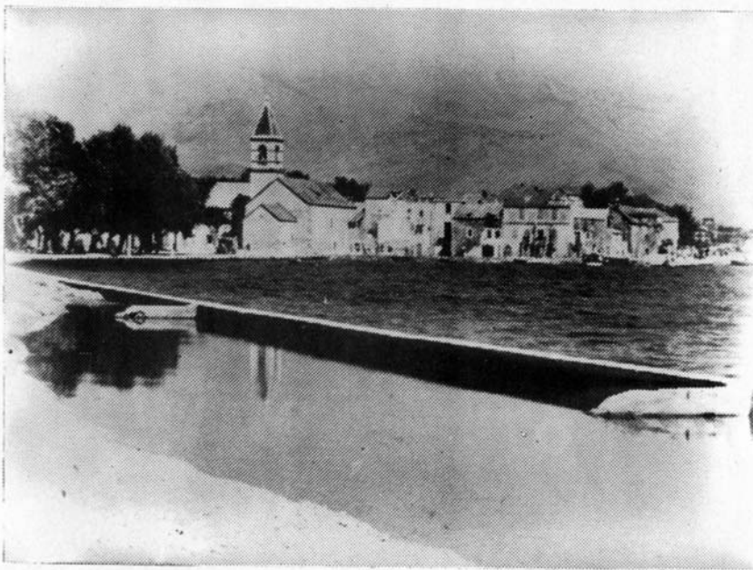
Pogled na crkvu sa jugozapada prije bombardiranja

Pokoj vječni daruj im Gospodine, pokoj, pokoj, pokoj, amen.