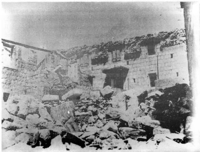
Pogled na ruševine kuća Ivana - Antona - Roka i Dominika Plepel

Ukapanje se obavljalo po nalogu djece, roditelja ili rođaka. Oni za koje se nitko nije zanimao, uglavnom su pokopani u obiteljskoj grobnici Antona i Kate Kovač, bračnog para bez bližnjih nasljednika koji su ranije pokopani u toj grobnici. Tu smo sahranili ukupno 32 mrtva tijela. Grobnicu smo zatvorili tvrdo vjerujući da se vjekovima neće otvarati.