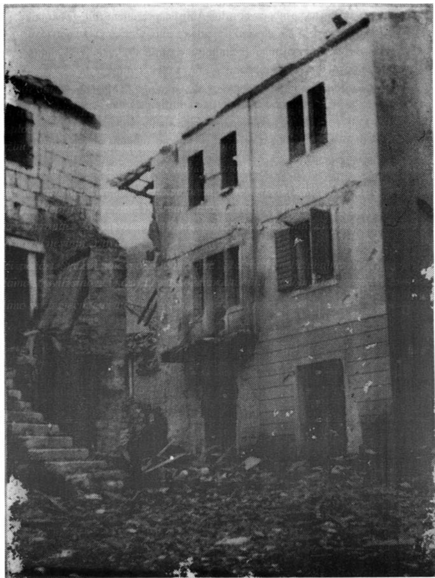
Kuća Antunović - pogled s Brda