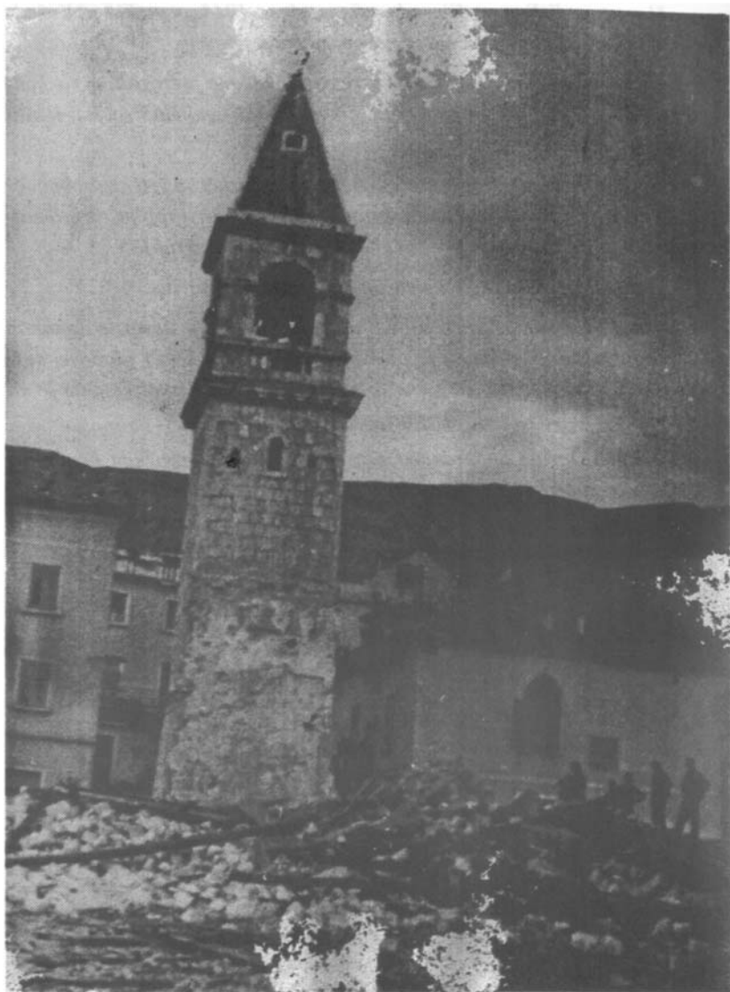
Pogled na ostatke crkve tijekom raščišćavanja ruševina.