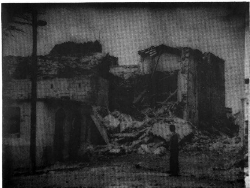
Pogled na peškariju