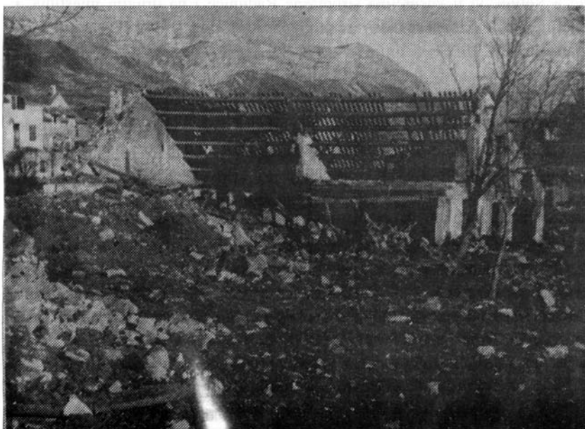
kuća Smodlaka - Alfirević (današnji Bobis)