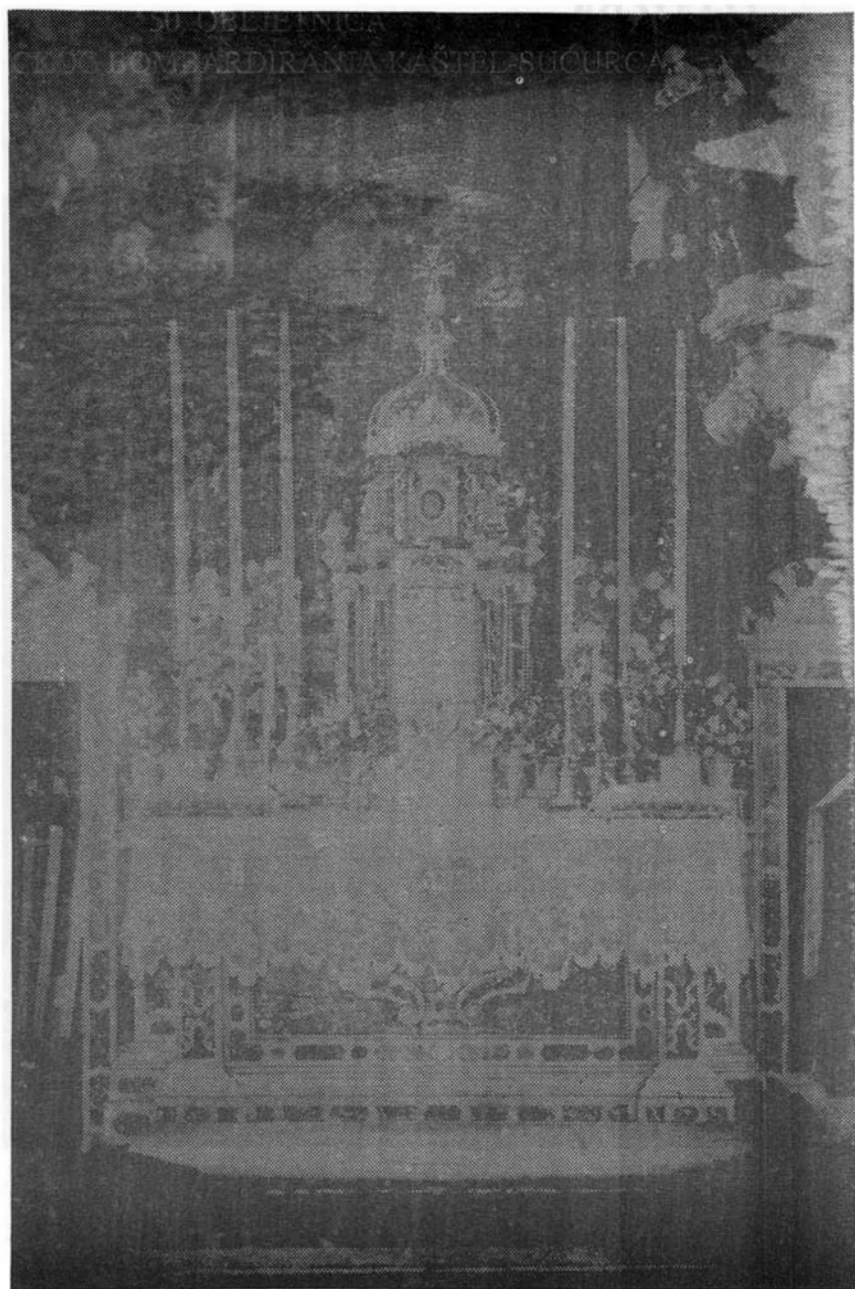
Glavni oltar bombardirane crkve