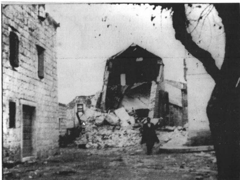
Pogled na kuću Alfirević (Brnčevi)