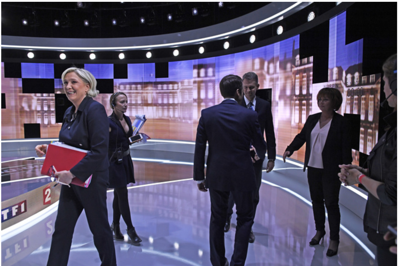
Marine Le Pen le soir du débat d'entre-deux-tours face à Emmanuel Macron, le 3 mai 2017.

J'avais fait la fiche sur la loi El Khomri, tout était là, et elle se plante, elle confond la loi El Khomri et la loi Macron. Il lui dit « ce n'est pas du tout la même loi », et elle répond « oui la loi El-Khomri-Macron, c'est pareil ! ». Et sur SFR aussi elle se trompe [ en confondant avec le dossier de la vente d'Alstom – ndlr ]. Elle avait les éléments pour répondre, mais elle ne les avait pas consultés avant, ce qui est assez problématique.