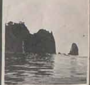
Seydi (Hıranca)

"SAHİPSİZ MEMLEKETİN BATMASI HAKTIR. SEN SAHİP OLURSAN ABANA'N BATMAYACAKTIR." Behçet Kemal Çağlar