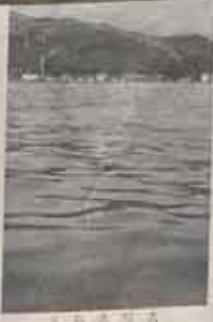
A. P. A. S. A.