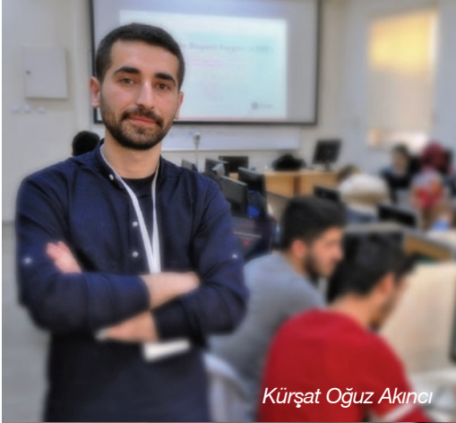
Kürşat Oğuz Akıncı