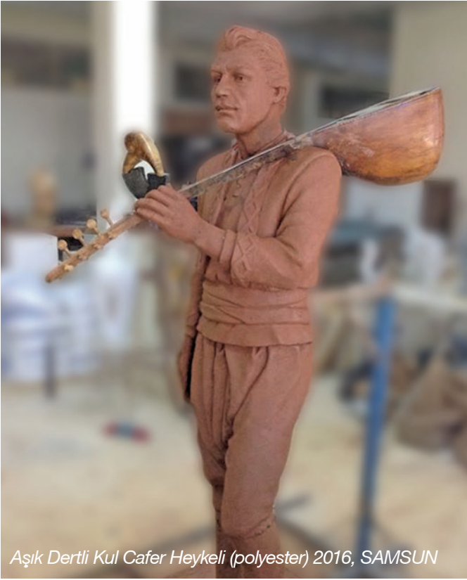
Aşık Dertli Kul Cafer Heykeli (polyester) 2016, SAMSUN