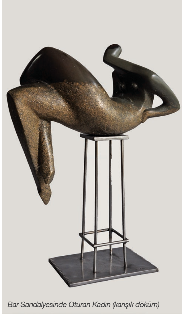
Bar Sandalyesinde Oturan Kadın (karşık döküm)

Ressam Özdemir Yemenicioğlu'nun öğrencisiydim ben. Beni üniversiteye o hazırladı. Hayatımda örnek aldığım ilk ve en önemli insan diyebilirim. Gerçekten denge taşı benim hayatımda. Tam anlamıyla işi gibi yaşayan bir insan. Aslında öyle olmak gerekiyor. Dünyaya bakış açısı, kendi işine bakış açısı, resmini yaptığı fırçaya dokunmuş biçimi, resmi bittiğinde ona bağlamayla şarkılar ve metiyeler düzmesi, onu hayatının önemli bir yerine koyması, olaylara bakış açısı, yolda ayağının altında karınca gördüğünde onu alıp uygun yere bırakması... İşte böyle yaşayan insanların yanında sanatı öğrenmek gerekiyor.