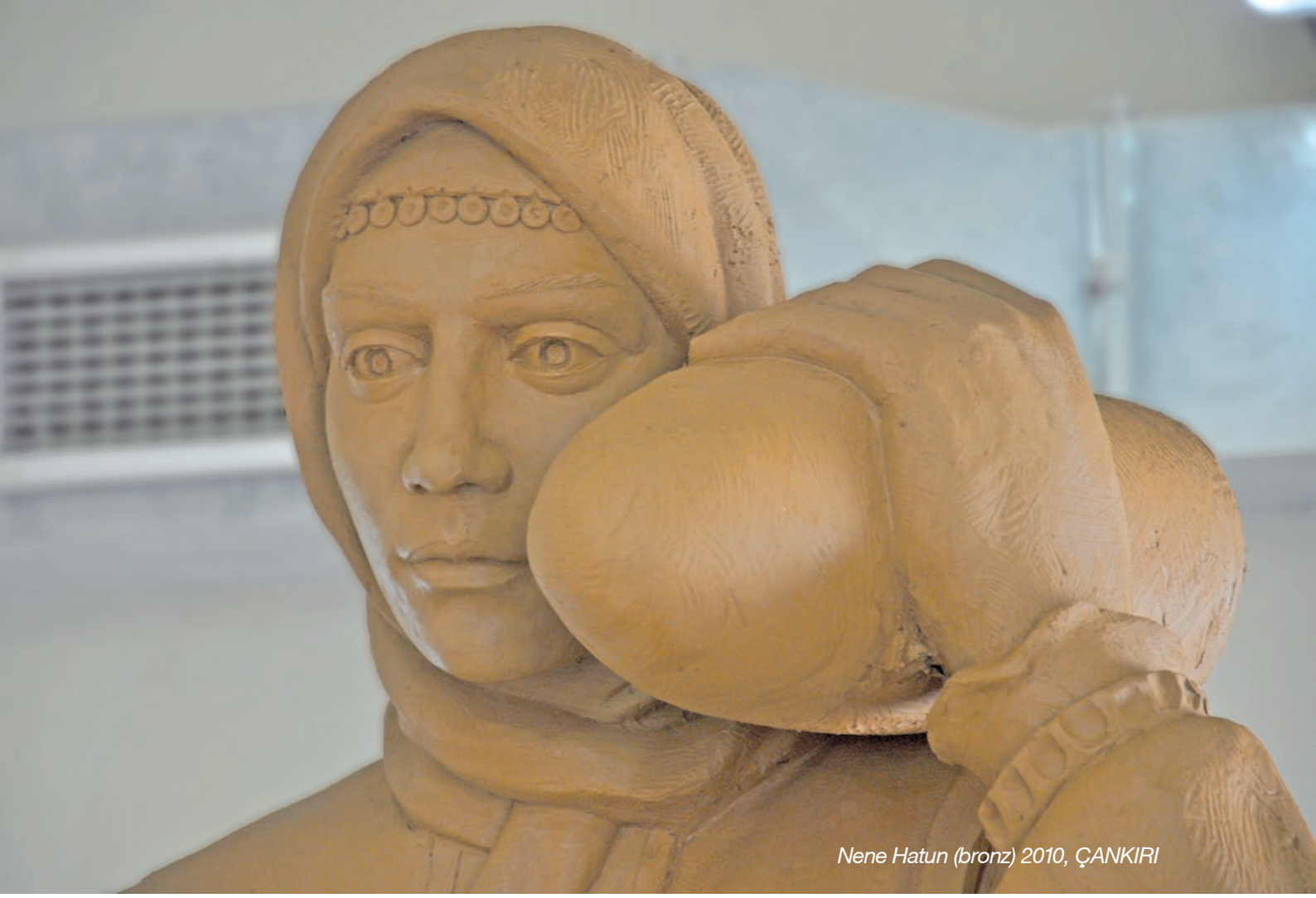
Nene Hatun (bronz) 2010, ÇANKIRI

Çocukların daha küçük yaşlarda daha doğru yönlendirilmesi lazım ki daha fazla düşünen bireyler olarak üretsinler ve yeni şeyler ortaya çıkarsınlar.