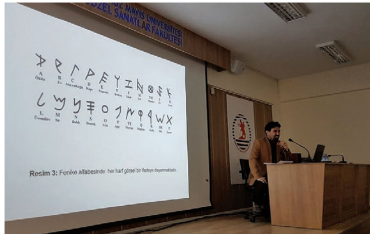
Resim 3: Fenike alfabesinde her harf görsel bir fiyeye dayanmaktadır.