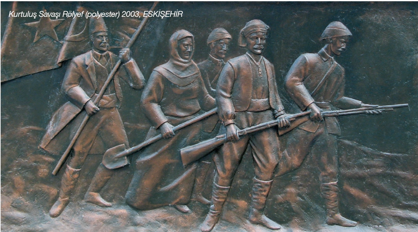
Kurtuluş Savaşı Rölyef (polyester) 2003, ESKİŞEHİR

“Heykelde pek çok farklı teknik uygulamaya çalışıyorum ki denenmemiş şeyleri de denemiş olayım.”