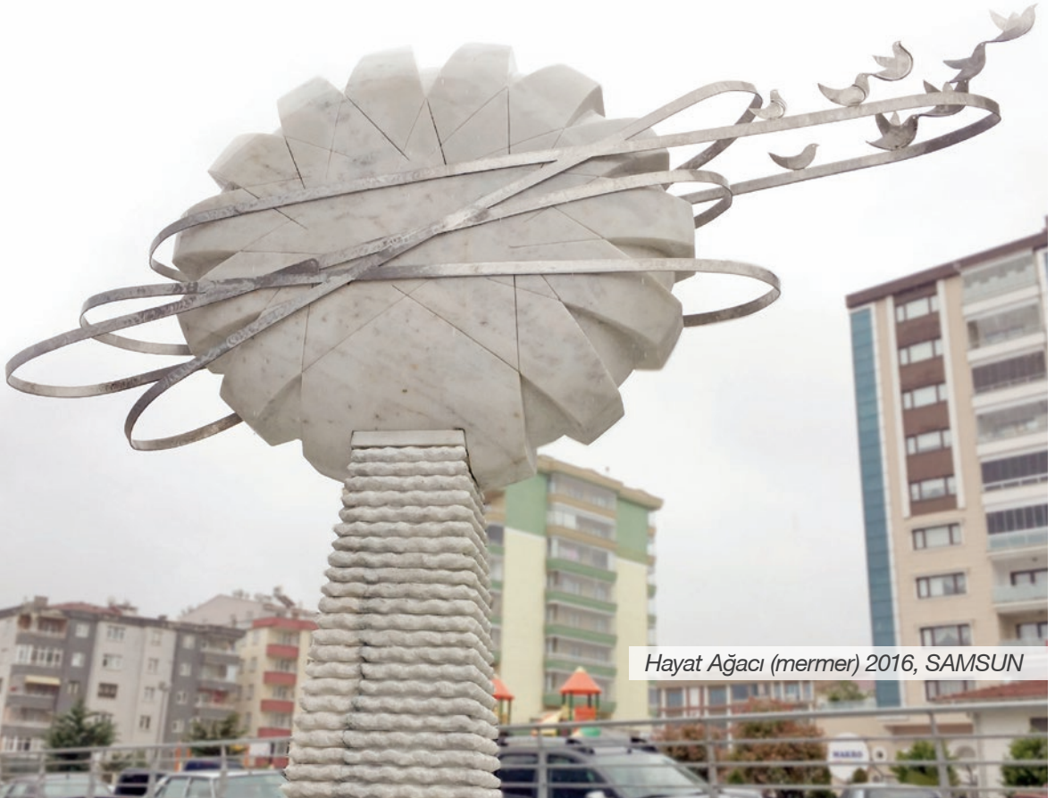
Hayat Ağacı (mermer) 2016, SAMSUN