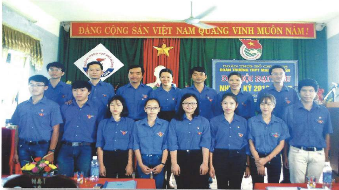
Ban chấp hành Đoàn trường THPT Mai Anh Tuấn