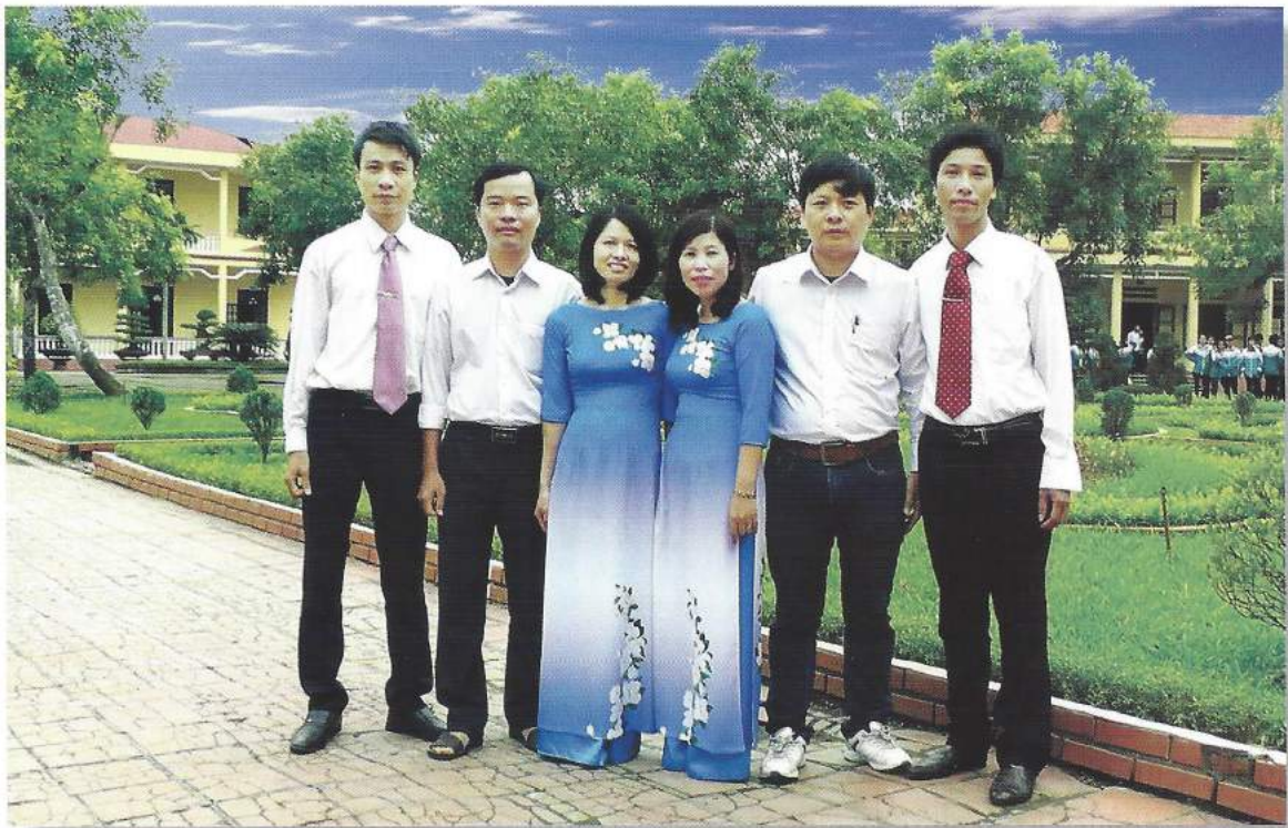
TRƯỜNG THPT MAI ANH TUẤN