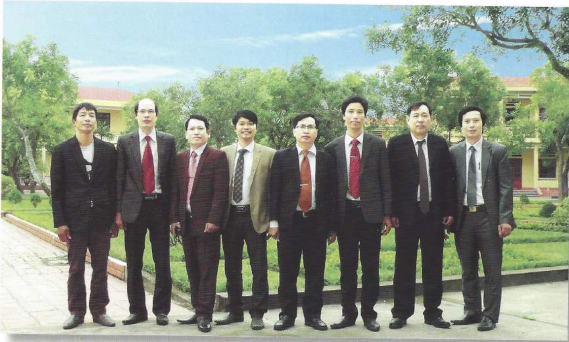
Ban chấp hành Đảng bộ nhiệm kỳ 2015 - 2020

của các cấp ủy Đảng. Đảng bộ cũng đã triển khai có hiệu quả thiết thực các cuộc vận động các phong trào thi đua lớn như cuộc vận động “ Học tập và làm theo tấm gương đạo đức Hồ Chí Minh”, cuộc vận động “ Mỗi thầy cô giáo là một tấm gương đạo đức, tự học và sáng tạo ”, phong trào thi đua “ Hai tốt ”...