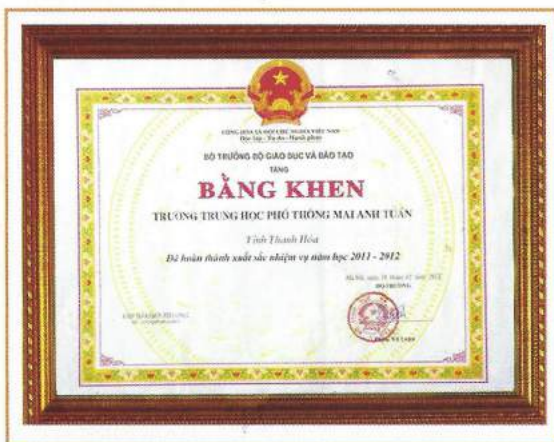
Bộ trưởng Bộ Giáo dục và đào tạo tặng Bằng khen đơn vị hoàn thành xuất sắc nhiệm vụ năm học 2011 - 2012