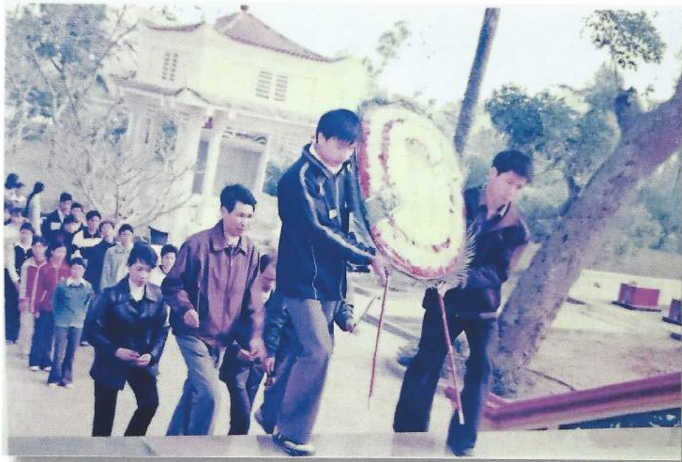
Thầy trò nhà trường viếng và thắp hương nghĩa trang các anh hùng liệt sĩ huyện