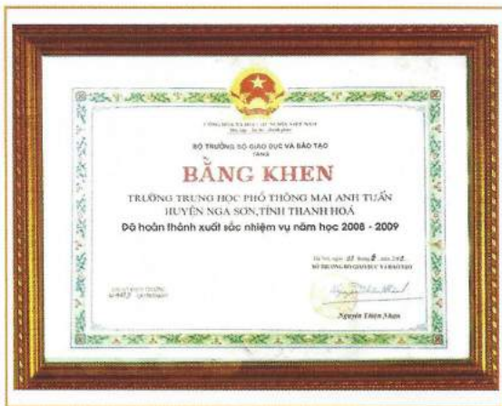
Bộ trưởng Bộ Giáo dục và đào tạo tặng Bằng khen đơn vị hoàn thành xuất sắc nhiệm vụ năm học 2008 - 2009