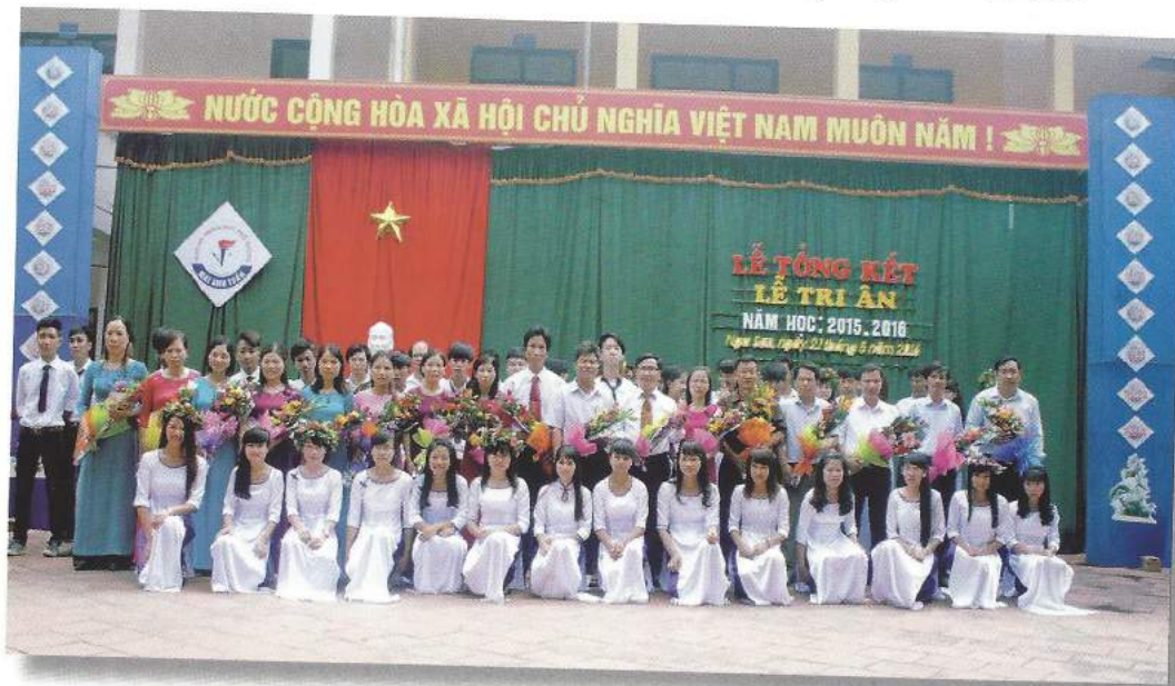
Học sinh tặng hoa tri ân thầy giáo cô giáo nhà Trường