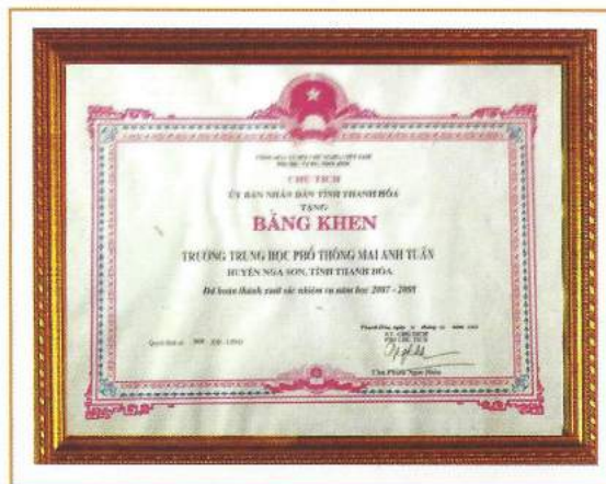
UBND Tỉnh Thanh hoá tặng Bằng khen đơn vị hoàn thành xuất sắc nhiệm vụ năm học 2007 - 2008