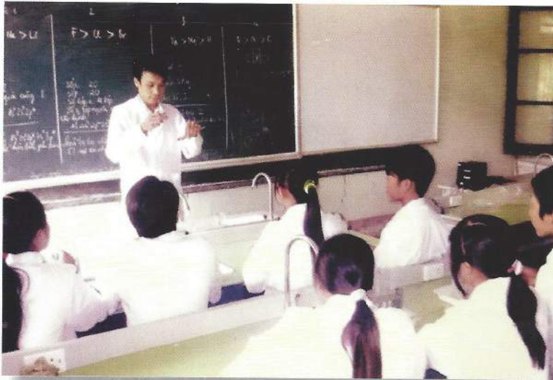
Một tiết thực hành môn Hoá học của Trường