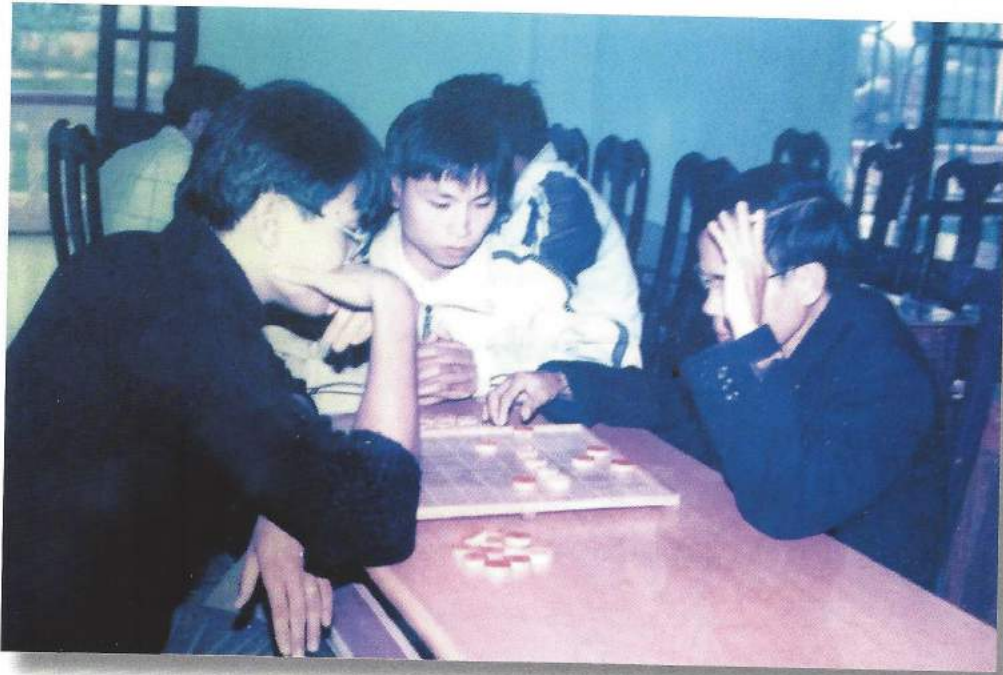
Thầy cô giáo tham gia giải TDTT cấp trường môn Cờ tướng