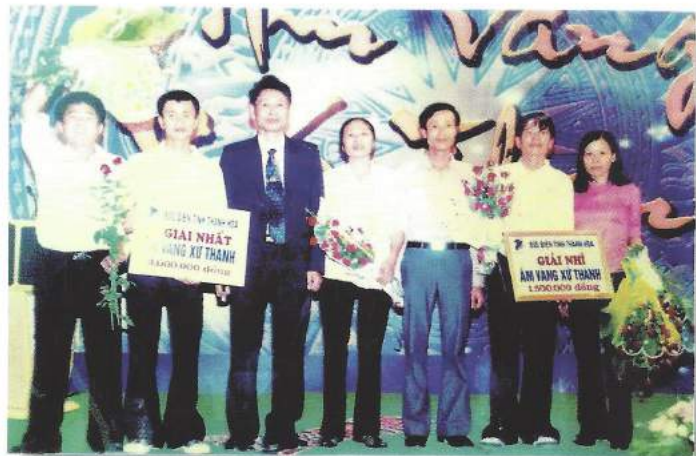
Học sinh nhà trường tham gia chương trình “Âm vang Xứ Thành”