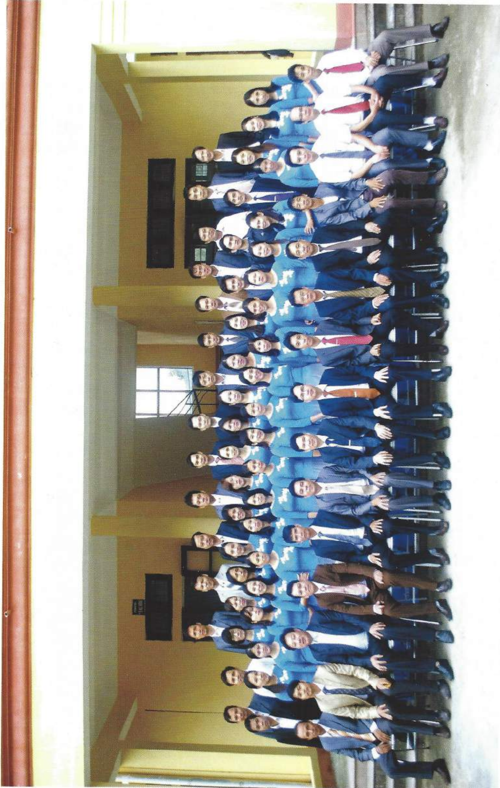
Tập thể Giáo viên Trường THPT Mai Anh Tuấn