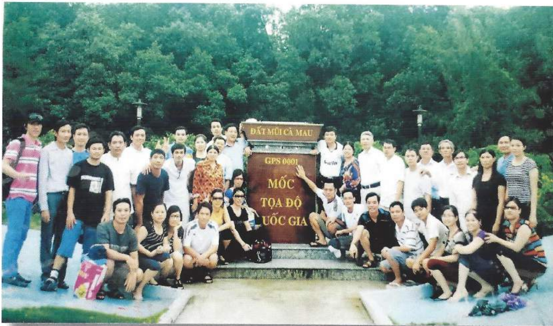
Tập thể CB, GV, NV nhà trường tham quan, thực tế các tỉnh Miền Tây