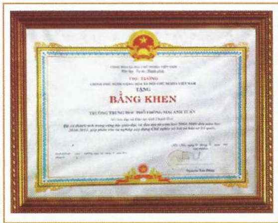
Thủ tướng Chính phủ tặng Bằng khen đơn vị đã có thành tích trong công tác Giáo dục và đào tạo từ năm học 2008 - 2009 đến năm học 2010 - 2011