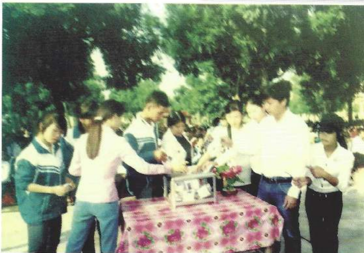
Thầy cô giáo cùng các em học sinh quyên góp ủng hộ trẻ em mồ côi, khuyết tật