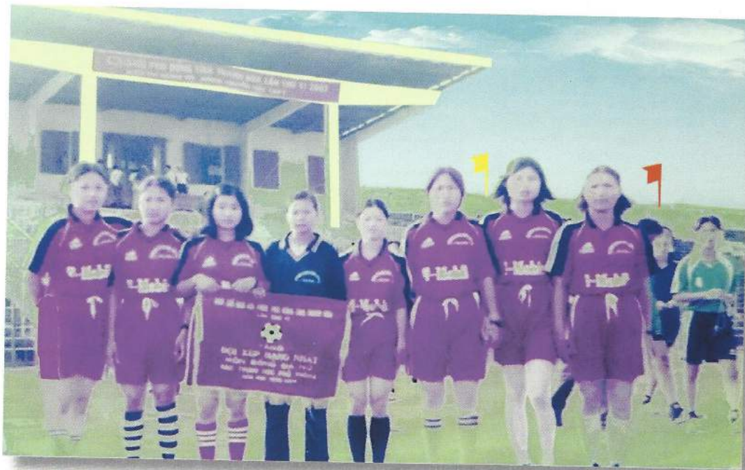
Đội tuyển Bóng đá nữ của nhà Trường