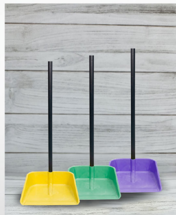
Recogedor de Plástico