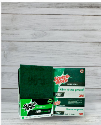
Fibra Verde Scotch-Brite