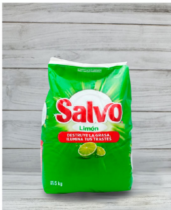
Detergente en Polvo

Marca: Salvo PKG: 1 L N.W: 1 L PLU: UDMV: Pieza