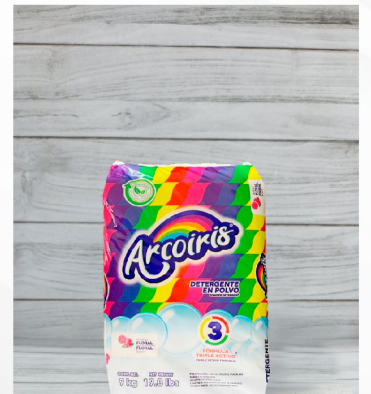
Detergente en Polvo

Marca: Axion PKG: 720 Kg N.W: 750 kg PLU: UDMV: Pieza