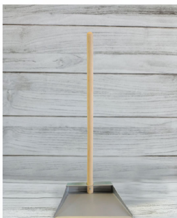
Recogedor de Lámina

Marca: PKG: 20 L N.W: 20 L PLU: UDMV: Pieza