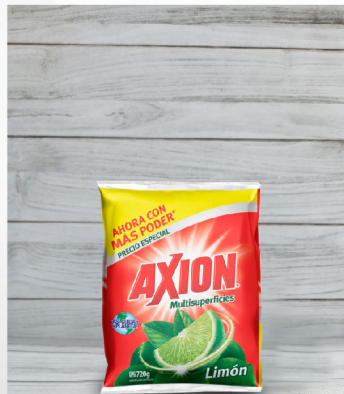
Detergente en Polvo

Marca: Axion PKG: 1 L N.W: 1 L PLU: UDMV: Pieza