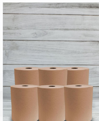
Toalla Rollo Cafe