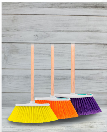
Escobas de Plástico