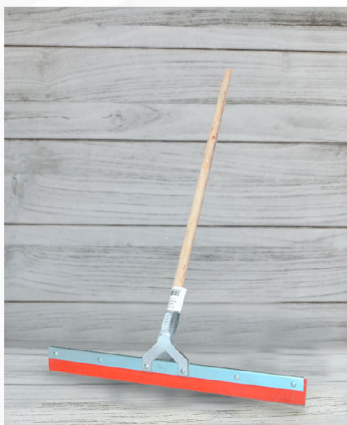
Jalador de Agua