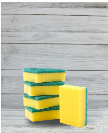
Esjonja Para Trastes