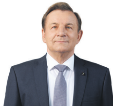
5 RIMANTAS SINKEVIČIUS