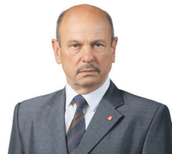
43 ARVYDAS BALČIŪNAS