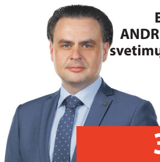
Erlandas ANDREJEVAS: svetimų reikalų nėra