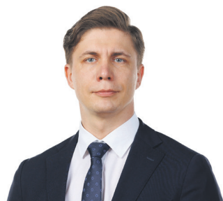
Mindaugas SINKEVIČIUS, g. 1984-06-20 Numeris sąrašė - 1