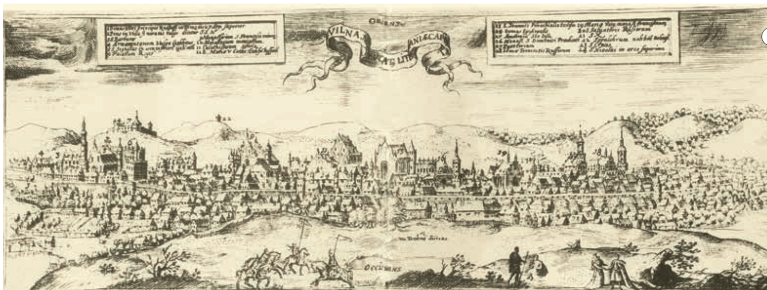
16. Vilniaus panorama. T. Makowskio ofortas, 1600