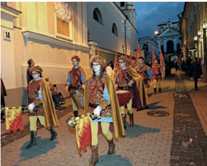
Iškilingų renginių, skirtų Oršos mūšio 500 metų minėjimui Vilniuje, vaizdai