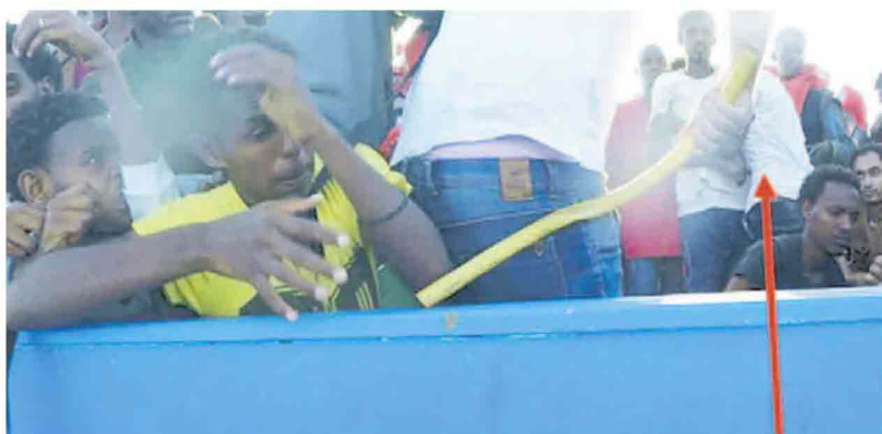
▲ Colpi con un tubo di ferro Un'altra immagine dello scafista mentre picchia i migranti davanti ai volontari della nave "Vos Hestia"