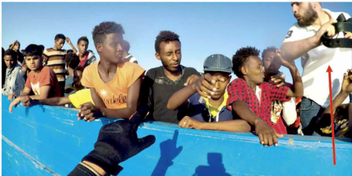
▲ Il trafficante picchia i migranti Il 26 giugno 2017, lo scafista continua a colpire i migranti con una cintura, davanti ai volontari appena arrivati