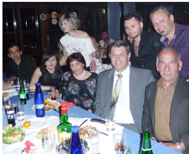
Πάρτι Γενεθλίων στου Τσιάκα, όλοι παρόντες, και το κέφι στα ύψη ως συνήθως.